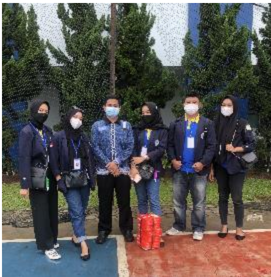
Gambar 2. Pelepasan PKPM di Kampus