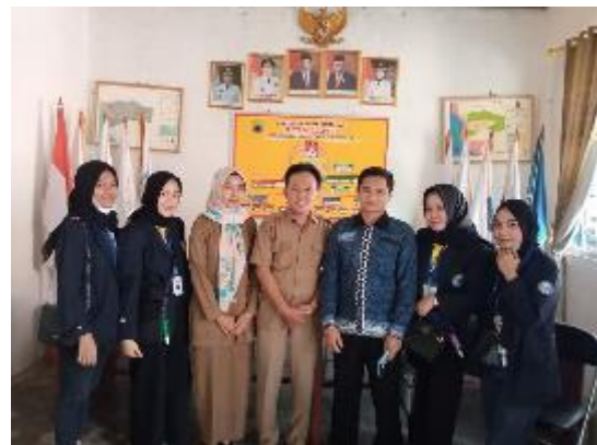
Gambar 3. Pelepasan PKPM di Balai Desa