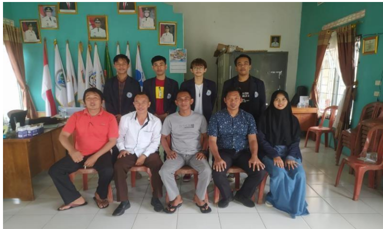
Gambar 3 : Kunjungan ke Desa KEKILING