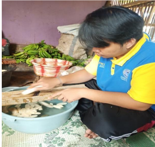
Gambar 8 : Penggorengan, Pengirisan, Pengupasan