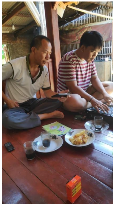
Gambar 9 : Pengembangan Smartvilagge