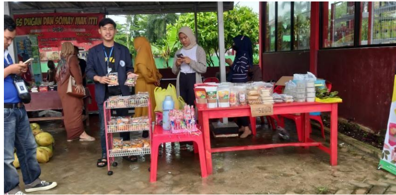
Gambar 13 : Bazar serba Goceng