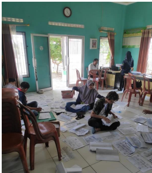
Gambar 11 : Membantu aparaturnya melakukan Komite