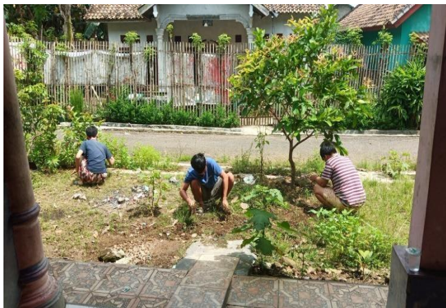
Gambar 6 : Gotong Royong