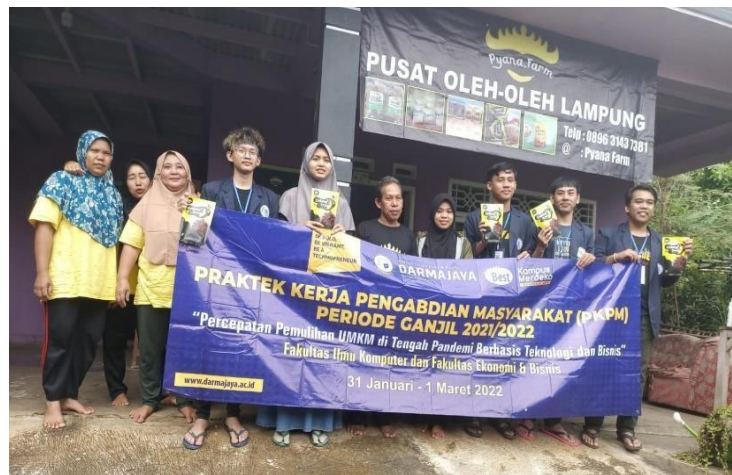
Gambar 4 : Proses Pemasangan Banner