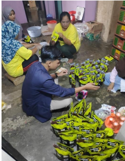
Gambar 5 : Proses Pengemasan