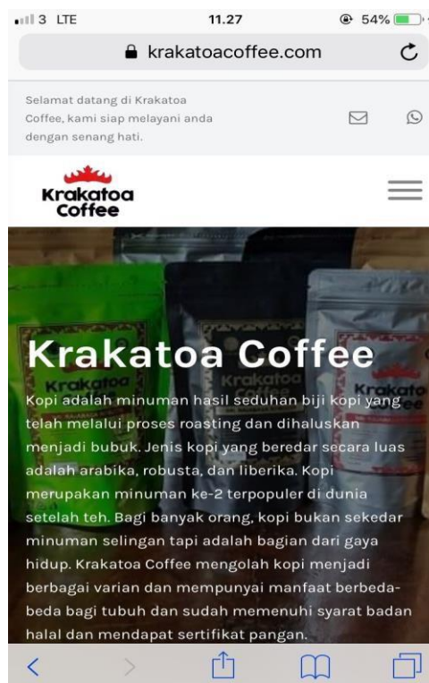
Gambar 5 : Tampilan awal web pada android & ios