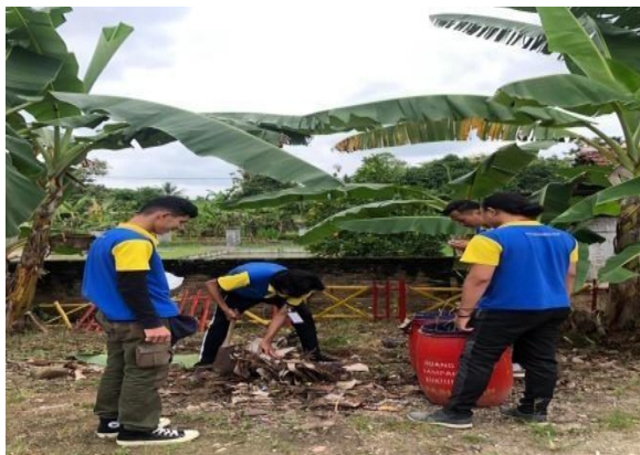
Gambar 3. Gotong Royong

Gotong royong yang diadakan desa pasuruan pada tanggal 05,10,26 Februari 2022 bersama masyarakat desa pasuruan untuk membantu membersihkan area balai desa dan rumah warga yang tertimpa pohon akibat cuaca hujan dan angin kencang. Dengan adanya kegiatan ini dapat menimbulkan rasa saling tolong menolong dan kebersamaan masyarakat desa pasuruan.