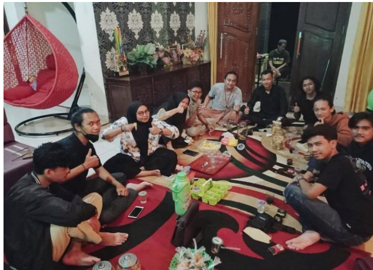
Gambar 9 : Silaturahmi Ke Rumah Kades Pasuruan