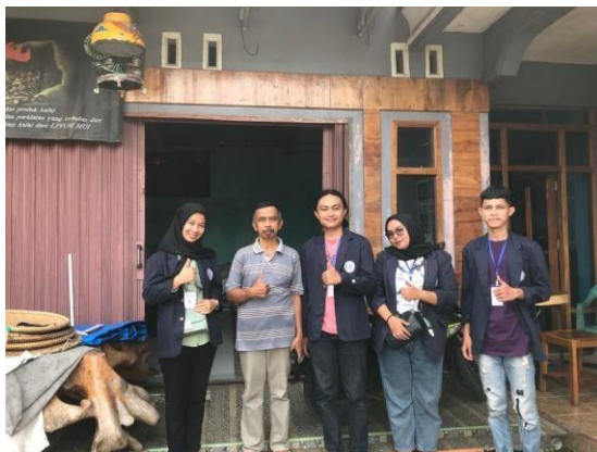
Gambar 1. Kunjungan UMKM

Kunjungan yang dilakukan ke UMKM pada tanggal 20 Januari 2022 adalah untuk mengetahui bagaimana usaha Krakatoa Coffee selama berdiri. Selain itu, berdiskusi dengan pemilik usaha apa saja hambatan yang di alami selama menjalankan usaha. Dari hasil diskusi ini di dapatkan hasil berupa inovasi pembuatan web untuk memberikan informasi terkait Krakatoa coffee dari usaha UMKM tersebut.