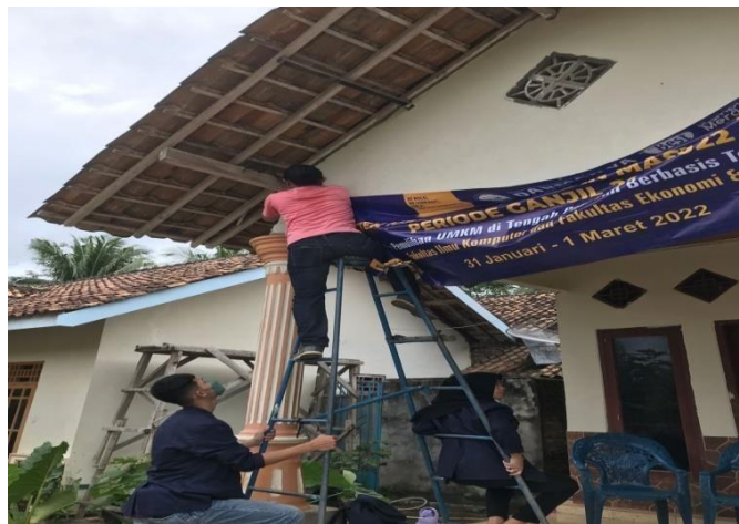
Gambar 7 : Proses Pemasangan Banner