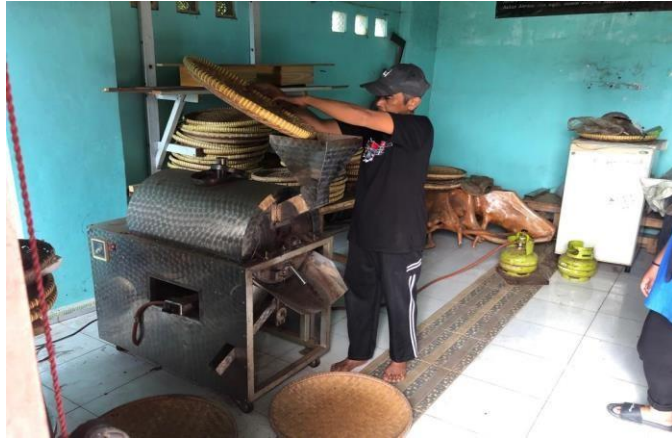
Gambar 8 : Proses Pemanggan Kopi