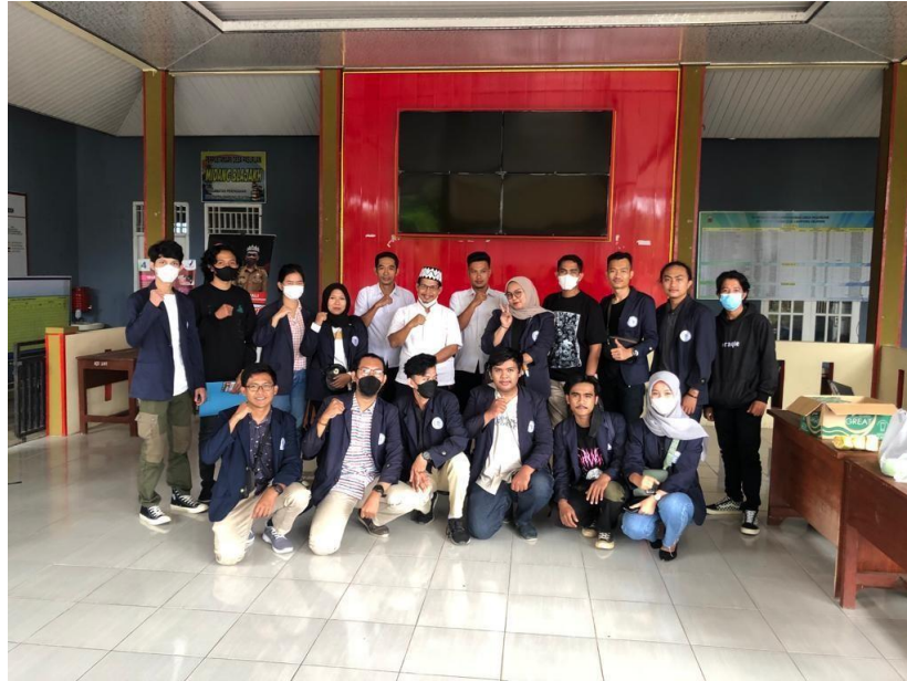
Gambar 6 : Kunjungan ke Desa Pasuruan.

Berikut gambar dokumentasi yang diambil selama melakukan Praktek Kerja Pengabdian Masyarakat :