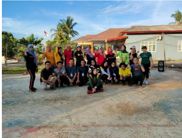
Gambar 2. Senam Bersama