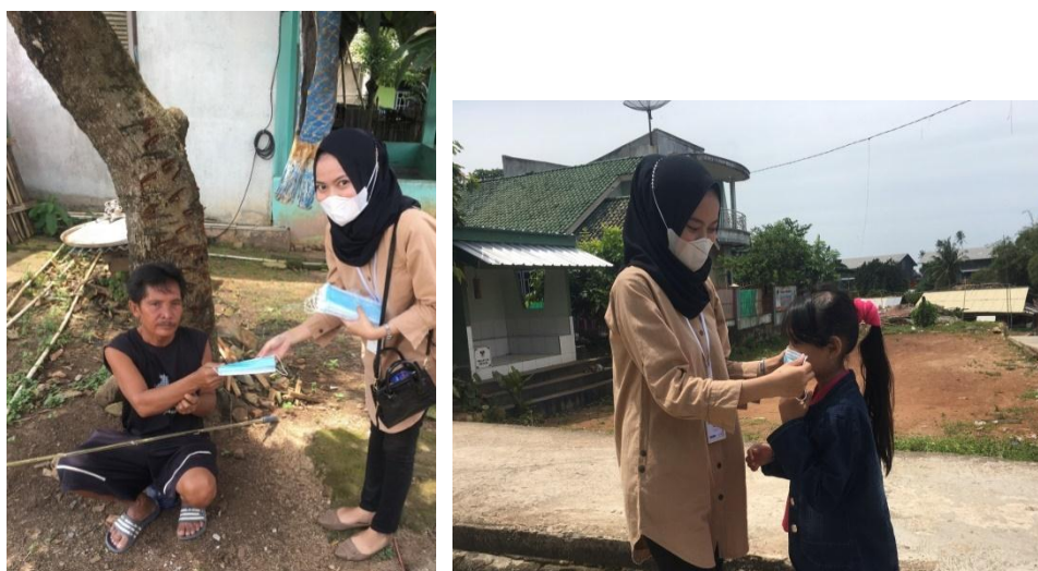
Gambar 3.3.3 Kegiatan Pembagian Masker

Pembagian masker gratis dilakukan sebagai upaya dalam mencegah menyebarnya Virus Covid-19 dan sebagai wujud kepedulian kepada masyarakat khususnya warga RT 11 LK.1 Kel. Garuntang Kec. Bumi Waras. Dikarenakan masih ditemukan warga yang keluar rumah tanpa memakai masker, dengan pembagian masker gratis ini diharapkan kesadaran warga bahwa pentingnya memakai masker saat berpergian keluar rumah agar mencegah penularan atau penyebaran Virus Covid-19.