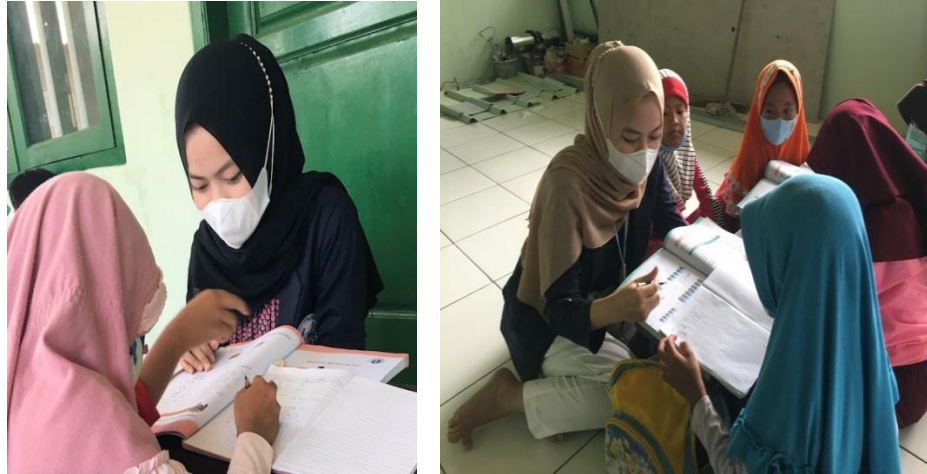
Gambar 2.3.1 Kegiatan Pendampingan Belajar Murid