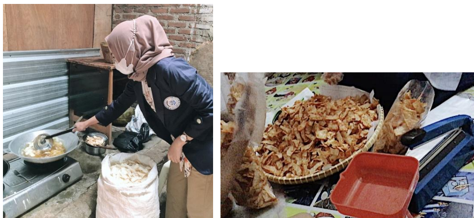
Gambar 2.3.9 Kegiatan Membantu UMKM Keripik Manggleng

Keripik singkong merupakan salah satu camilan yang mudah ditemui di Indonesia, selain rasanya gurih ternyata keripik singkong dapat bertahan kurang lebih satu tahun jika dibuat dan dikemas dengan cara yang tepat. Di lingkungan RT 11 LK.1 Kel. Garuntang Kec. Bumi Waras tersebut terdapat UMKM Keripik Manggleng, disana saya membantu memproduksi Keripik Manggleng tersebut mulai dari Penjemuran, Penggorengan, Memberikan Bumbu, sampai Pengemasan. Dengan didampingi oleh ibu-ibu dalam mengajarkan bagaimana langkah-langkah hingga sampai menjadi Keripik Manggleng yang siap untuk dijual dipasaran.