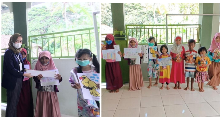
Gambar 2.3.8 Kegiatan Lomba Menggambar dan Mewarnai

Menggambar dan mewarnai adalah kegiatan yang menyenangkan bagi anak-anak. Dengan mengadakan lomba menggambar dan mewarnai mereka bisa menuangkan beragam imajinasi yang ada di kepala mereka. Gambar-gambar yang mereka hasilkan juga dapat menunjukkan tingkat kreativitas dan suasana hati masing-masing anak. Di sisi lain lomba menggambar dan mewarnai ini menjadi media pendidikan mental anak untuk siap menerima kemenangan dan kekalahan, sebab dalam setiap perlombaan pasti ada yang menang dan kalah.