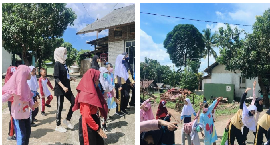
Gambar 2.3.6 Kegiatan Senam

Senam pagi merupakan kegiatan yang sangat berdampak positif bagi anak-anak maupun dewasa. Senam pagi dapat meningkatkan kesehatan dan kebugaran tubuh. Disamping itu, kegiatan ini dilakukan untuk mengisi waktu luang anak-anak yang masih menerapkan daring sekolahnya, dengan kegiatan yang lebih bermanfaat dibandingkan dengan hanya bermain saja atau menonton tv di rumah. Kegiatan ini berjalan lancar dan anak-anak terlihat bersemangat. Pada kegiatan ini juga dimasukkan unsur pesan-pesan untuk hidup sehat, permainan edukatif (education game) dan nyanyian penyemangat yang bertujuan untuk memberikan nuansa baru bagi anak-anak dan lebih menyenangkan.