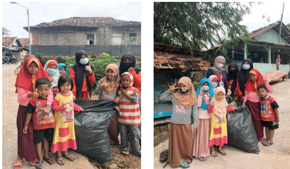
Gambar 2.3.2 Kegiatan Kerja Bakti

Kegiatan ini bertujuan untuk membersihkan lingkungan RT 11 LK.1 Kel. Garuntang Kec. Bumi Waras dari sampah yang dibuang sembarangan dan juga rumput liar yang tumbuh disepanjang jalan RT 11 LK.1 Kel. Garuntang Kec. Bumi Waras, dengan mengajak anak-anak dalam kegiatan kerja bakti ini agar menumbuhka rasa kepedulian terhadap lingkungannya.