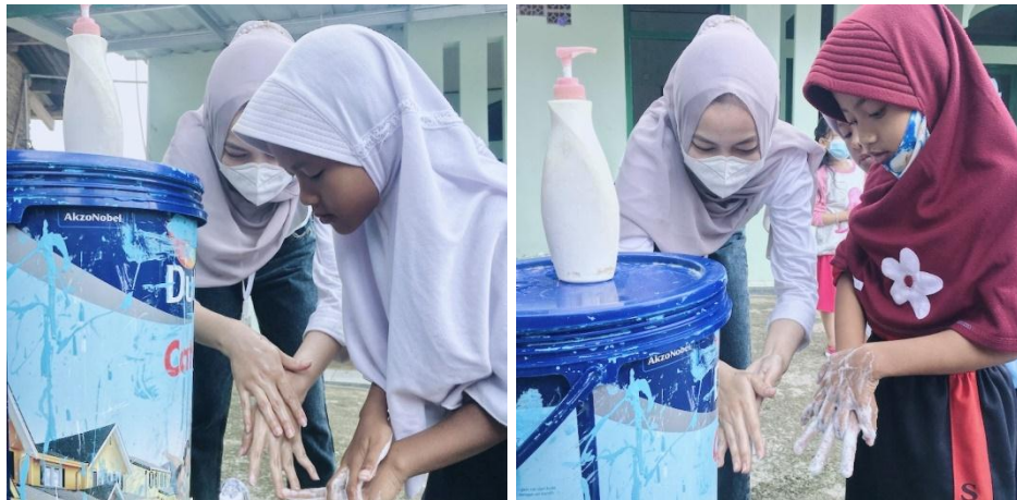
Gambar 2.3.7 Kegiatan Sosialisasi Mencuci Tangan.

sosialisasi mencuci tangan ini diharapkan anak mengerti cara mencuci tangan yang benar untuk cegah penularan Virus Covid-19.