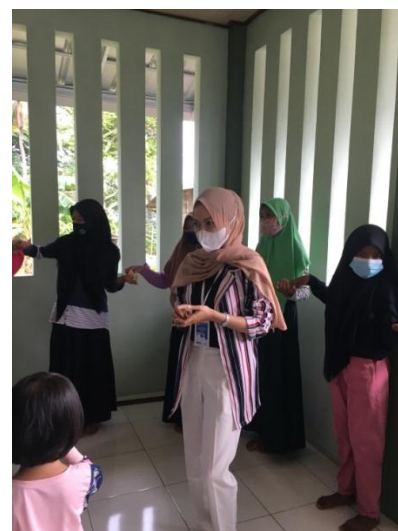
Gambar 2.3.5 Kegiatan Games Bersama Anak-Anak