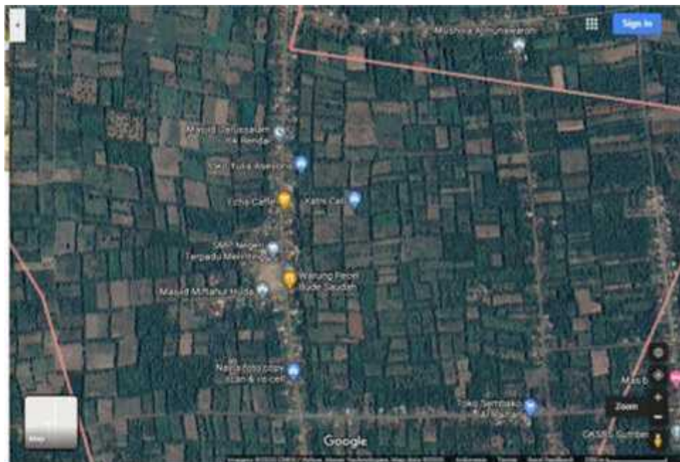
Gambar 2.1. Lokasi Desa

Didesa Bandar Sribhawono, Kecamatan Bandar Sribhawono Kab.Lampung Timur ,Lampung.