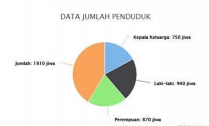
Gambar 2.2 Data Jumlah Penduduk