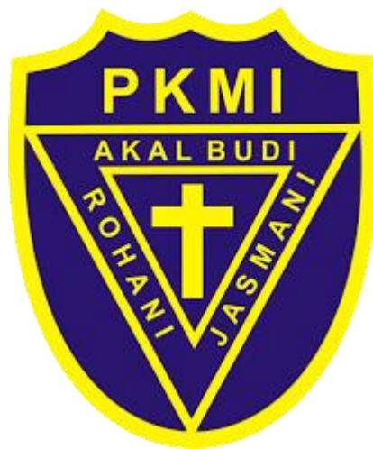
Gambar 2.1 Logo SD Immanuel Bandarlampung

Gambar 2.1 berikut merupakan logo dari SD Immanuel Bandarlampung