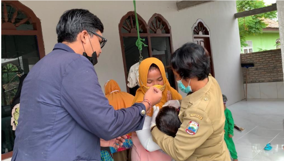
Sosialisasi covid-19 bersama bapak kepala desa dan bapak camat dan staff