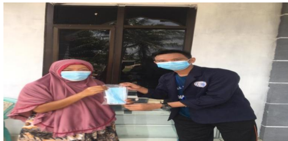
Gambar 2.3.5 Pembagian Masker

Memakai masker dan sosialisasi covid-19 menggunakan poster merupakan salah satu dari bagian protokol kesehatan yang wajib diterapkan guna menghindari penularan virus corona. Pembagian masker diharapkan akan membantu masyarakat agar lebih peduli dan waspada terhadap penularan covid-19.