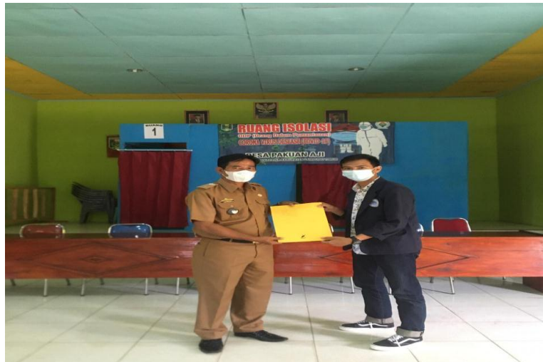
Gambar 2.3.7 penyerahan surat izin

Kegiatan penyerahkan surat izin untuk melakukan kegiatan praktek kerja pengabdian masyarakat(PKPM) terhadap Kepala Desa Pakuan Aji.