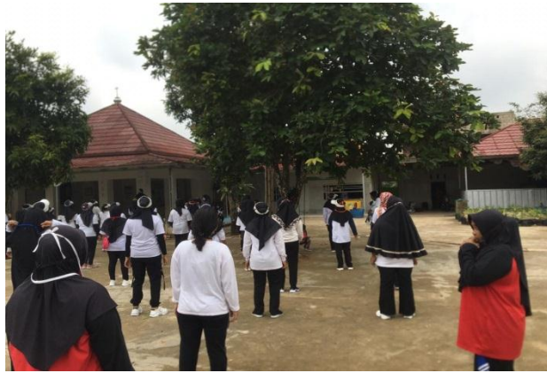
Gambar 2.3.6 Senam sehat

Program ini merupakan program yang selalu ibu-ibu Desa Pakuan aji lakukan setiap hari Sabtu dan Minggu pagi karena senam merupakan salah satu olah raga yang dapat memperkuat imun yang ada di tubuh. Dalam situasi pandemi covid 19 olah raga sangat penting di lakukan supaya imunitas tubuh tetap terjaga.