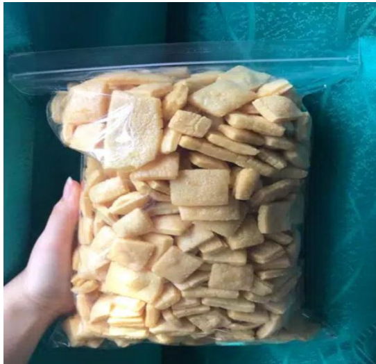
^ Gambar 2.3.1 Inovasi Produk dan Kemasan

Hasil inovasi dari kemasan yang mudah rusak akibat tali pengikat yang tidak kuat dan dikemas dengan menggunakan kemasan baru supaya lebih tahan lama.