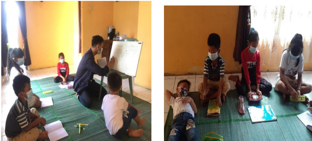
Gambar 2.3.4 Pendampingan Belajar Anak

Dimasa pandemi Covid-19 ini anak sekolah tidak diperbolehkan untuk tatap muka di Sekolah dengan Dewan Guru,dan proses belajar mengajar nya melalui media teknologi. Disini saya sedang melakukan kegiatan bimbingan belajar terhadap anak-anak sekolah dasar di seputaran lingkungan kediaman saya, dalam proses bimbel tetap memperhatikan protokol kesehatan dan siswa yang hadir hanya dianjurkan maksimal 1-4 orang.