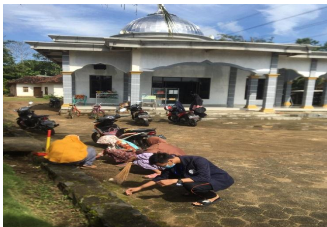
Gambar 2.3.3 kerja bakti di Masjid Nurul Iman

Program ini merupakan program yang memiliki tujuan untuk menjaga, kebersihan lingkungan serta meningkatkan rasa kekeluargaan, dan gotong royong antar sesama warga Desa Pakuan Aji Adapun hasil kegiatan ini adalah warga Desa Pakuan Aji Sp 3 khususnya kelompok Ibu-ibu pengajian yang rutin melakan bersih-bersih di Masjid Nurul Iman di Desa Pakuan Aji .