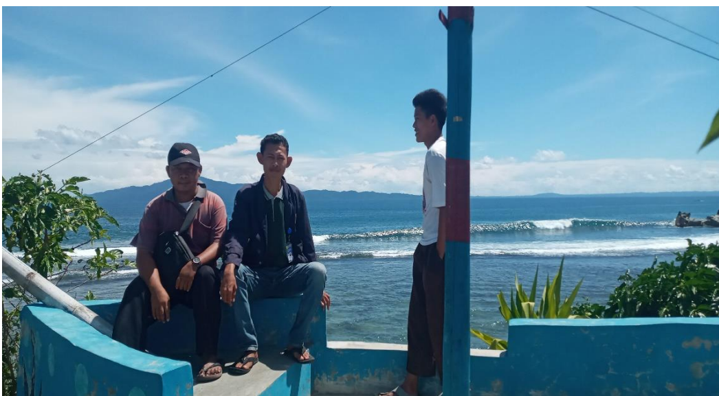
Gambar 2.9 Yaitu Tempat Wisata Karang Putih