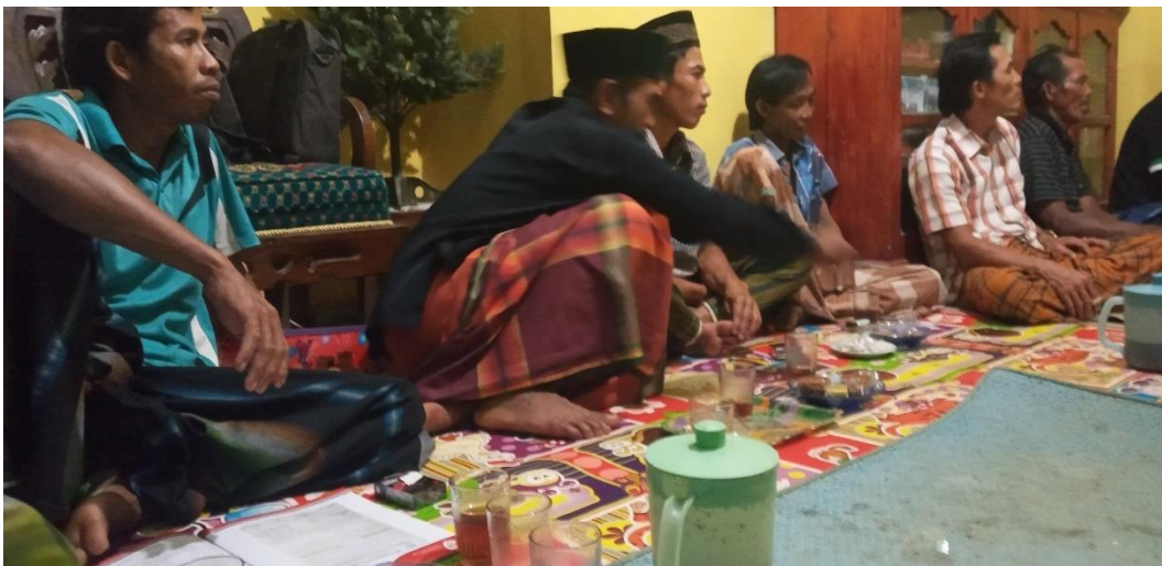
Gambaran 2.8 Yaitu Membahas Masalah Obat Pertanian Yang Akan Di Aplikasikan Kepada Masyarakat Nama Obat nya Adalah Eko Parming Dan Eko Rasing