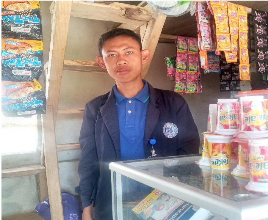
Gambar 1.9 Melakukan Pertanyaan UMKM Warung Sembako Di Desa Pampangan