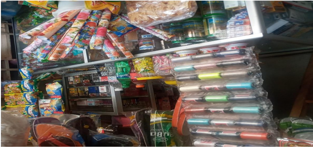
Gambar 2.7 Yaitu Tanya Jawab Masalah UMKM Di Dusun Sukapura