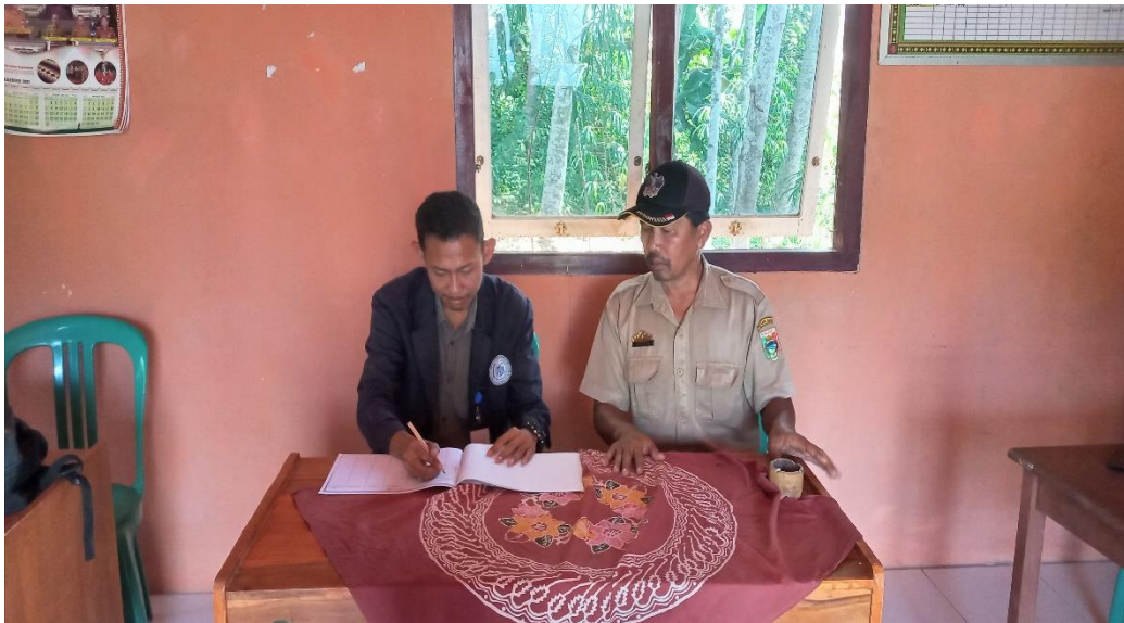
Gambar 2.6 Membantu Aparatur Desa Mengurus Surat NA Di Pekon Pampangan