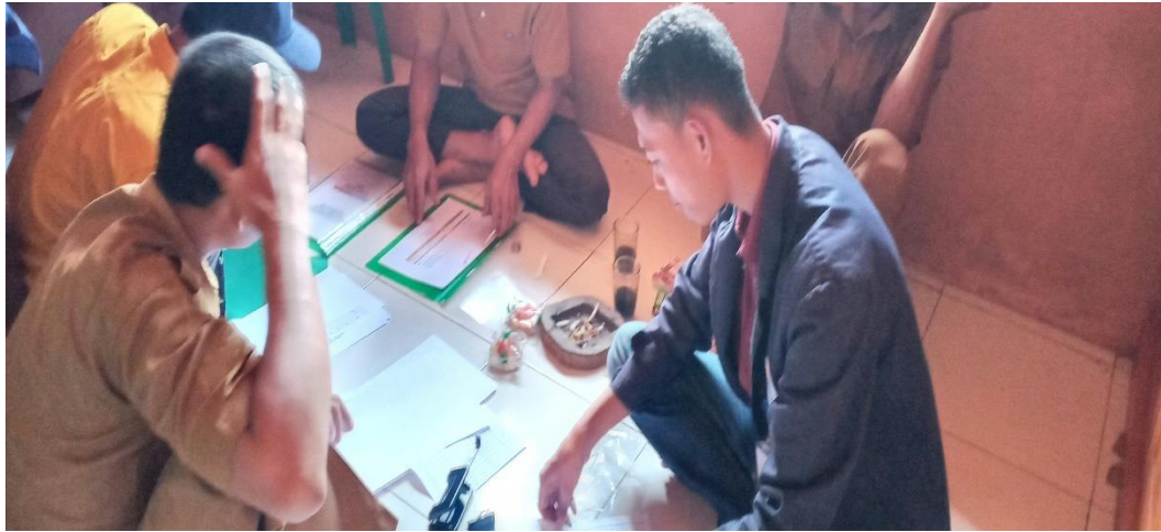
Gambar 2.1 Menulis Laporan Masalah Kehilangan E-KTP Masyarakat Pekon Pampangan Yang Telah Membuat Laporan Kepada Kepala Pekon