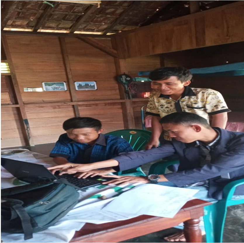
Gambar 1.7 Membantu Siswa SMPN 3 Cukuh Balak Menggunakan Word