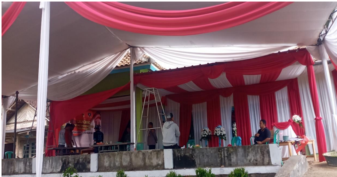
Gambar 2.2 Pemasangan Tarup Dan Bendera Di Kantor Kelurahan Yang Akan Mengadakan Kampung Tangguh Nusanntara