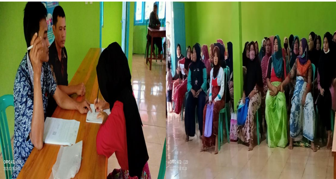
Gambar 1.6 Membantu Pekon Pampangan Membagikan Bantuan Bst