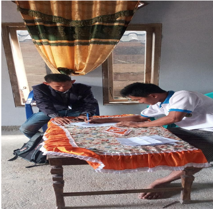
Gambar 1.2 Dan 1.3 Yaitu Permintaan izin pengadaan PKPM dengan Kelurahan Dan Pendataan Penduduk Yang Belum Membuat E-KTP Di Pekon Pampangan