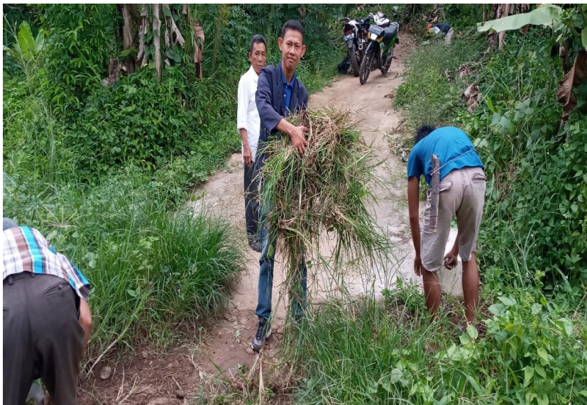
Gambar 1.8 Membantu Masyarakat Pekon Pampangan Membersihkan Lingkungan