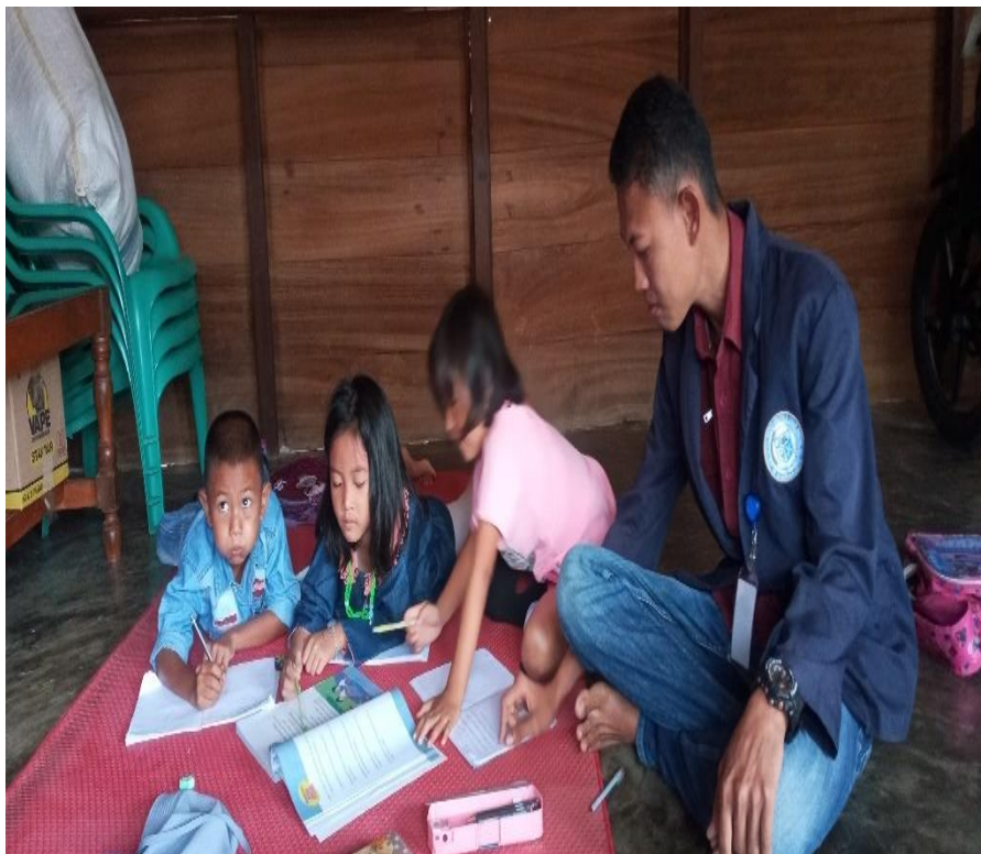
Gamabar 2.0 Pengawasan Anak SDN 1 Pampangan Dalam Pemberian Tugas Dari Guru Sekolahnya