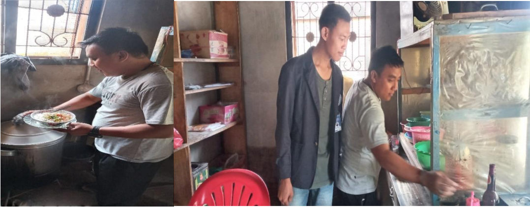
Gambar 1.5 Melakukan Sosialisasi Umkm Di Desa Pampangan