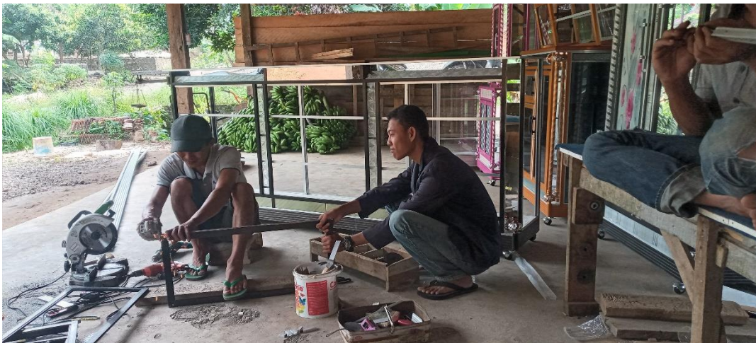
Gambar 3.1 Yaitu Melakukan Kegiatan UMKM Jual Beli Lemari Di Dusun Sukapura