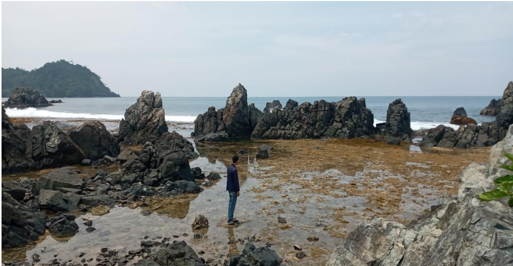
Gambar 3.0 Yaitu Tempat Wisata Yang Berada Di Tengor Nama Tepat Wisatanya Adalah Karang Bebai