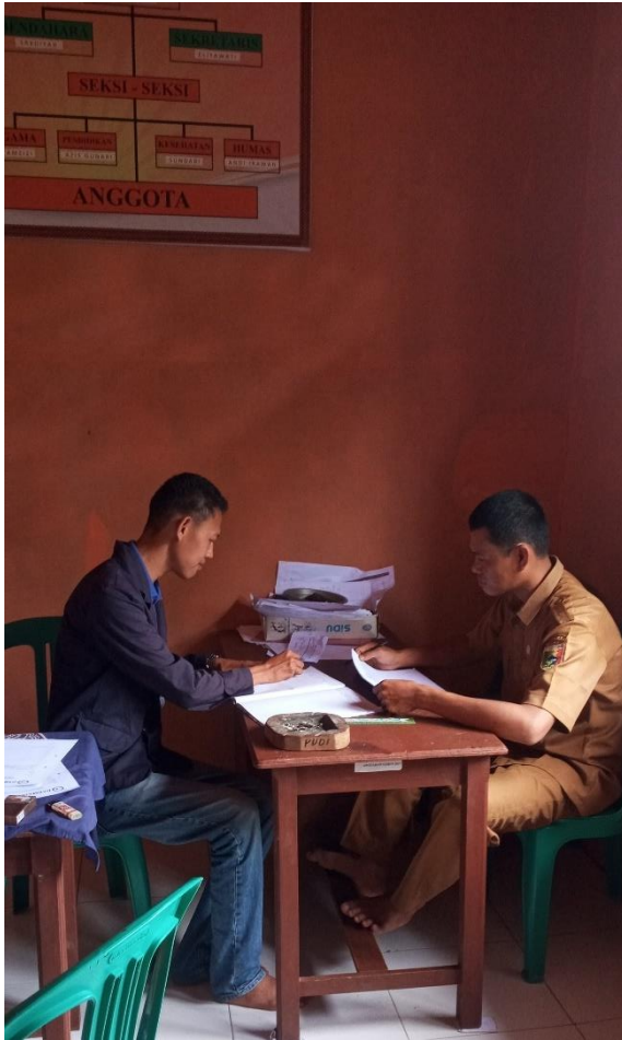
Gambar 1.4 Membantu Membuat Laporan Pekerjaan Pekon Pampangan