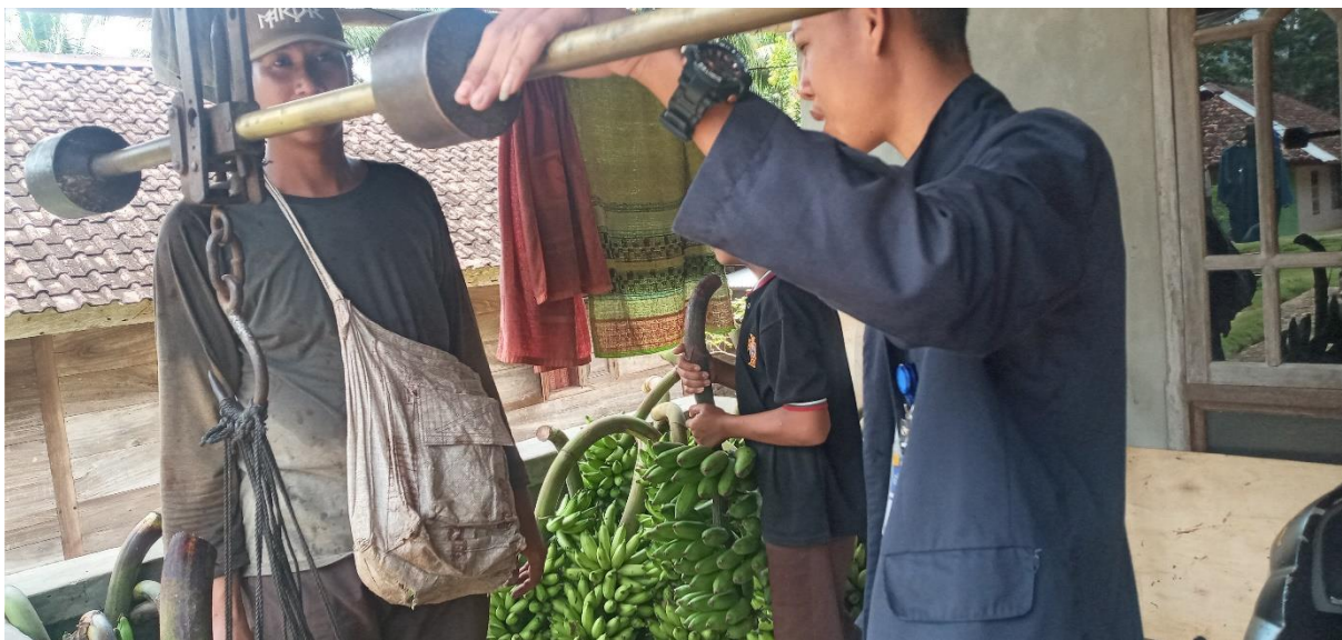
Gambar 2.4 UMKM Jual Beli Pisang Di Desa Pampangan