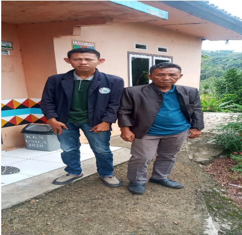
Gambar 3.2 Penutupan Sekaligus Perpisahan Pelaksanaan PKPM