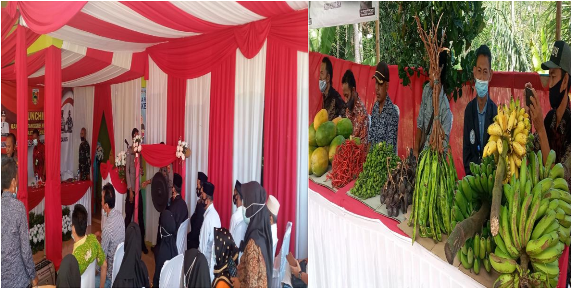
Gambar 2.3 Yaitu Loncing Nya Kampung Tangguh Nusantara Tingkat Kecamatan Di Desa Pampangan