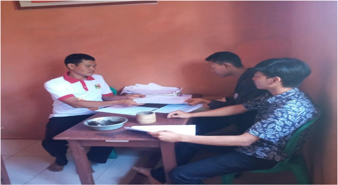
Gambar 2.5 Membantu Aparatur Desa Membuat Surat Perpindahan E-KTP Dan KK Dari Pekon Pampangan Ke Daerah Kota Jakarta