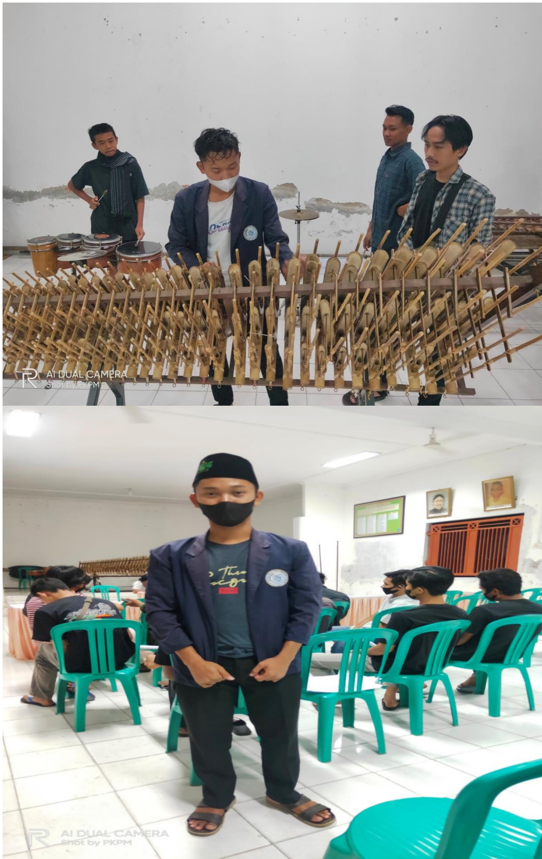
Gambar 2.4 Mengikuti kegiatan kepemudaan (karang taruna)