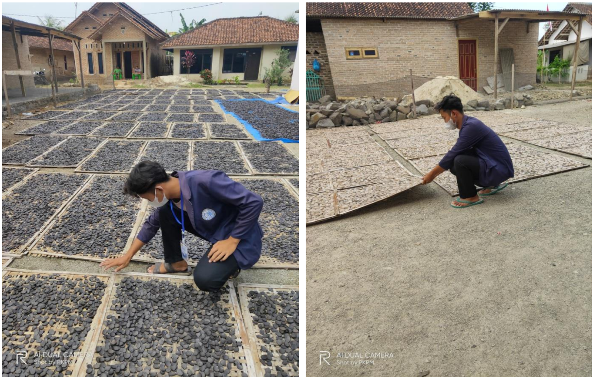
Gambar 1.3 Proses Penjemuran bahan baku krupuk