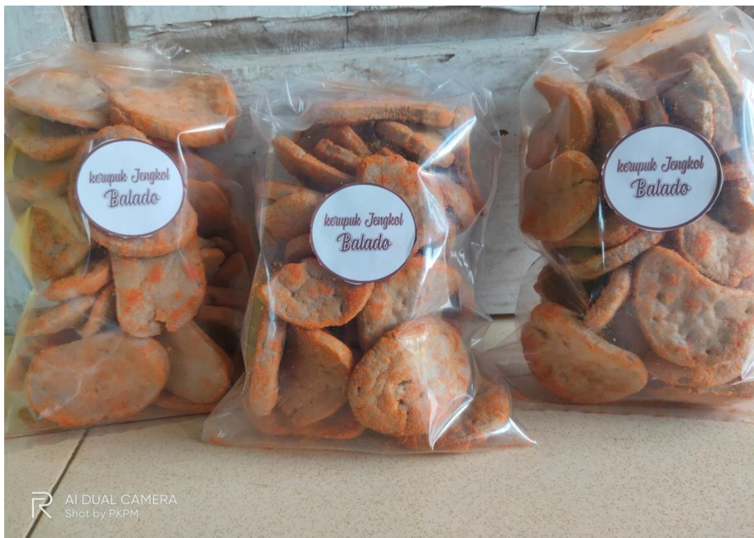
Gambar 4.2 Varian rasa baru krupuk jengkol balado