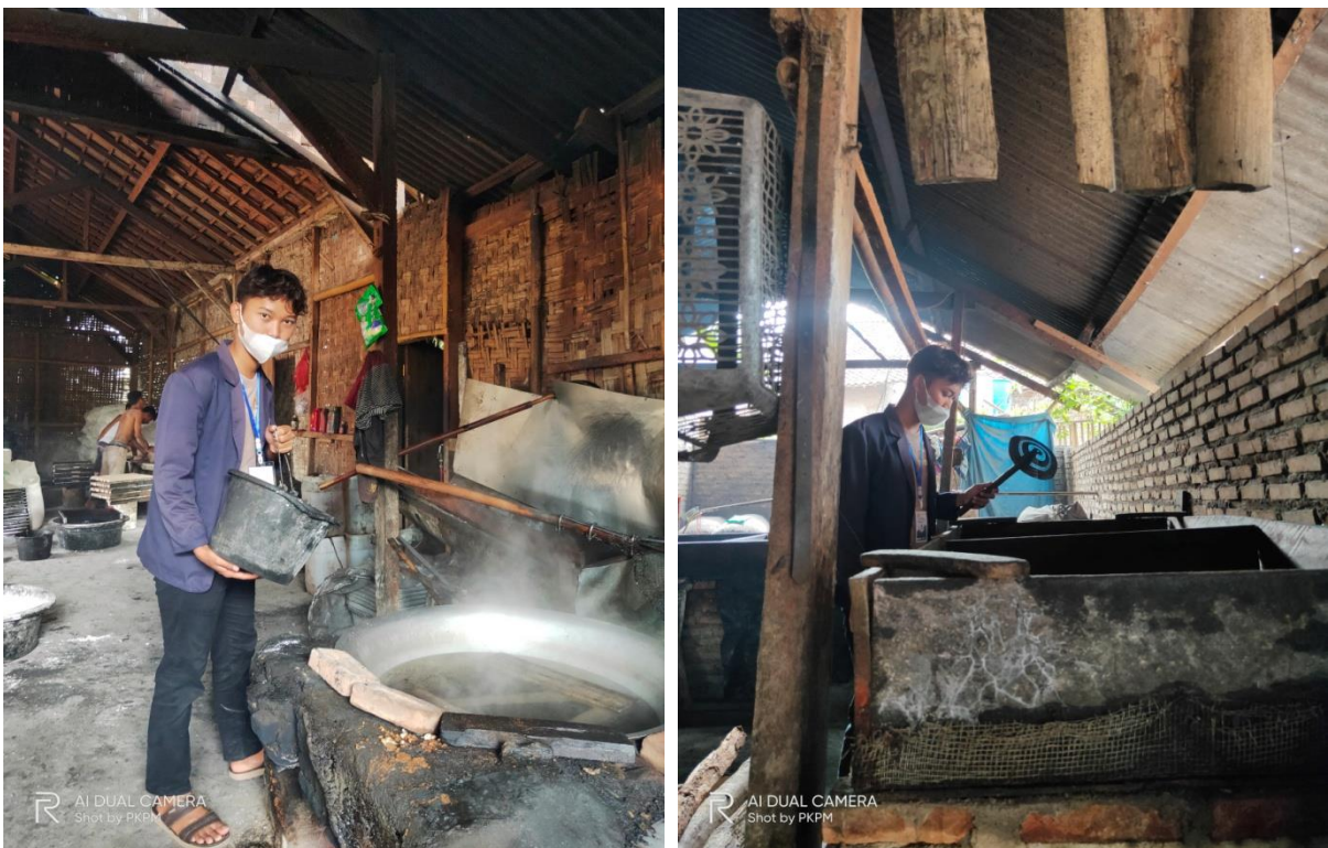
Gambar 1.4 Proses penggorengan dan pengukusan krupuk