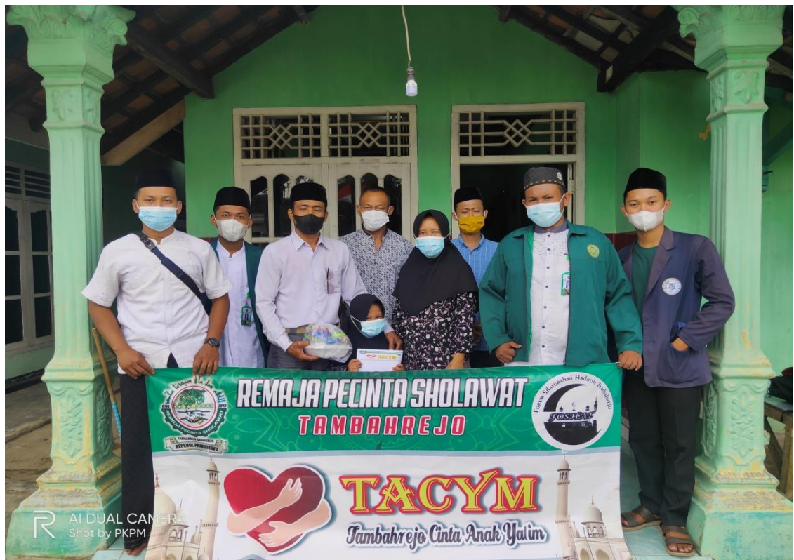
Gambar 2.2 Menyantuni anak yatim