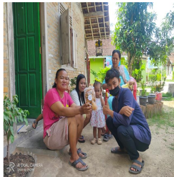
Gambar 4.3 Membantu Penjualan UMKM Krupuk Secara Delivery Order