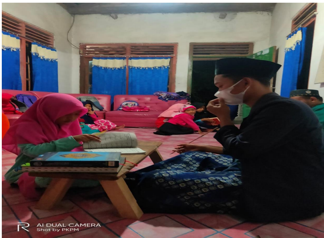
Gambar 3.3 Mengajar BBQ anak-anak di lingkungan sekitar