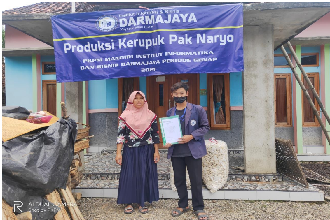
Gambar 4.5 Pelepasan PKPM Sekaligus Pemberian Cindramata Kepada pemilik UMKM