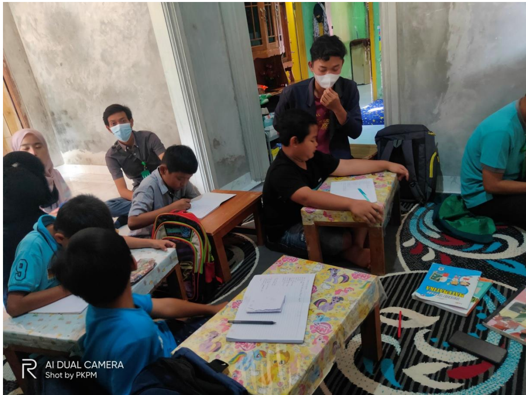
Gambar 3.2 Membantu anak-anak di lingkungan sekitar dalam belajar dan