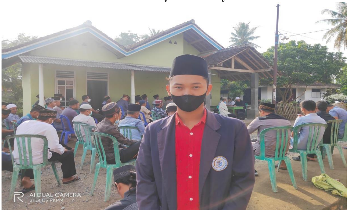
Gambar 2.3 Mengikuti kegiatan kemasyarakatan