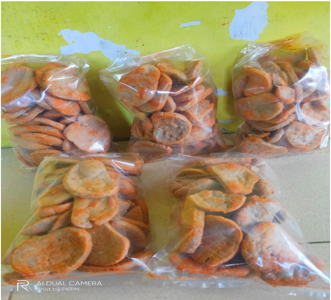
Gambar 3.3 Pembuatan varian baru krupuk