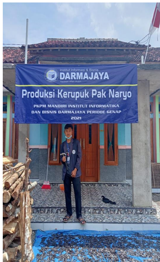
Gambar 3.4 Proses pemasangan Banner dan pembuatan logo kemasan