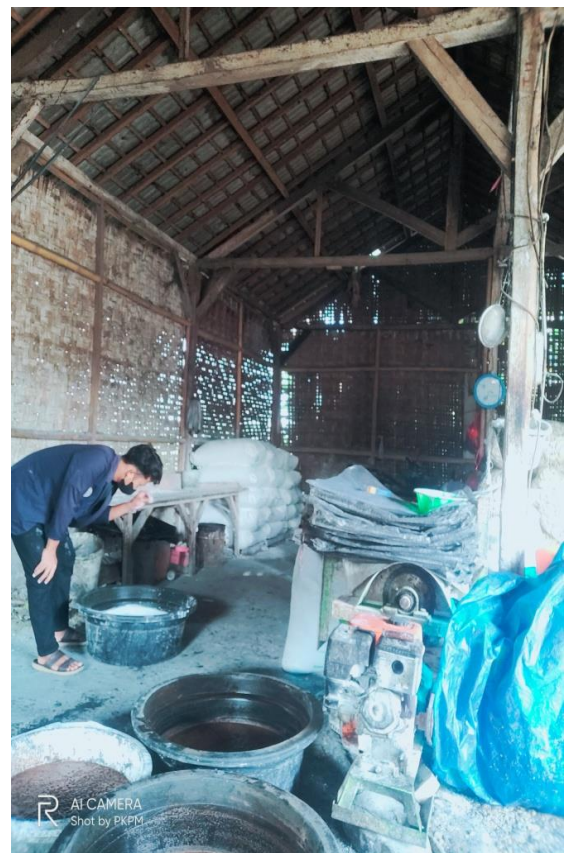
Gambar 1.2 Proses pembuatan bahan baku krupuk