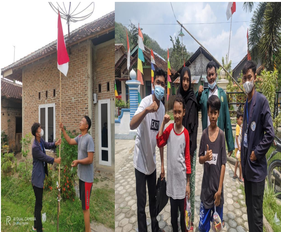
Gambar 2.1 Mengadakan Perlombaan di lingkungan sekitar