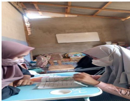
MENGAJAR BBQ BERSAMA ANAK ANAK DESA MARINGGAI