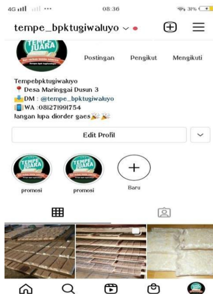
Gambar 2.1 Tampilan Akun Instagram Tempe Bpk Tugiwaluyo

Untuk Promosi UMKM Dari kegiatan-kegiatan yang telah dilaksanakan kami berhasil membuatkan akun instagram untuk Tempe bpk tugiwaluyo”. Tujuan pembuatan instagram ini adalah sebagai sarana promosi, sehingga harapannya dengan adanya instagram ini market pasar dari tempe” menjadi lebih luas dan masyarakat lebih mudah untuk mengetahui produk ini, serta akses pembelian oleh konsumen jauh lebih mudah. Berikut tampilan dari Akun Instagram yang telah dibuat.