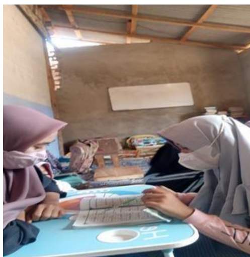
Gambar 2.3 Mengajar Bbq Pada Anak Anak Desa Maringgai

Kegiatan ini dilakukan Dengan Membantu Mengajar BBQ ini dilakukan agar anak-anak desa maringgai bisa belajar mengaji dengan baik.