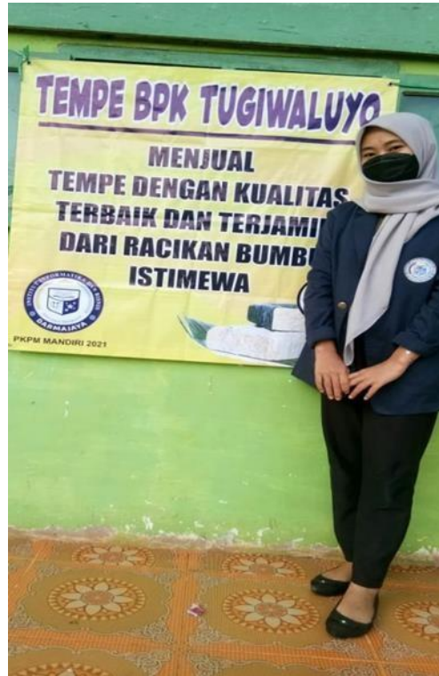
Gambar 2.2 Pemasangan Banner Pada UMKM Tempe