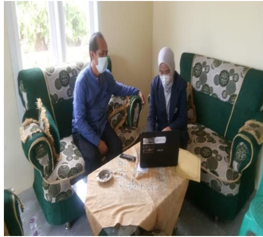
MEMPRESENTASIKAN HASIL KEGIATAN PKPM KEPADA KETUA RT