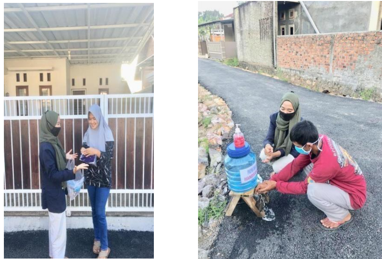
Gambar 2.4 Kegiatan Bersosialisasi Kepada Masyarakat Sekitar

Kegiatan yang telah dilakukan selanjutnya adalah pemberian sosialisasi kepada masyarakat sekitar. Dengan tujuan untuk membantu pemerintah dalam memutus rantai penyebaran COVID-19 dan mensosialisasikan New Normal kepada masyarakat. Karena masih banyak dari mereka yang tidak menerapkan protokol kesehatan dalam kehidupan sehari-hari.