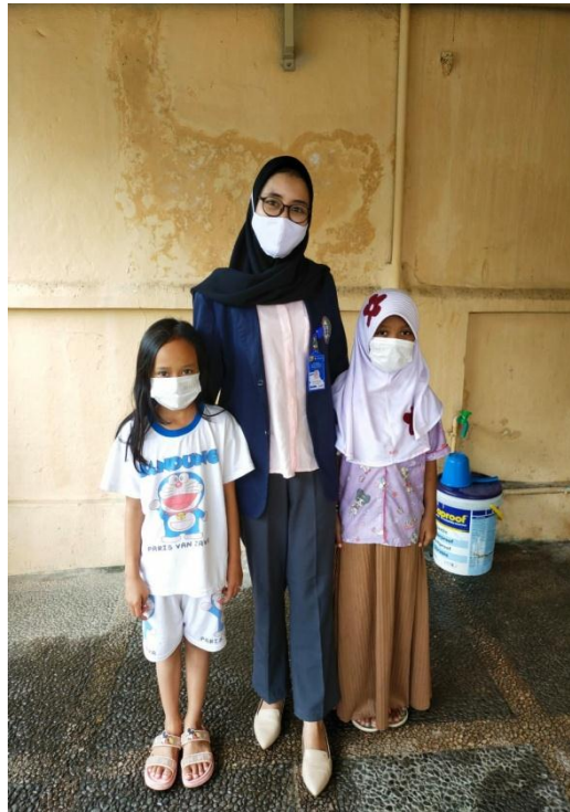
Gambar2.1 Mensosialisasikan Covid-19 Dengan Anak – Anak sekitar rumah.

Mensosialisasikan Covid-19 Dengan Anak – Anak sekitar rumah, terciptanya pemahaman tentang Covid pada anak – anak, menyadarkan anak – anak agar tetap bersih dalam bermain maupun melakukan aktivitas apapun.