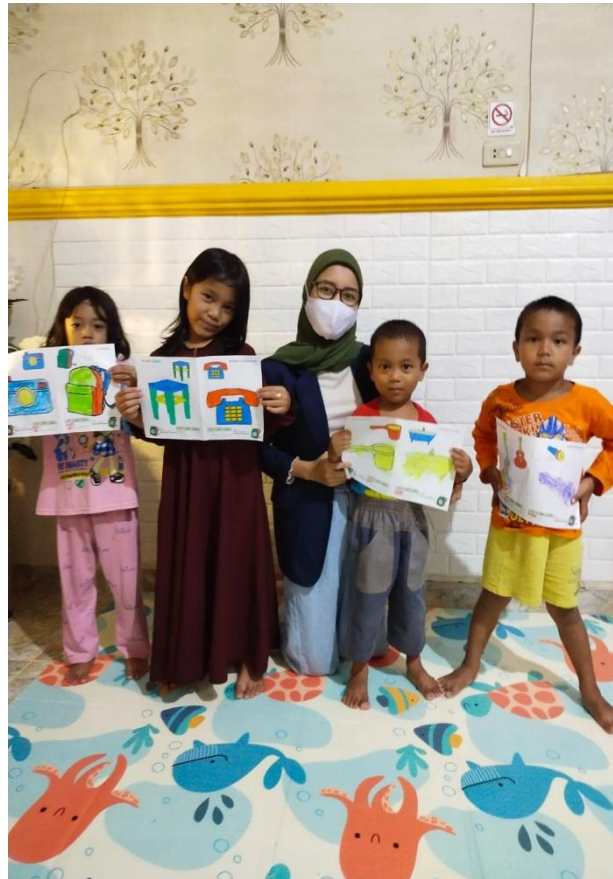
Gambar 2.3 Membimbing anak – anak Tk belajar Mewarnai.

Membimbing anak – anak Tk Belajar mewarnai, banyak anak – anak yang putus sekolah Tk atau Paud nya karena Covid-19, banyak orang tua mereka yang beranggapan bahwa dengan kondisi saat ini mereka harus memeberentikan sekolah paud atau Tk anak – anak nya dikarnakan biaya dan pembelajaran online yang tidak efektif untuk anak – anak seusia mereka yang masih sekolah di Paud atau Tk, makadari itu saya memutuskan untuk membimbing mereka agar tetap mengingat pelajaran yang pernah mereka pelajari.