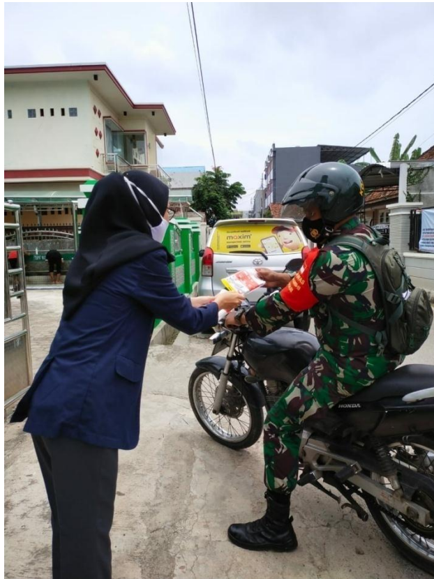
Gambar 2.2 Pembagian Masker pada Orang – Orang mau Sholat di Masjid.

Membagikan masker di Masjid adalah salah satu pemutus rantai covid-19 karena pada saat ini orang masih banyak yang menganggap bahwa covid-19 itu tidak ada di negeri kita ini, makadari itu tidak sedikit orang yang lupa memakai masker saat beribadah seperti ke masjid.