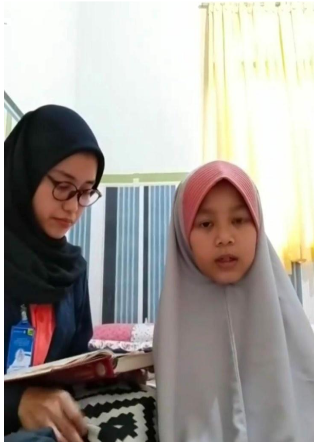
Gambar 2.4 Proses Pendampingan belajar Online Hafalan surah

Pembimbingan belajar online seperti hafalan surah, dengan kondisi saat ini sebagian anak – anak pesantren dipulangkan ke rumah masing – masing agar lebih terpantau oleh orang tua nya masing – masing, dengan begitu pihak pesantren sendiri tetap melakukan pembelajaran seperti biasa, dengan menggunakan sistem online, makadari itu saya membimbing salah satu santri yang saat ini berada di rumah orang tuanya di sekitar rumah saya.