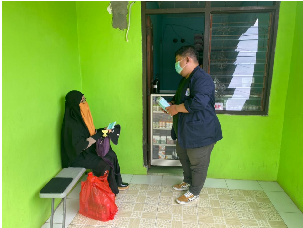
Gambar 2.2 Edukasi pentingnya kesadaran protokol kesehatan