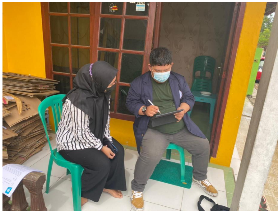
Gambar 2.1 Edukasi pentingnya sosial media