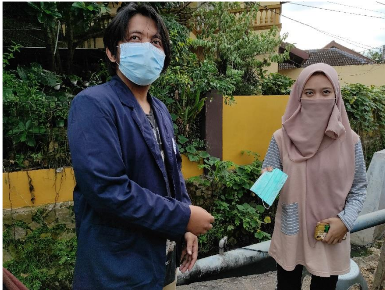
Gambar 2.13 Pembagian Masker

Situasi pandemic covid-19 ini masker menjadi alat protocol yang sangat penting. Banyak masyarakat yang belum memakai masker dikarenakan belum adanya kesadaran bahaya covid-19 ini. Dengan adanya program pembagian masker ini, diharapkan agar masyarakat lebih menyadari untuk mematuhi protokol kesehatan yang sudah ditetapkan oleh pemerintah setempat, berikut dokumentasi bersama masyarakat sekitar dalam membagikan masker: