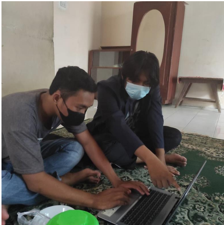
Gambar 2.7 Foto Bersama Pelaku UMKM

mengikuti karakteristik konsumen yang saat ini lebih senang berbelanja secara online dibandingkan dengan konvensional. Namun tidak banyak pelaku usaha yang memiliki website online karena prosesnya yang terbilang rumit. Untuk membantu pelaku UMKM dapat bangkit dan mempertahankan usahanya, program ini dibuat agar pelaku UMKM dapat dengan mudah membuat website mereka sendiri, berikut dokumentasi bersama Pelaku UMKM dalam mengajarkan pembuatan website dengan mudah: