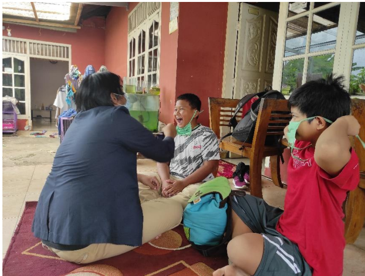
Gambar 2.2 Pemberian Vitamin Kepada Anak Sekolah

Mengingat ganasnya wabah COVID-19 saat ini, maka dari itu sangat dianjurkan untuk selalu menjaga kesehatan dan meningkatkan imun tubuh, terlebih kepada anak sekolah dasar yang imun tubuhnya tidak sekuat orang dewasa, maka dari itu salah satu program PKPM ini adalah memberikan vitamin dan madu kepada anak sekolah dasar agar dapat meningkatkan imun tubuh mereka, berikut gambar pemberian vitamin kepada anak sekolah dasar dibawah ini: