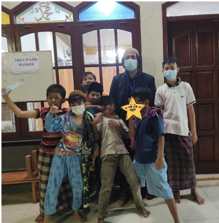
Gambar 2.12 Foto Bersama Anak-Anak Masjid Baitul Jannah

Indonesia sebagai negara dengan penduduk muslim terbanyak didunia sudah sepatasnya menjadi contoh untuk negara-negara muslim lain, tetapi pada faktanya sangatlah menyedihkan, lebih dari setengah penduduk Indonesia belum bisa membaca al-quran yang harusnya dijadikan sebagai pedoman hidup umat muslim itu sendiri, maka dari itu program ini dibuat untuk memberikan pembelajaran mengaji kepada anak sekolah dasar agar mereka bisa meneruskan apa yang telah diajarkan Rasulullah SAW, berikut foto dokumentasi dengan anak-anak masjid baitul Jannah kota sepang :