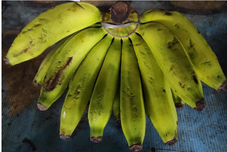
Gambar 2.9 Contoh Foto Produk Pisang

sehingga mereka dapat bersaing, berikut dokumentasi hasil foto produk yang telah dilakukan.