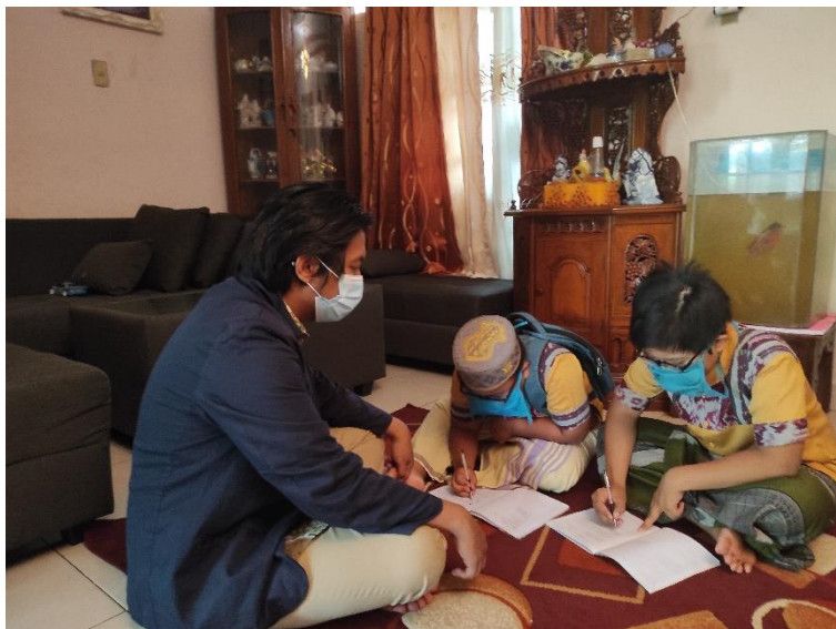
Gambar 2.3 Mendampingi Anak Sekolah Dasar Belajar Daring

Sudah setahun anak sekolah di daerah kota sepiang memperlakukan pembelajaran secara daring/ online , karna untuk mengantisipasi tertularnya Virus-19 yang ganas. Tetapi mereka masih kesulitan untuk beradaptasi belajar secara online, mengingat mereka masih sekolah dasar. Program PKPM kali ini adalah mendampingi kepada mereka belajar secara daring dan memberikan kemudahan agar tetap bisa menyerap ilmu yang diberikan oleh gurunya kepada mereka, berikut foto pendampingan belajar secara online :