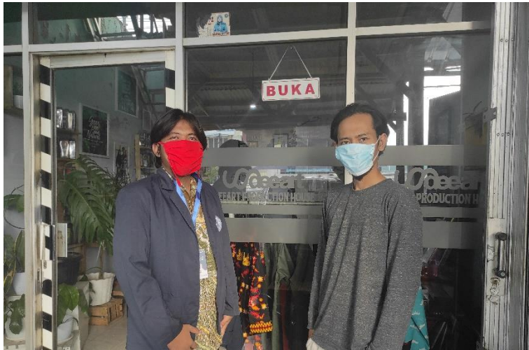
Gambar 2.10 Foto Bersama Pelaku UMKM