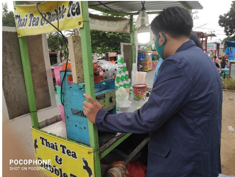
Gambar 2.6 Foto Pelatihan Penggunaan Marketplace

mengajarkan cara penggunaan marketplace khususnya penjual thai tea ini, karna sangat memungkinkan jika dia memanfaatkan marketplace pendapatannya akan sedikit bertambah seiring berjalan waktu, berikut dokumentasi bersama pelaku UMKM dalam memberikan pelatihan penggunaan marketplace :