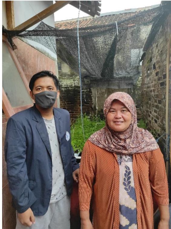
Gambar 2.11 Foto Bersama Ibu Rumah Tangga Yang Ingin Belajar Hidroponik

menghemat pengeluaran, jadi program ini cocok untuk menjawab permasalahan yang sedang dihadapi para ibu rumah tangga tersebut. Berikut dokumentasi bersama ibu rumah tangga dalam melakukan pelatihan hidroponik: