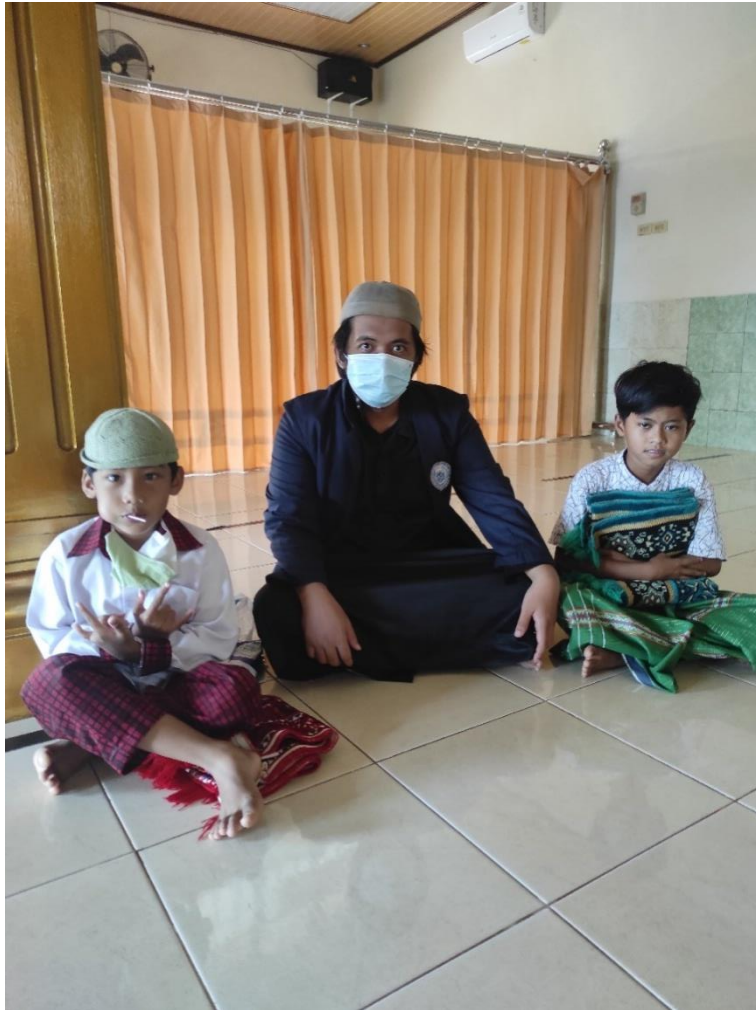
Gambar 4.4 Foto Bersama Anak Sekolah Dasar