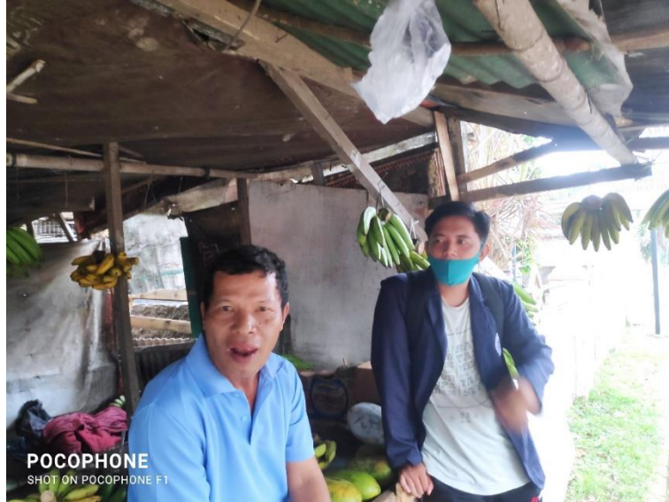
Gambar 2.8 Foto Bersama Pelaku UMKM

memiliki banyak sisi yang memudahkan setiap orang melakukannya. Program ini dilakukan pada pelaku UMKM agar mampu memanfaatkan perangkat digital dalam melakukan pemasaran. Berikut dokumentasi bersama salah satu pelaku UMKM: