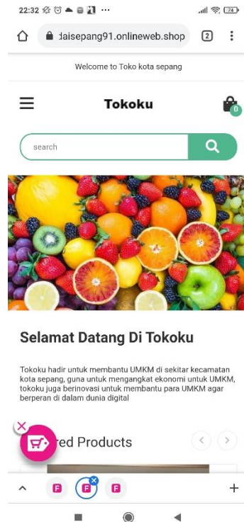
Gambar 2.14 Tampilan Website Tokoku

Website ini dibuat untuk menampung dagangan yang ada di sekitar kota sepang, agar membantu memasarkan dagangan mereka. Dengan harapan adanya website ini dapat membantu untuk menambahkan penghasilan mereka di masa pandemi ini dan mengangkat perekonomian di sekitar Kota Sepang: