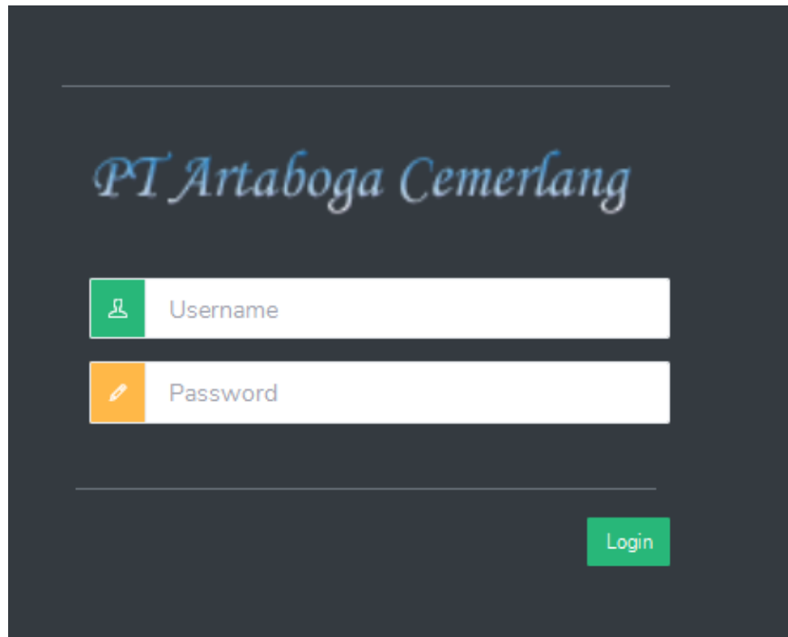
Gambar 4.2 Tampilan Halaman Login.