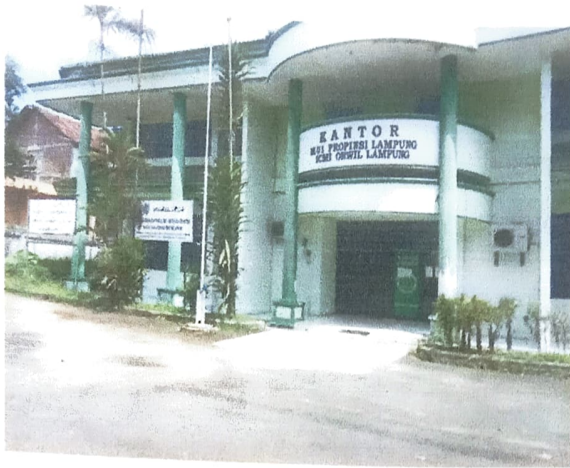
Gambar 1. Kantor LPPOM MUI Provinsi Lampung