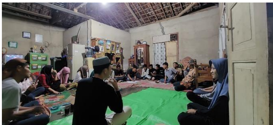
Gambar 2.10 Dokumentasi rapat panitia peringatan HUT RI