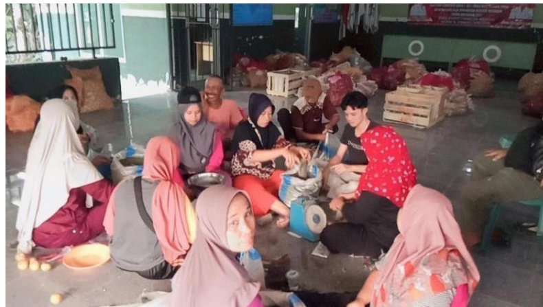
Gambar 2.6 Dokumentasi pengemasan sembako