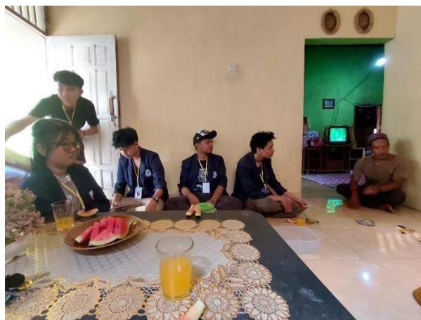
Gambar 2.2 Dokumentasi kunjungan ke rumah kepala dusun

Kunjungan ke rumah kepala dusun yang ada di desa Karang Raja untuk silaturahmi sekaligus memperkenalkan diri.