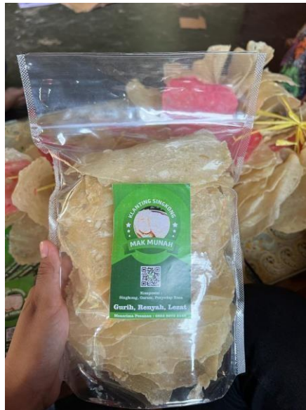
Gambar 2.24 Membantu pengemasan produk dan logo pada UMKM Klanting

Pengemasan produk dan logo pada UMKM Klanting Mak Munah.