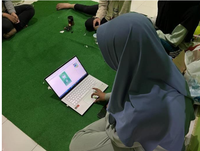
Gambar 2.21 Dokumentasi pembuatan logo UMKM Klanting

20. Pembuatan logo UMKM Klanting, Pelatihan pembukuan keuangan UMKMKegiatan ini merupakan perkembangan dari tahap sebelumnya yaitu pembuatan logo yang akan di letakkan pada kemasan produk. Dan juga pelatihan pembukuan keuangan sederhana untuk UMKM.