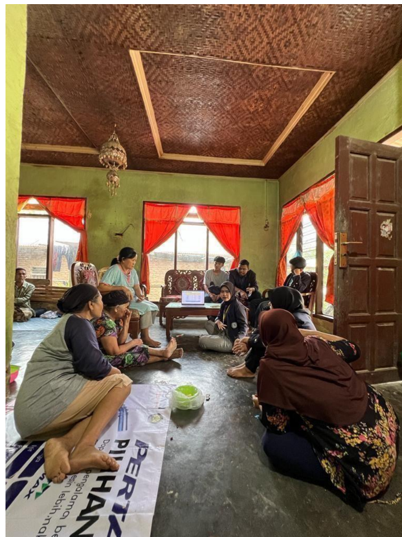
Gambar 2.22 Dokumentasi pelatihan pembukuan keuangan untuk UMKM Klanting