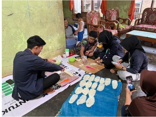
Gambar 2.23 Membantu proses produksi di UMKM Klanting

Proses produksi di UMKM Klanting sekaligus belajar bagaimana proses pembuatan klanting.