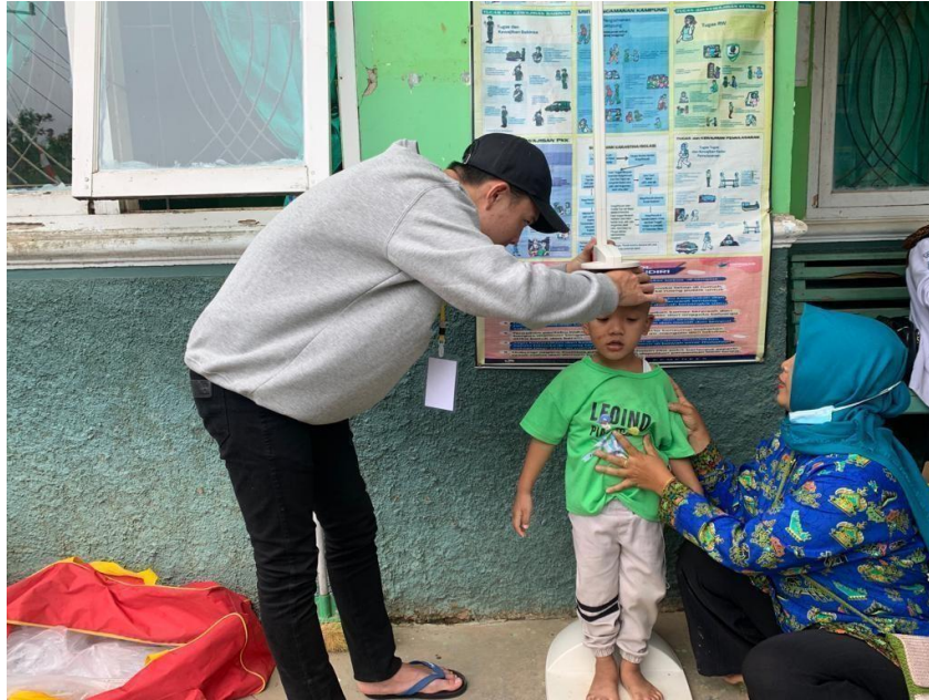
Gambar 2.9 Dokumentasi kegiatan posyandu balita

Kegiatan posyandu balita di desa Karang Raja dilakukan secara rutin setiap 1 bulan sekali. Maka kami bekerja sama dengan puskesmas kecamatan Merbau Mataram dalam kegiatan posyandu ini.