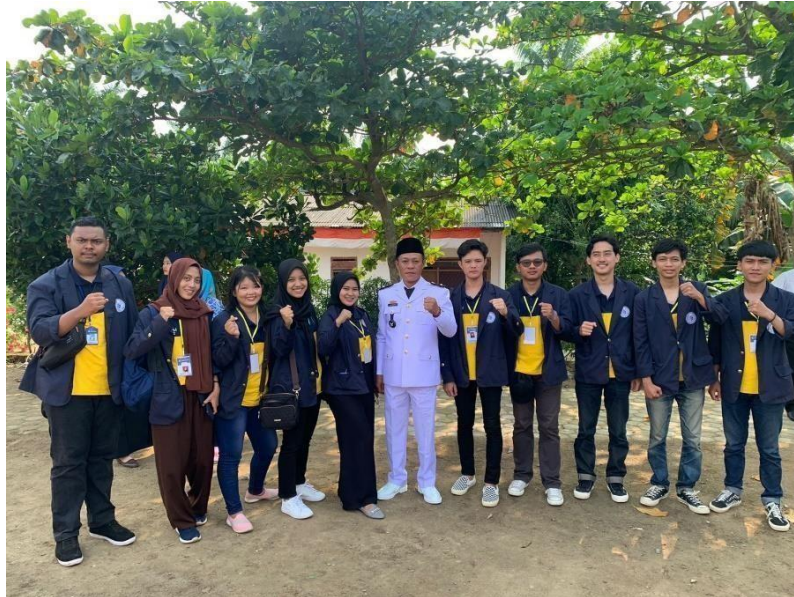
Gambar 2.11 Dokumentasi bersama kepala desa Karang Raja setelah upacara bendera