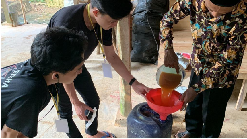
Gambar 2.15 Dokumentasi proses pembuatan pupuk organik cair

Di desa Karang Raja tepatnya di dusun Talang Mainal terdapat warga yang membuat pupuk organik cair yang terbuat dari limbah rumah tangga.