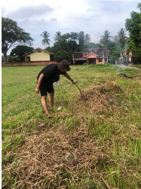
Gambar 2.20 Gotong Royong Bersama Warga

Mengikuti kegiatan gotong royong bersama warga Sinar Ogan dalam rangka membersihkan lapangan tempat akan dilaksanakan lomba 17 Agustus. Kegiatannya meliputi membersihkan lapangan, pengecatan bambu disekitar lapangan dan pendirian tenda serta pinang.