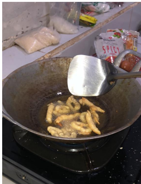
Gambar 2.5 Menggoreng Stik Tahu

Pembuatan stik tahu Pak Gampang. Bahan yang diperlukan ialah tahu putih, penyedap rasa, tepung terigu dan minyak goreng. Setelah tahu dihaluskan dan dicampur dengan tepung serta penyedap lalu tahu dicetak dan digoreng.