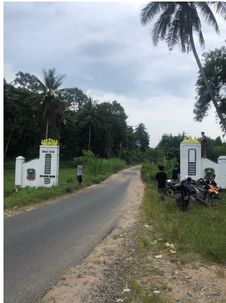
Gambar 2.26 Pengecatan Gapura Desa

Melakukan kegiatan pengecatan gapura desa sebagai kenang-kenangan dari mahasiswa IIB Darmajaya kepada desa Sinar Ogan. Kegiatan ini dilakukan oleh kelompok 7 dan kelompok 8.