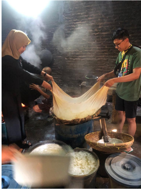
Gambar 2.1 Proses Pembuatan Tahu

Gambar diatas merupakan proses penyaringan sari tahu. Langkah awal membuat tahu ialah merendam kedelai yang kemudian digiling di mesin penggilingan. Setelah digiling kedelai dimasak sampai mendidih. Langkah berikutnya adalah penyaringan untuk mendapatkan sari pati kedelai. Setelah disaring maka dilakukan penggumpalan menggunakan cuka alami hasil dari penyaringan. Langkah terakhir tahu dicetak dan dipotong-potong.