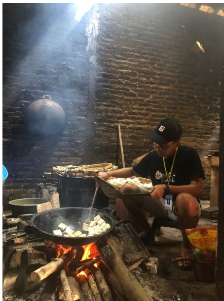
Gambar 2.2 Proses Penggorengan Tahu

Gambar diatas merupakan proses penyaringan sari tahu. Langkah awal membuat tahu ialah merendam kedelai yang kemudian digiling di mesin penggilingan. Setelah digiling kedelai dimasak sampai mendidih. Langkah berikutnya adalah penyaringan untuk mendapatkan sari pati kedelai. Setelah disaring maka dilakukan penggumpalan menggunakan cuka alami hasil dari penyaringan. Langkah terakhir tahu dicetak dan dipotong-potong.