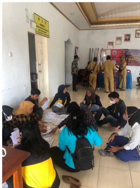
Gambar 2.25 Pendataan Warga Penerima Bantuan

Merapikan data warga yang menerima BLT-DD serta turut membantu kegiatan pada saat pembagian BLT dengan melengkapi berkas administrasi warga jika kurang.