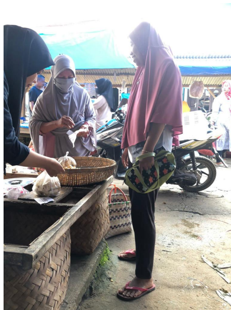
Gambar 2.3 Penjualan Tahu di Pasar

Penggorengan tahu dilakukan untuk mendapatkan kepadatan tahu. Penggorengan hanya menggunakan minyak yang sedikit, dalam penggorengan 920 buah tahu hanya menggunakan 1,5 liter minyak. Setelah digoreng tahu akan didiamkan dan direndam pada air panas selama semalam berfungsi untuk pemadatan tahu sebelum dijual ke pasar.