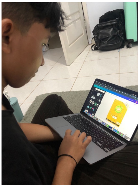
Gambar 2.8 Pembuatan Desain Kemasan

Gampang. Desain banner memanfaatkan aplikasi canva, aplikasi ini dipilih karena memudahkan pengguna dalam pencarian asset untuk kebutuhan desain.