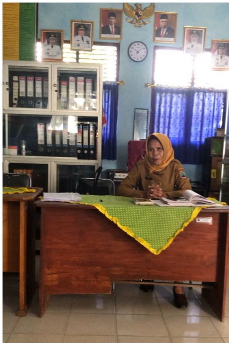
Gambar 2.11 Berdiskusi Masalah Administrasi Sekolah

Berdiskusi masalah yang dihadapi sekolah dalam mengurus administrasi sekolah bersama ibu kepala sekolah langsung. Tidak ada masalah serius yang dihadapi SDN 1 Sinar Ogan karena data sudah di onlinekan oleh disdikbud Lampung Selatan.