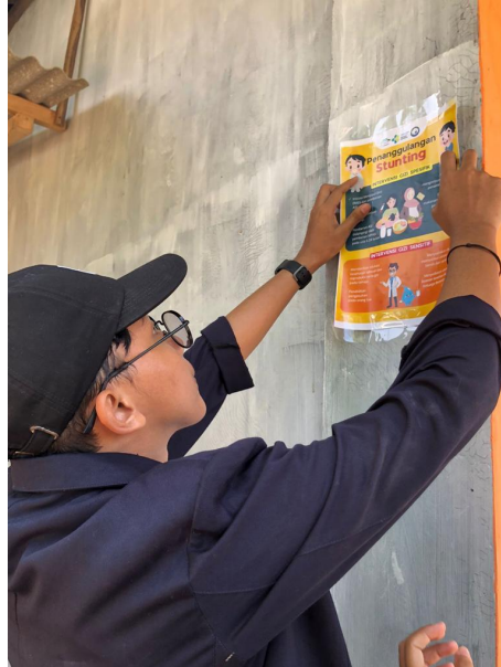
Gambar 2.19 Pemasangan Poster Stunting

Turut serta membantu kegiatan posyandu balita serta turut mensosialisasikan stunting pada anak dan cara menanggulangnya.