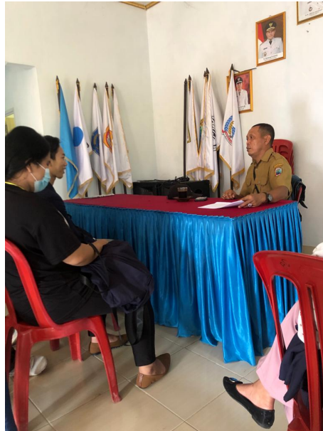
Gambar 2.17 Meminta Izin Kades untuk Melakukan Giat di Desa

Pada kegiatan ini kami turut membantu kegiatan desa mulai dari persiapan lomba 17 Agustus, menjadi bagian dari panitia 17 Agustus, mengikuti musyawarah desa, turut membantu posyandu dan posbindu, mengikuti kegiatan pembagian BLT-DD hingga pengecatan gapura sebagai kenang-kenangan.