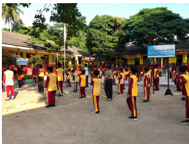
Gambar 2.14 Senam Jum'at

Membantu SDN 1 Sinar Ogan dalam kegiatan memeriahkan lomba 17 Agustus. Lomba yang diadakan hanya lomba sederhana seperti memasukkan pensil kedalam botol, lomba balap kelereng, lomba balap karung, dan lomba estafet karet.