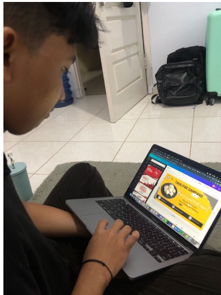
Gambar 2.7 Pembuatan Desain Banner

Pembuatan stik tahu Pak Gampang yang dilakukan oleh mahasiswa. Pembuatan stik tahu dilakukan agar Pak Gampang mendapatkan keuntungan maksimal.