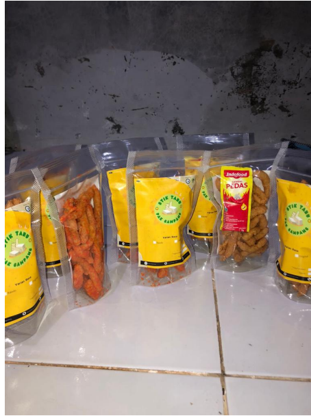
Gambar 2.6 Hasil Produk Stik Tahu

Pembuatan stik tahu Pak Gampang yang dilakukan oleh mahasiswa. Pembuatan stik tahu dilakukan agar Pak Gampang mendapatkan keuntungan maksimal.