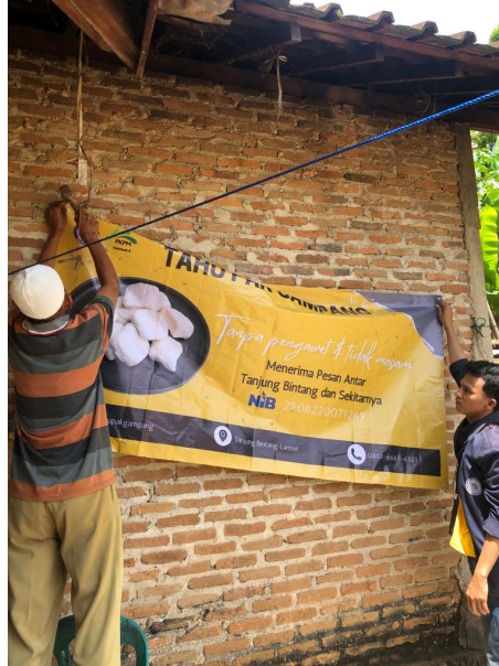
Gambar 2.10 Pemasangan Banner di Lokasi Usaha