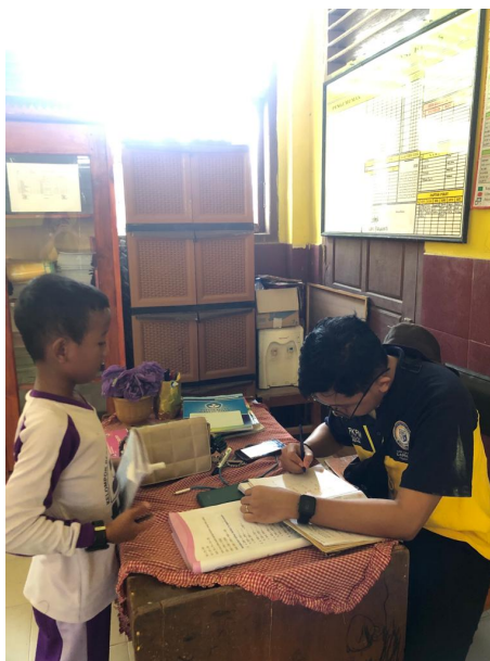
Gambar 2.12 Kegiatan Mengajar Siswa

Berdiskusi masalah yang dihadapi sekolah dalam mengurus administrasi sekolah bersama ibu kepala sekolah langsung. Tidak ada masalah serius yang dihadapi SDN 1 Sinar Ogan karena data sudah di onlinekan oleh disdikbud Lampung Selatan.