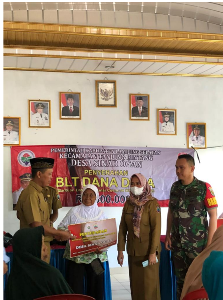
Gambar 2.24 Pembagian BLT-DD