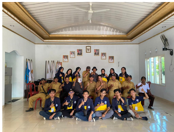
Gambar 2.27 Penyerahan Plakat ke Balai Desa

Melakukan kegiatan pengecatan gapura desa sebagai kenang-kenangan dari mahasiswa IIB Darmajaya kepada desa Sinar Ogan. Kegiatan ini dilakukan oleh kelompok 7 dan kelompok 8.