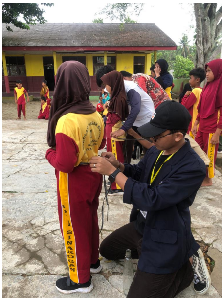
Gambar 2.13 Membantu Kegiatan 17 Agustus

Pada kesempatan kali ini saya membantu kegiatan mengajar di kelas 3. Mengajarkan siswa numerasi belajar perkalian dan penambahan. Pada gambar diatas saya memberikan nilai kepada siswa yang telah selesai mengerjakan latihan.