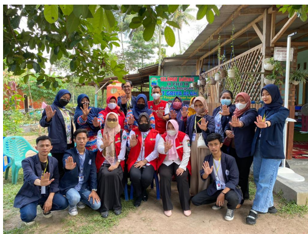
Gambar 2.18 Mengikuti Posyandu dan Sosialisasi Stunting

Meminta izin ke kepala desa untuk melakukan kegiatan di desa Sinar Ogan. Kegiatan ini sekaligus rangkaian awal kegiatan kami pada PKPM Darmajaya periode 8 Agustus - 8 September 2022.