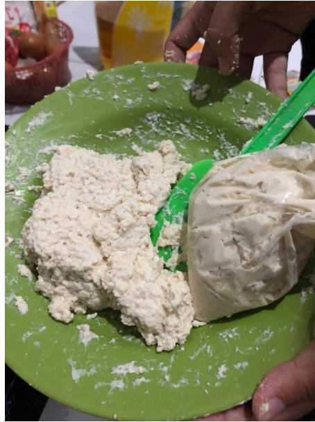
Gambar 2.4 Bahan Membuat Stik Tahu