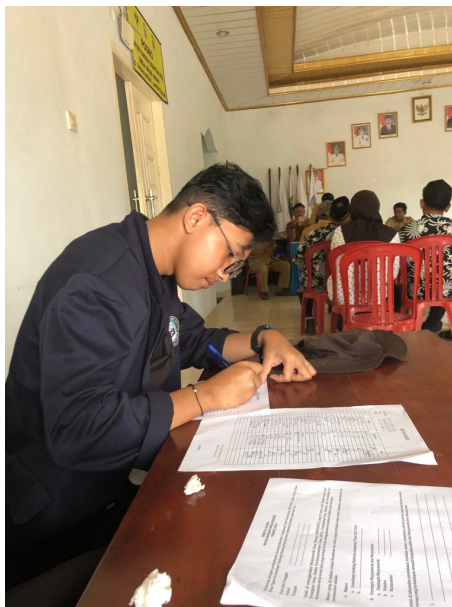
Gambar 2.21 Pengisian Absensi Musyawarah Desa

Mengikuti kegiatan gotong royong bersama warga Sinar Ogan dalam rangka membersihkan lapangan tempat akan dilaksanakan lomba 17 Agustus. Kegiatannya meliputi membersihkan lapangan, pengecatan bambu disekitar lapangan dan pendirian tenda serta pinang.