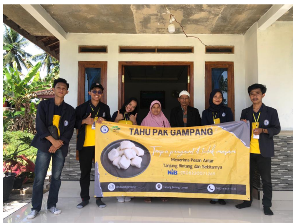
Gambar 2.9 Penyerahan Plakat dan Banner

Pembuatan desain kemasan stik tahu yang merupakan produk turunan dari tahu putih. Produk stik tahu merupakan inovasi dari mahasiswa PKPM IIB Darmajaya dengan harapan Pak Gampang dapat meneruskan produk tersebut. Didalam desain kemasan terdapat varian rasa, logo stik tahu, tanggal produksi, tanggal kadaluarsa, alamat pembuatan, media sosial, nomor hp dan nomor izin berusaha.