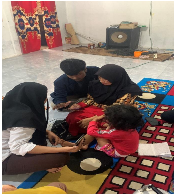
Mendampingi Warga Dalam Hal Menjual Produk Di Marketplace