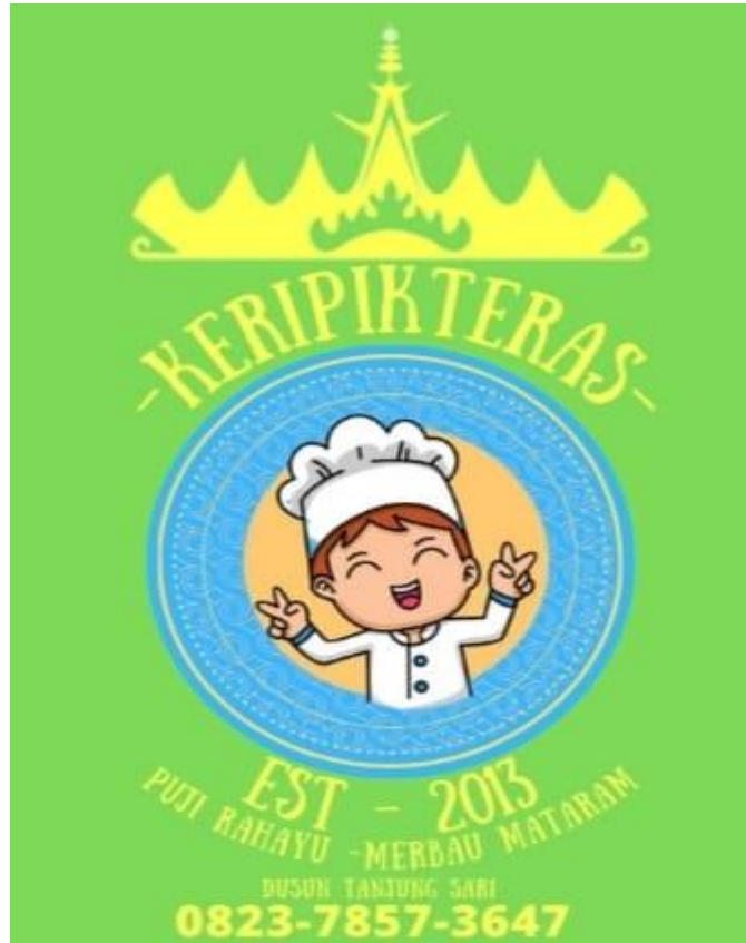
Logo Keripik Teras