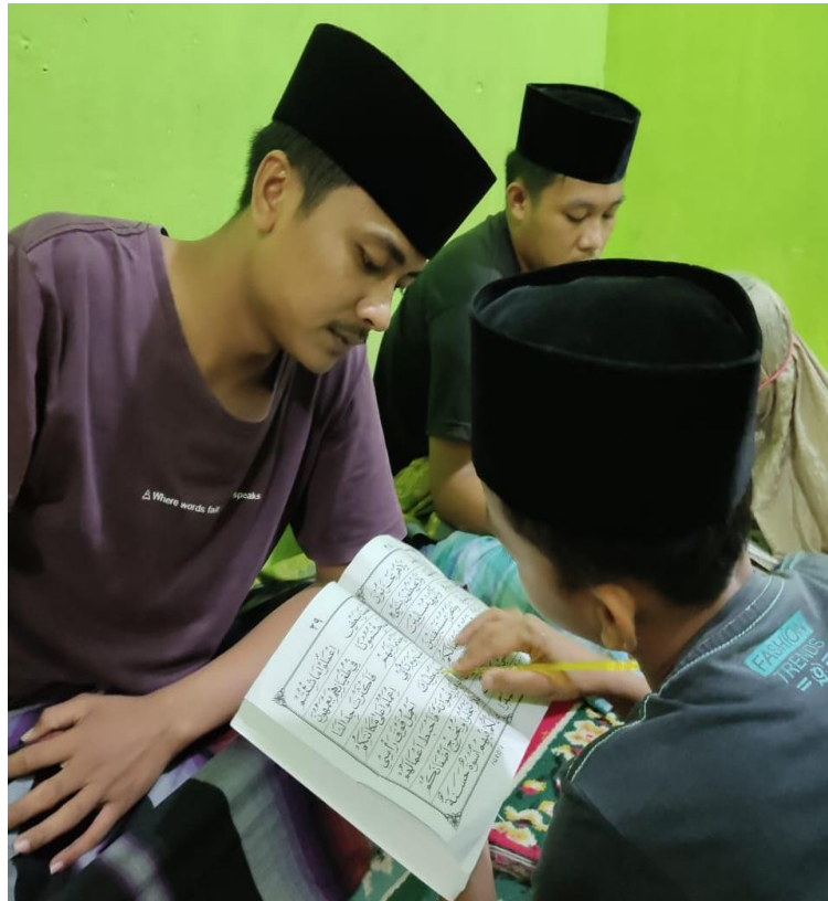
Pendampingan Mengaji Di TPA Puji Rahayu