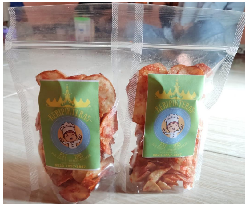
Cetak Logo Dalam Kemasan Keripik Teras