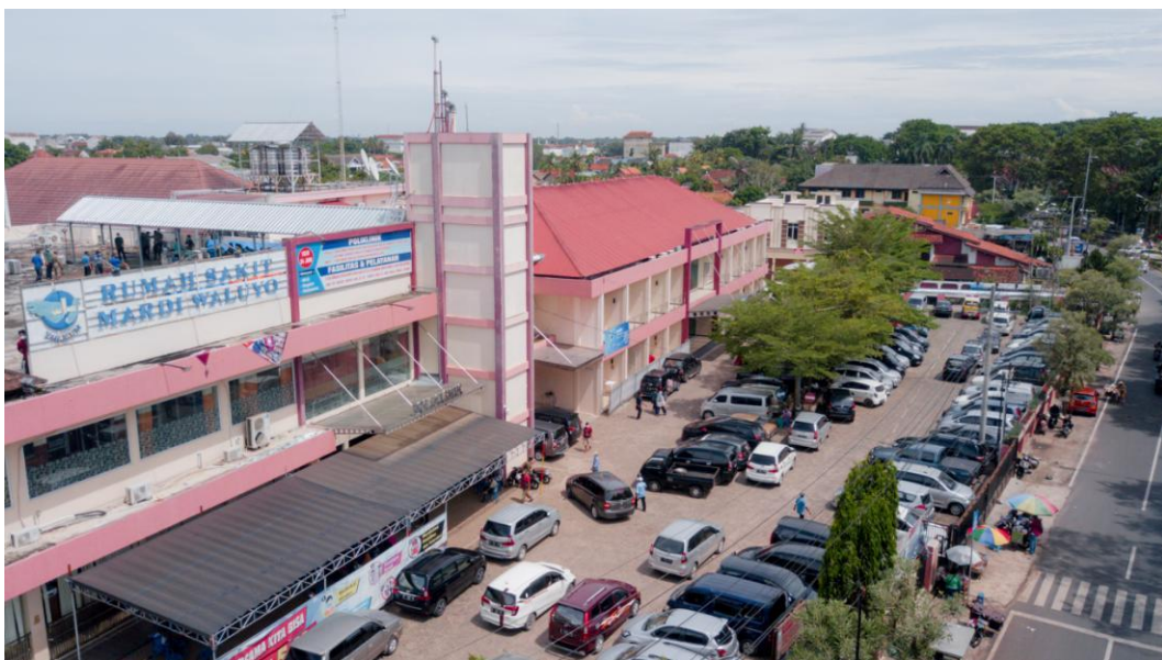
Gambar 2.4 Gedung Rumah Sakit Mardi Waluyo Metro, Lampung