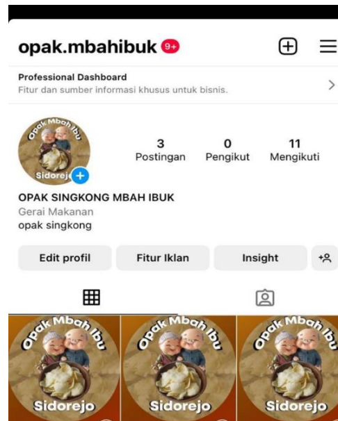
Gambar 2.5 akun sosial media ig opak mbah ibu