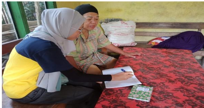
Gambar 2.6 Pelatihan pencatatan keuangan

Melihat permasalahan yang dialami pemilik UMKM Opak Mbah Ibu. Penulis memberikan pelatihan pencatatan akuntansi sederhana dan membuatkan akun aplikasi stroberi dan memberikan pelatihan cara menggunakan aplikasi stroberi, aplikasi stroberi memberikan kemudahan dalam pencatatan laporan transaksi, pengeluaran, pemasukan dll, menjadi lebih praktis dan efisien tanpa perlu kertas ataupun alat tulis. Hasil laporan yang tercatat juga dapat di download sesuai periode waktu yang ditentukan.