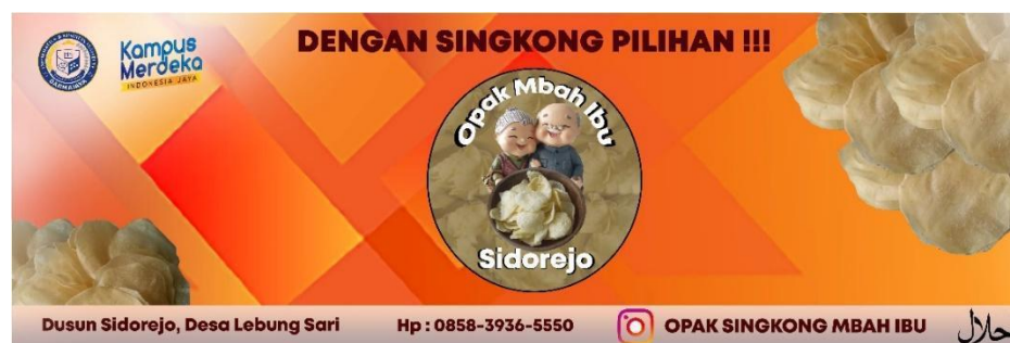
Gambar 2.4 Banner opak mbah ibu