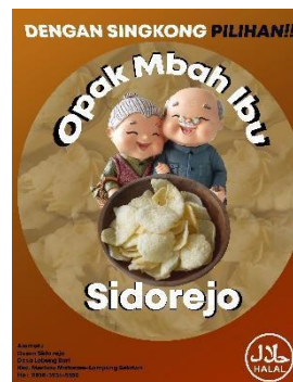
Gambar 2.3 Logo kemasan opak mbah ibu

logo untuk perusahaan sendiri, tentunya akan dapat meningkatkan daya tarik terhadap masyarakat. Serta mendesain banner yang dipasang di depan rumah ibu priyogi pemilik UMKM opak mbah ibu ditujukan untuk menjadi penanda lokasi produksi.