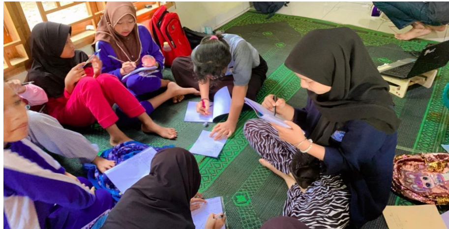
Gambar 2.9 Bimbingan belajar anak-anak SD

sebagai wujud kepedulian terhadap pendidikan anak-anak di desa lebung sari, bimbingan belajar ini berlangsung sekitar 1 jam 30 menit mengingat anak-anak yang masih harus mengaji di sore hari, kegiatan bimbel bertempat di posko PKPM.