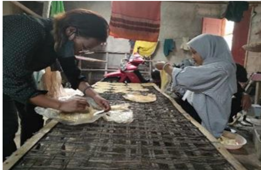
Gambar 2.2 Membantu produksi opak mbah ibu

beraturan, hal ini menyebabkan pelaku UMKM tidak mengetahui kegiatan produksinya mengalami laba atau rugi.