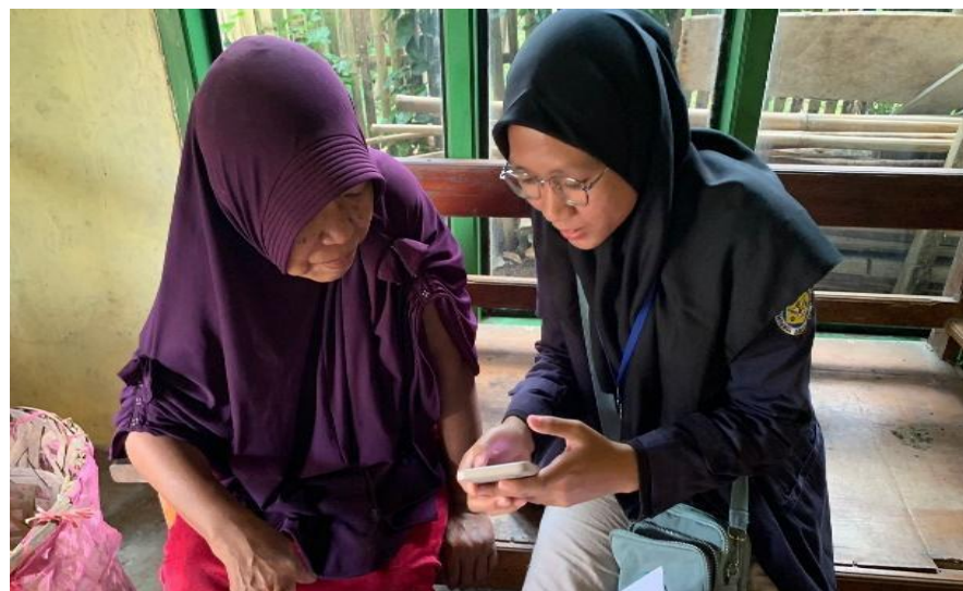
Gambar 2.8 Pelatihan aplikasi stroberi