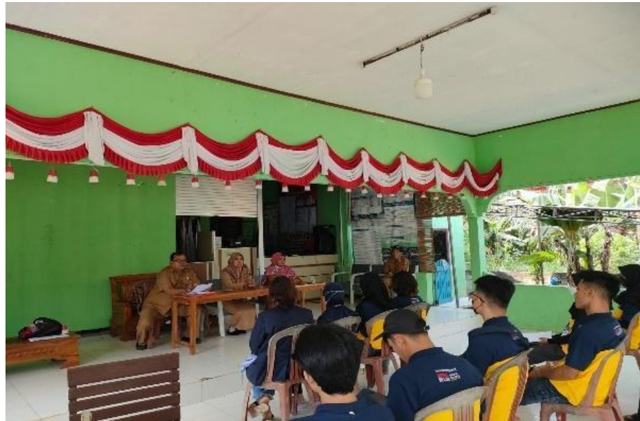
Gambar 2.1 Kunjungan dan silaturahmi

permasalahan-permasalahan yang dialami oleh pihak UMKM. UMKM yang kami kunjungi diantaranya Opak Mbah Ibu, dan Klanting Kuping Gajah.