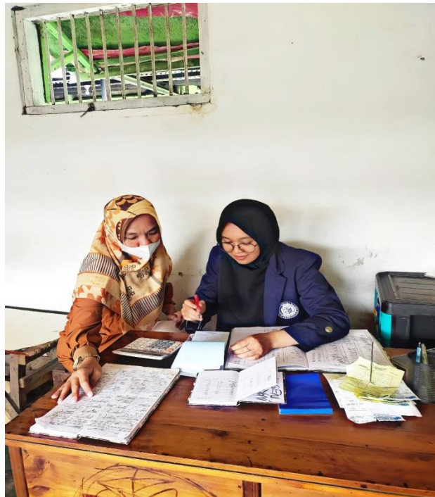
Lampiran 3. Penjelasan mekanisme kerja kepada Dosen Pembimbing Lapangan