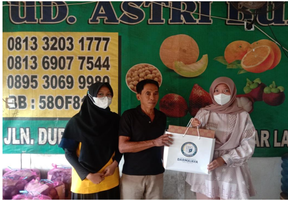
Lampiran 7. Penjemputan Mahasiswa Kerja Praktek oleh Dosen Pembimbing