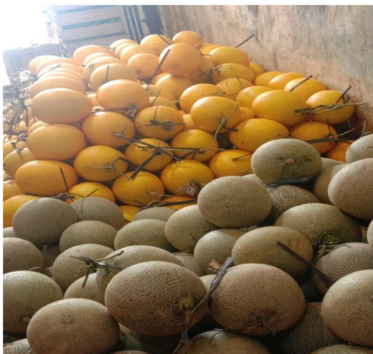
Lampiran 5. Salah satu Buah- buahan yang di jual di UD. Astri Buah yaitu Buah Melon