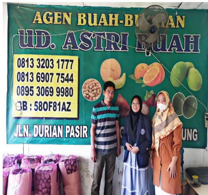
Lampiran 2. Pengantaran Mahasiswa kerja praktek oleh Dosen Pembimbing