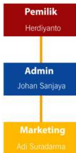
Gambar 2.2 Struktur Organisasi CV.Cahaya Anugrah Plastik