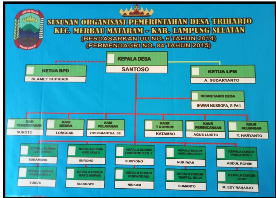
Gambar 1.2 Struktur Organisasi Pemerintahan Desa Triharjo

Nama-nama dusun yang menjadi bagian Desa Triharjo diantaranya yaitu, Hargomulyo I, Hargomulyo II, Girijoyo I, Girijoyo II, Tempel Rejo, Panglong I, Panglong II, Batu Ampar, Purwodadi, dan Staf.