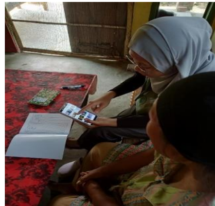
Gambar 2.6 Akun aplikasi stroberi dan mengajarkan penggunaanya