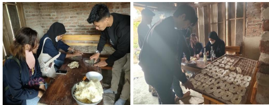
Gambar 2.2 Membantu produksi opak mbah ibu

Dalam rangkaian kegiatan tersebut membantu aktivitas produksi sehari-hari para pemilik UMKM. Selama berkegiatan dengan terjun secara langsung dalam aktivitas produksi usaha Opak Mbah Ibu. Sehingga tak hanya pelaku UMKM saja yang dapat merasakan impact baik dari kegiatan ini namun juga dirasakan oleh mahasiswa PKPM