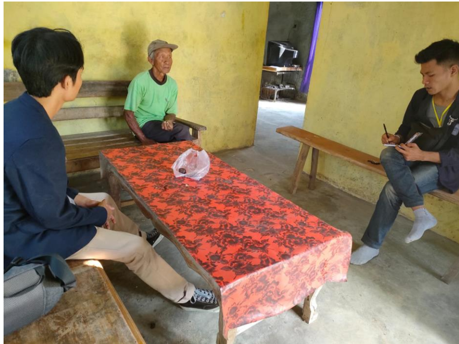
Gambar 2.1 Kunjungan dan silaturahmi