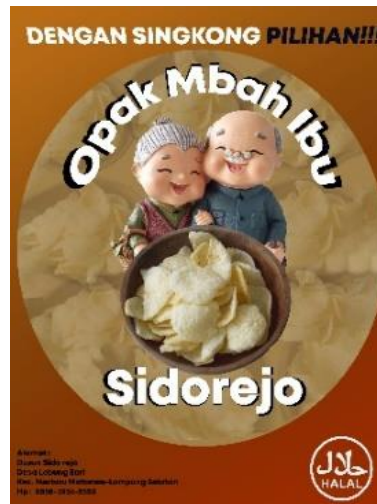
Gambar 2.4 Desain logo kemasan Opak mbah ibu

perusahaan yang tentunya akan dapat meningkatkan daya tarik terhadap masyarakat. Adapun desain Logo Opak Mbah Ibu dapat dilihat pada gambar berikut :