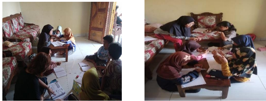
Gambar 2.7 Bimbingan belajar anak anak SD