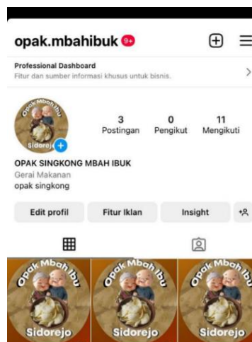
Gambar 2.5 akun sosial media Instagram opak mbah ibu

Pembuatan akun sosial media ditujukan agar kegiatan usaha UMKM Opak Mbah Ibu memiliki target pasar yang lebih luas.