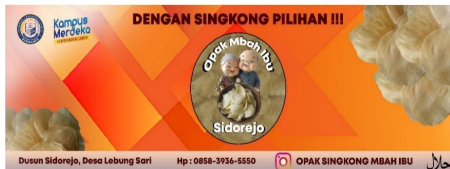
Gambar 2.3 banner Opak Mbah ibu

Banner adalah suatu media informasi non personal yang berisi pesan promosi, Tujuan dari pembuatan banner ini dilakukan adalah untuk memperkenalkan pada banyak khalayak dan mempermudah pembeli dalam mencari alamat pembuatan Opak Mbah Ibu. Desain banner Opak Mbah Ibu dapat dilihat pada gambar berikut: