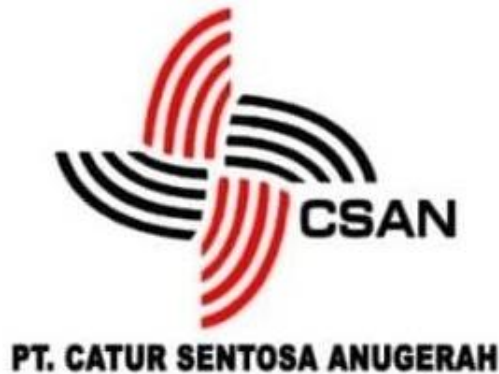
Gambar 2. Logo PT Catur Sentosa Anugerah Lampung