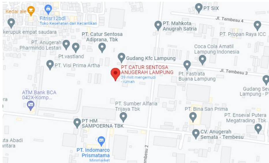
Gambar 3. Peta Lokasi PT Catur Sentosa Anugerah Lampung

Alamat : Jl. Tembesu 2 Blok 8A No. 32 Kel. Campang Raya Kec. Tanjung Karang Timur Kota Bandar Lampung, Kode Pos 35244