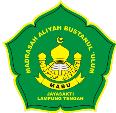
Gambar 2. 1 Logo MA Bustanul Ulum Jayasakti

Madrasah Aliyah Bustanul 'Ulum Jayasakti Anak Tuha Lampung Tengah merupakan salah satu madrasah yang berada di bawah naungan yayasan yang berlatar belakang pesantren yaitu Yayasan Pendidikan Pesantren Pembangunan Bustanul 'Ulum (YPPPB). Sekitar tahun 1980, YPPPB merencanakan untuk pendirian lembaga baru yang jenjangnya lebih tinggi, yaitu jenjang sekolah menengah atas. Perencanaan tersebut pada akhirnya dengan semangat perjuangan dan keikhlasan dalam dunia pendidikan, berdirilah sekolah menengah atas yang bercirikan agama islam ini pada tahun 1983 yang diberi nama Madrasah Aliyah Bustanul 'Ulum. Pemberian nama tersebut karena dari nama yayasan yaitu Bustanul 'Ulum yang memiliki arti dalam bahasa Indonesia Kebun Keilmuan.