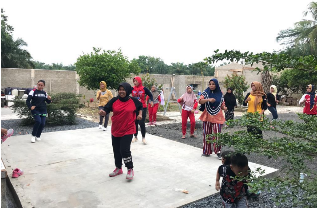
Gambar 2.3 Kegiatan senam rutin Ibu-ibu.