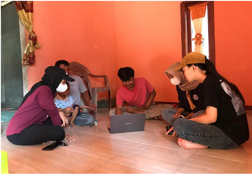
Gambar 1.3 Proses Edukasi dalam penjualan bidang pemasaran online UMKM