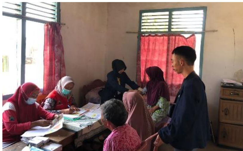
Membantu petugas puskesmas dalam kegiatan posyandu lansia