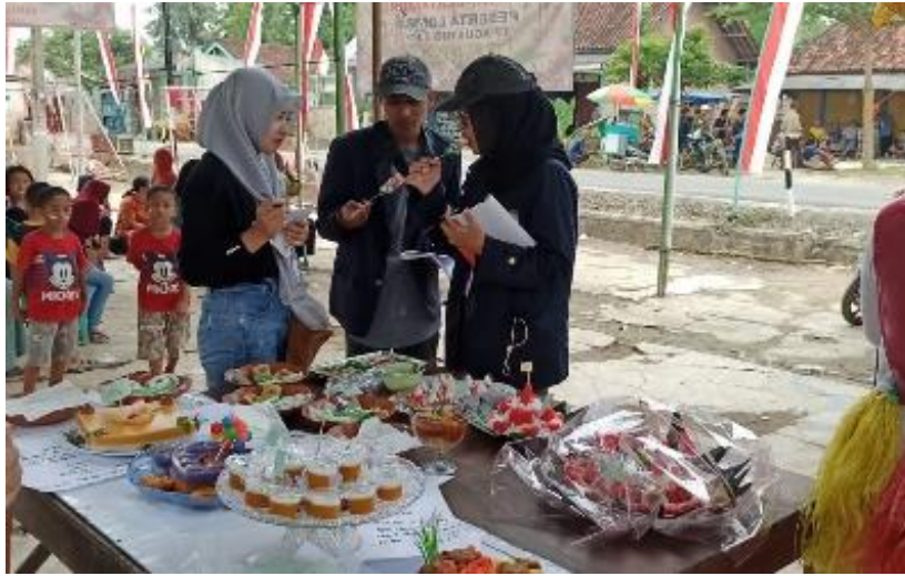
Menjadi juri lomba kreasi makanan