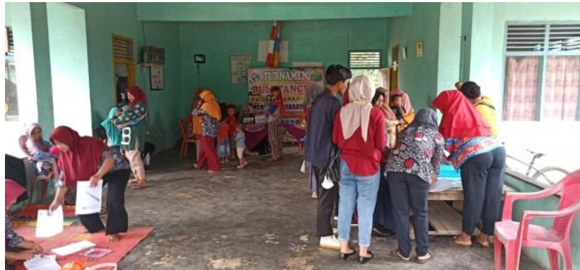
Mengikuti program pencegahan stunting rutin setiap bulan