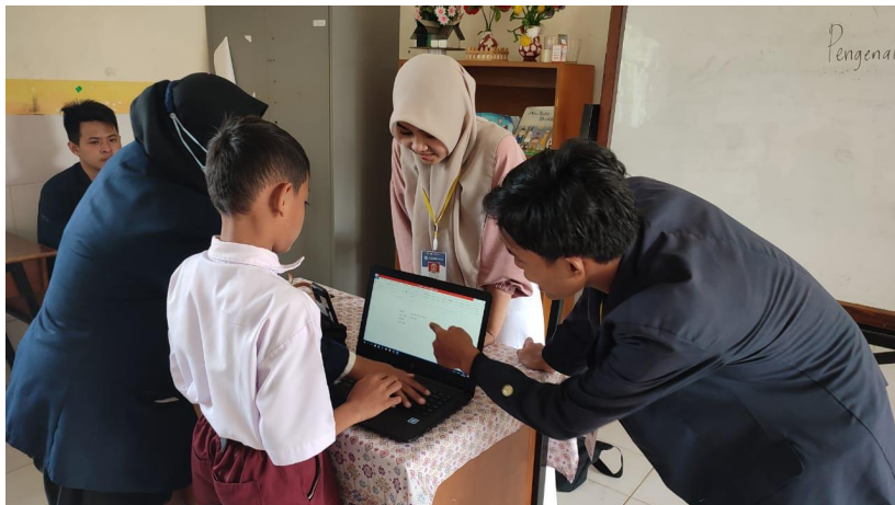
Sosialisasi pengenalan Microsoft word