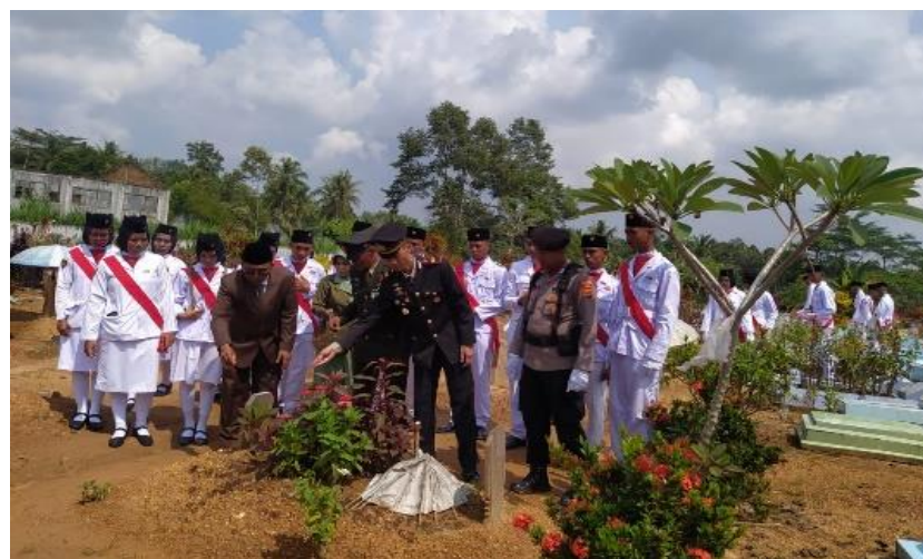
Ziarah ke makam Pahlawan