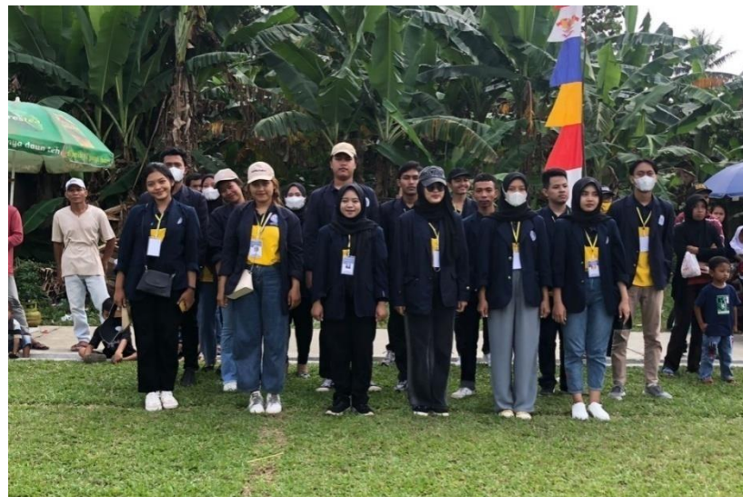
Mengikuti kegiatan upacara 17 Agustus