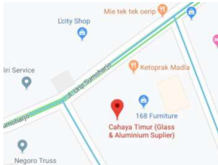
Gambar.2.1. Denah Lokasi PT Cahaya Timur Urip