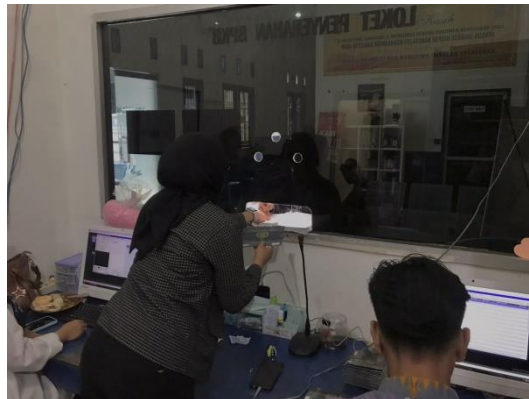
Gambar 1.6 Penyerahan BPKB Kepada Wajib Pajak