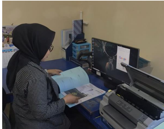
Gambar 1.5 Pencocokan Data Kepemilikan