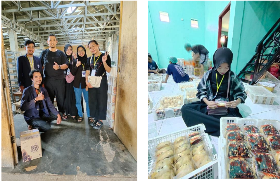
Gambar 2.4 Kunjungan dan Membantu Proses Kegiatan UMKM