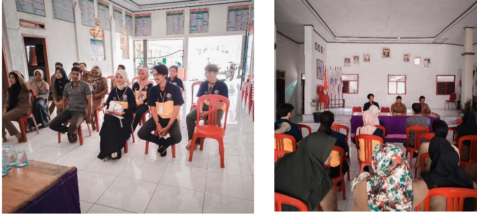
Gambar 2.1 Pengenalan Perangkat Desa dan Penjabaran Progja

Berikut merupakan kegiatan dalam membantu tugas-tugas perangkat di desa Mulyo Sari, sebagai berikut :