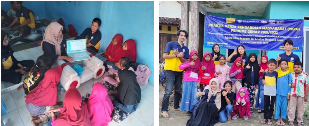
Gambar 2.3 Bimbingan Belajar Mengenal Teknologi (Laptop)

Microsoft Word (belajar mengetik) dan mengenal aplikasi Paint (belajar menggambar).