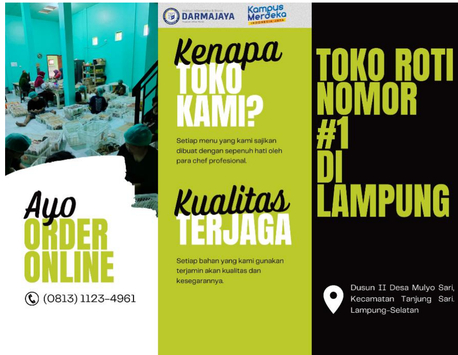
Gambar 2.6 Brosur UMKM Wahyu Bakery (Tampak Belakang)