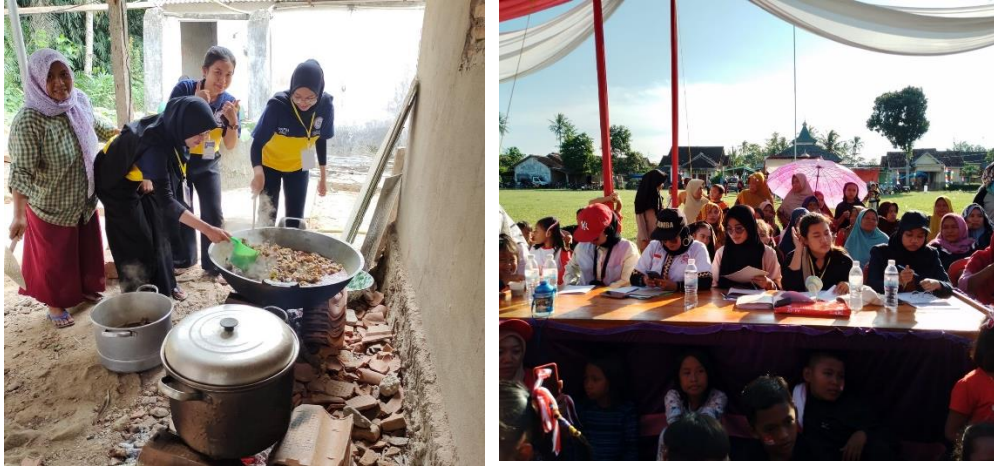
Gambar 2.7 Membantu Kegiatan Rutin Desa Mulyo Sari

sekali, maka perlu dilakukan dengan tujuan meningkatkan rasa nasionalisme pada diri masyarakat desa Mulyo Sari dan mengingat perjuangan para pahlawan yang telah berjuang untuk Indonesia merdeka. Bukan hanya kegiatan rutin dari aparat desa saja dan karang taruna melainkan kegiatan senam bersama ibu-ibu PKK, guna untuk memberikan kebugaran dan kesehatan jasmani pada diri.