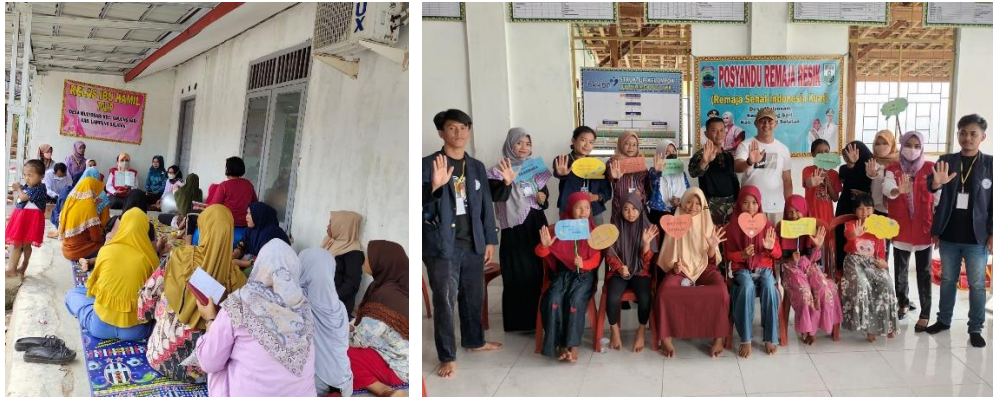
Gambar 2.8 Penyuluhan Stop Stunting di Desa Mulyo Sari