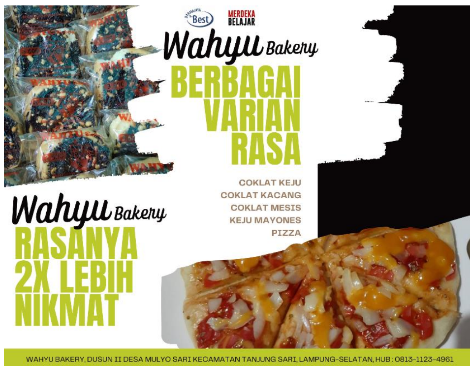
Gambar 2.5 Brosur UMKM Wahyu Bakery (Tampak Depan)

sehingga dapat menjangkau masyarakat lebih luas lagi terlebih bila dapat melayani pembelian secara daring untuk memudahkan konsumen memperoleh produk tanpa harus keluar rumah. Pelayanan semacam itu merupakan hal yang sangat dibutuhkan konsumen mengingat masih terbawa suasana di tengah pandemic malas untuk keluar rumah. Strategi ini dinilai sangat tepat untuk membantu memulihkan pendapatan masyarakat dan daya beli, sehingga dapat membantu menjaga stabilitas ekonomi masyarakat.