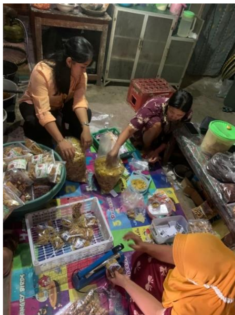
Gambar 11 proses pengemasan

Proses akhir, setelah produk digoreng lalu ditiriskan dan ditunggu sampai produk molen mini sale pisang dingin. Tahap selanjutnya dilakukan pengemasan produk. Di UMKM Mbah Ini terdapat beberapa ukuran kemasan produk seperti kemasan berukuran kecil yang nantinya akan dipasarkan di sekolah - sekolah, dan ukuran gramasi 150gr dipasarkan di warung atau outlet – outlet.