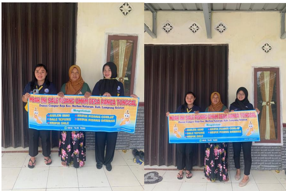
Gambar 14 memberikan hasil desain

Setelah terlaksananya program kerja mahasiswa PKM memberikan banner kepada UMKM sebagai bentuk ucapan terimakasih kepada pemilik UMKM yang telah membantu dan mendukung mahasiswa melakukan program kerja yang telah terlaksana dengan baik.