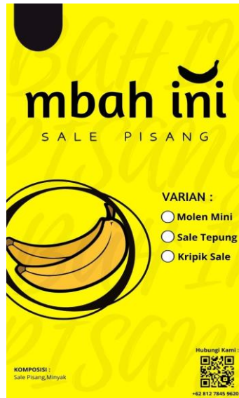
Gambar 3 membuat desain kemasan

Setelah survei tempat UMKM, mahasiswa PKPM telah berbincang bincang dengan pemilik UMKM membahas dan mendiskusikan tentang kelemahan kemasan yang digunakan oleh pemilik UMKM. Dengan ini Mahasiswa PKPM melakukan pembuatan desain kemasan yang terbaru untuk memodifikasi kemasan produk yang lama.