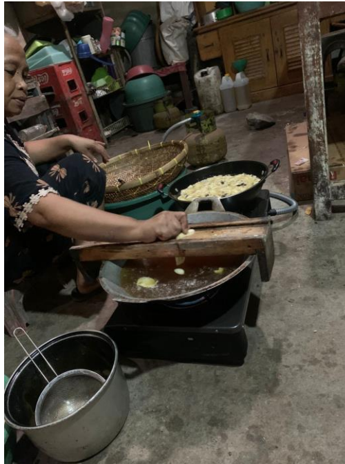
Gambar 2 kunjungan umkm

Sebelum melaksanakan program kerja PKPM di UMKM Sale Pisang mahasiswa PKPM melakukan kunjungan terlebih dahulu guna mengetahui apa saja kegiatan yang di lakukan sehari-hari di UMKM Sale Pisang dan juga sedikit berbincang dengan pemilik UMKM tersebut mengenai tahapan proses pembuatan produk Sale Pisang yang benar