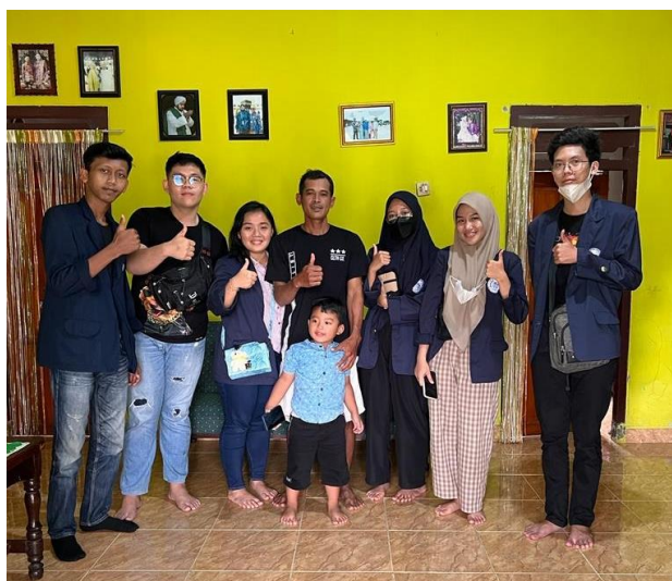
Gambar 1 rumah kadus