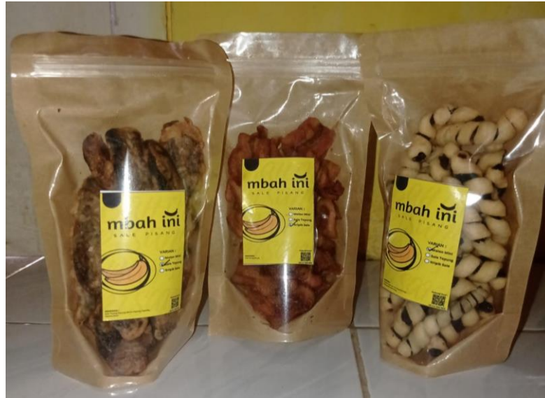
Gambar 5 kemasan baru

Berikut adalah tampilan produk dengan kemasan yang telah diperbarui atau dimodifikasi oleh mahasiswa PKPM hasil diskusi dengan pemilik UMKM yang akan dipasarkan atau dipromosikan di mini market (SRC).