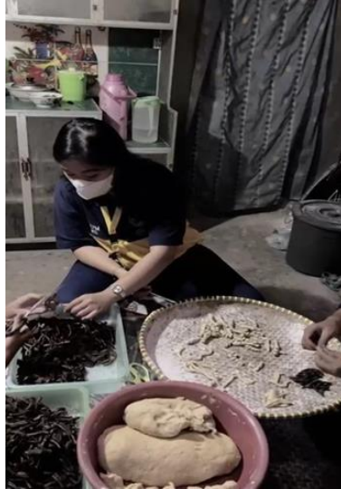
Gambar 9 proses pembentukan molen

Setelah proses pemotongan kulit molen mini selanjutnya adalah tahap pembentukan molen mini sale pisang dengan cara melitikan kulit adonan tepung ke sale pisang yang telah di gunting.