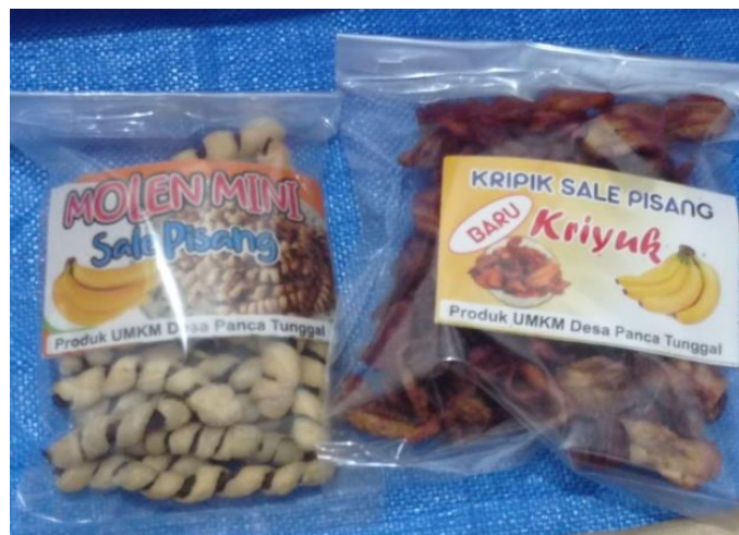
Gambar 4 kemasan lama

Setelah survei tempat UMKM, mahasiswa PKPM telah berbincang bincang dengan pemilik UMKM membahas dan mendiskusikan tentang kelemahan kemasan yang digunakan oleh pemilik UMKM. Dengan ini Mahasiswa PKPM melakukan pembuatan desain kemasan yang terbaru untuk memodifikasi kemasan produk yang lama.