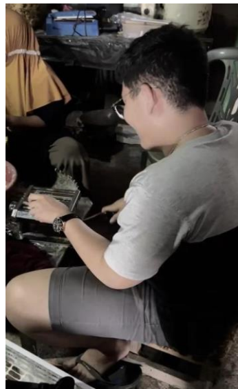
Gambar 8 proses penggilingan adonan

Proses selanjutnya adalah pembuatan adonan kulit molen mini yang berbahan dasar campuran tepung terigu, gula, telur, ragi, mentega, vanili, dan garam.