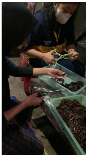
Gambar 6 proses pemotongan sale pisang