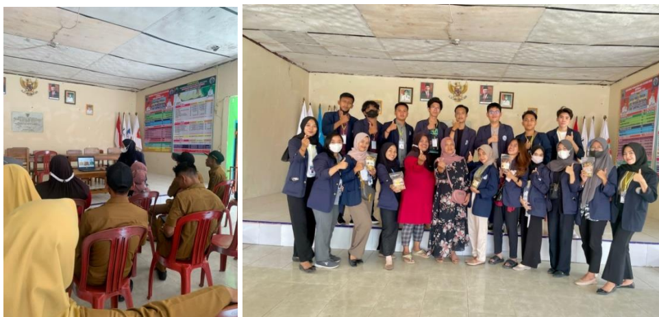
Gambar 12 pelatihan UMKM