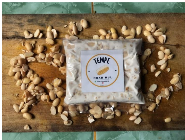
Gambar 2. 4 Foto Produk Tempe Mbah Mul

Setelah salah satu anggota kami membuat logo dan mencetaknya menjadi stiker, Langkah saelanjutnya yang saya lakukan adalah melakukan sesi foto produk yang kemudian foto tersebut akan di unggah ke akun sosial media UMKM. Agar produk Tempe Mbah Mul dapat menarik minat konsumen.