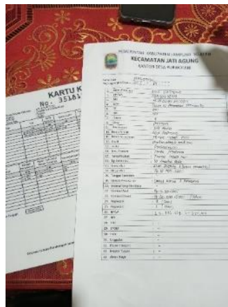
Gambar 2. 10 Pendataan Kegiatan Usaha

Pada pagi hari tanggal 28 Agustus, kami melakukan pendataan seluruh pelaku usaha yang ada di desa Purwotani.