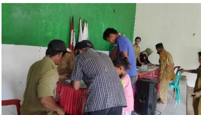
Gambar 2. 11 Pembagian BLT di Aula Desa