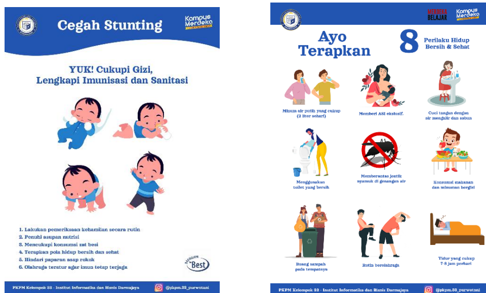
Gambar 2. 6 Desain Spanduk Stunting dan PHBS