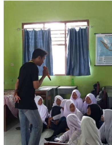
Gambar 2. 9 Kegiatan Belajar Mengajar di SMP Purwotani