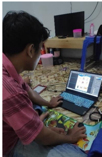
Gambar 2. 5 Pembuatan Spanduk Stunting dan PHBS

Stunting adalah masalah tumbuh kembang anak yang ditandai dengan tinggi badan anak yang rendah, sedangkan PHBS merupakan kependekan dari Perilaku Hidup Bersih dan Sehat. PHBS adalah semua perilaku kesehatan yang dilakukan karena kesadaran pribadi. Maka dari itu kami membuat spanduk tentang stunting dan PHBS ini agar menjadi pembelajaran kepada masyarakat Purwotani bahwa pembelajaran mengenai stunting dan PHBS itu penting.