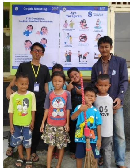
Gambar 2. 7 Pemasangan Spanduk dan Sosialisasi