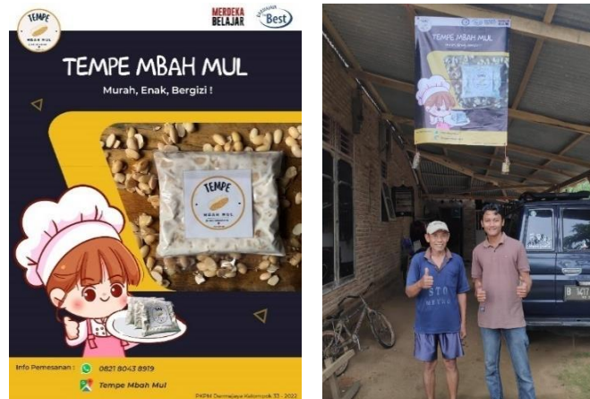
Gambar 2. 3 Desain dan pemasangan spanduk Tempe Mbah Mul

Pada hari sabtu, 3 September 2022, saya berkunjung ke UMKM Tempe Mbah Mul untuk memberikan spanduk usaha dan meminta izin untuk memasang spanduk usaha ditempatnya. Dengan dipasangnya spanduk usaha, diharapkan dapat memperluas pemasaran.