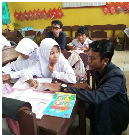
Gambar 2. 8 Kegiatan Belajar Mengajar di SD Purwotani

Pada hari selasa-kamis (23-25 Agustus) pukul 09.00 s.d 12.00 WIB. Kami melakukan pengajaran di SD Purwotani mengenai pentingnya menabung, berhitung dan belajar bahasa inggris. Untuk siswa/i SMP saya mengajarkan mengenai dasar-dasar ilmu komputer dan belajar cara mengoperasikan Microsoft Word.