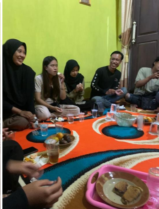
Silaturahmi dengan beberapa Kadus desa Panca Tunggal.