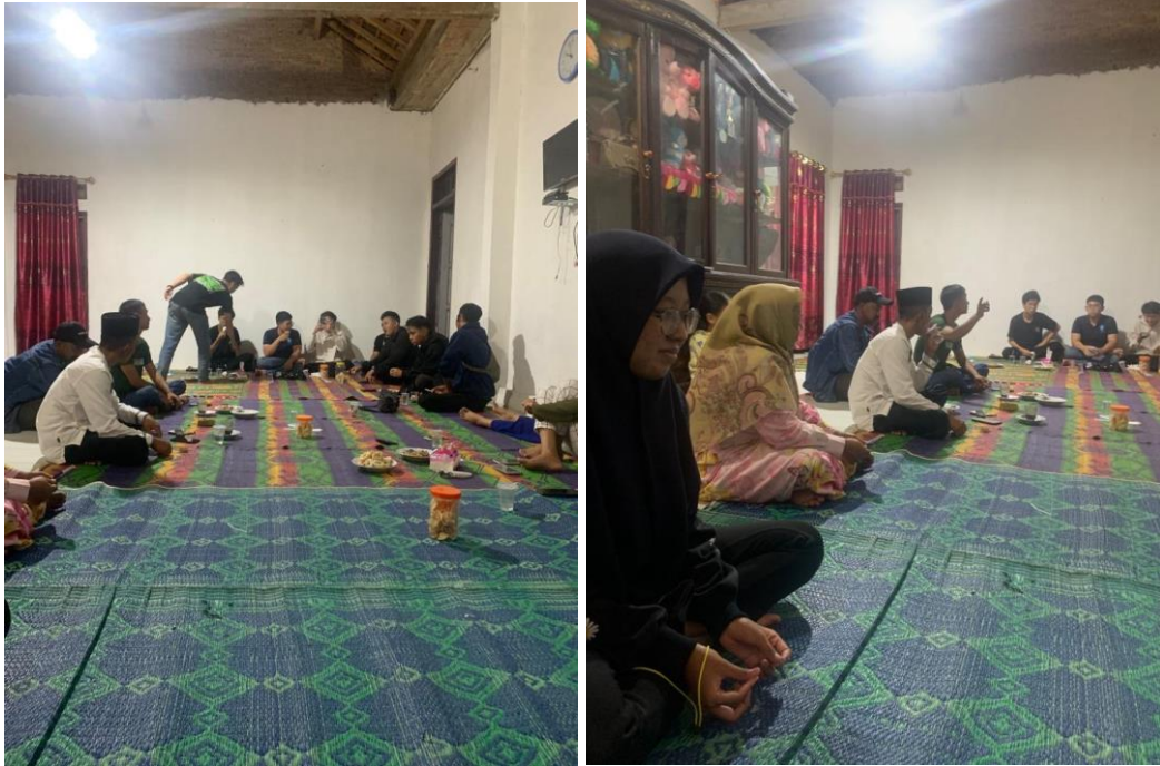
Mahasiswa PKPM Darmajaya bersilaturahmi ke rumah Bapak Kades Panca Tunggal