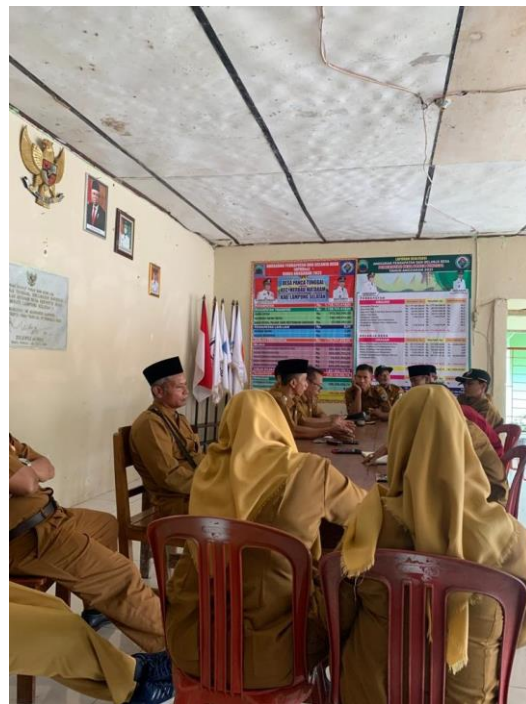
Rapat mengenai SDSG bersama Pemdes.