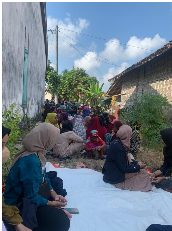
Silaturahmi sekaligus takziah di Dusun Margasari bersama pemdes