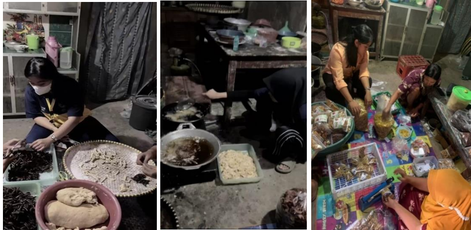
Membantu proses pembuatan Molen mini sale pisang di UMKM Sale Pisang di Dusun Campur Rejo