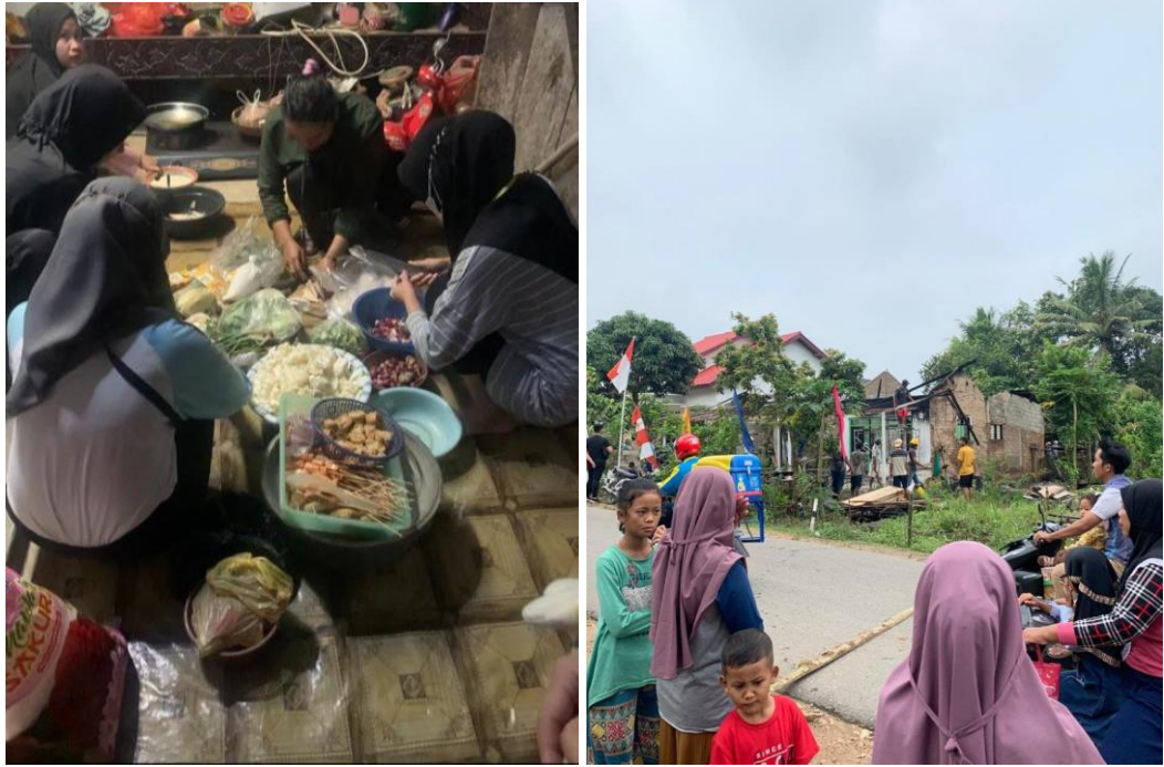
Membantu warga sekitar yang terkena musibah kebakaran di desa Panca Tunggal.