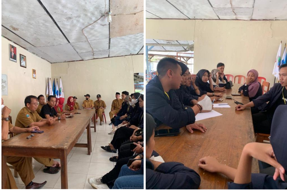
Perkenalan mahasiswa PKPM Darmajaya ke pemdes desa Panca Tunggal.