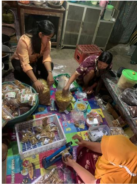
Survey Kembali ke UMKM Sale Pisang di Dusun Campur Rejo.