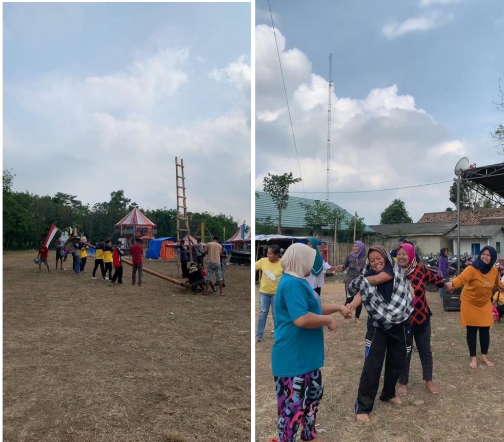
Memeriahkan lomba 17 Agustus di Lapangan Balai Desa Panca Tunggal.