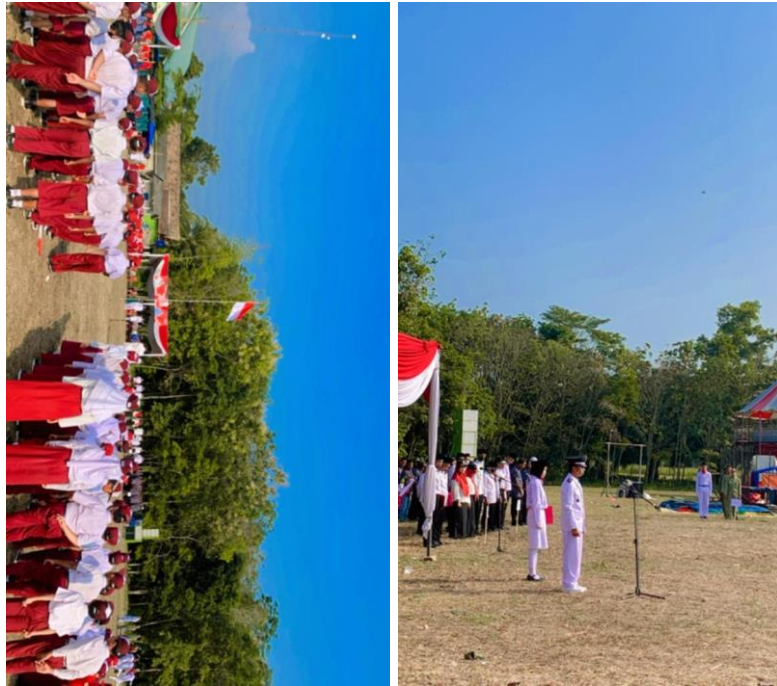
Upacara 17 Agustus