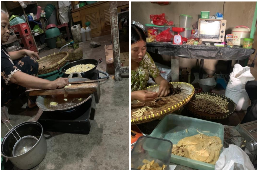
Survei UMKM Sale Pisang di Dusun Campur Rejo