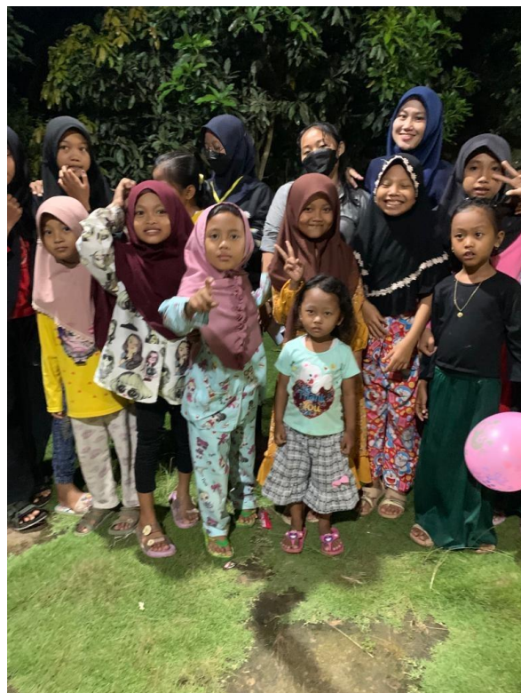
Mengikuti acara tasyakuran memperingati 17 Agustus di RT 002 dusun Campur Rejo. Di lanjutkan dengan lomba anak-anak 17 Agustus di RT 002 dusun Campur Rejo.