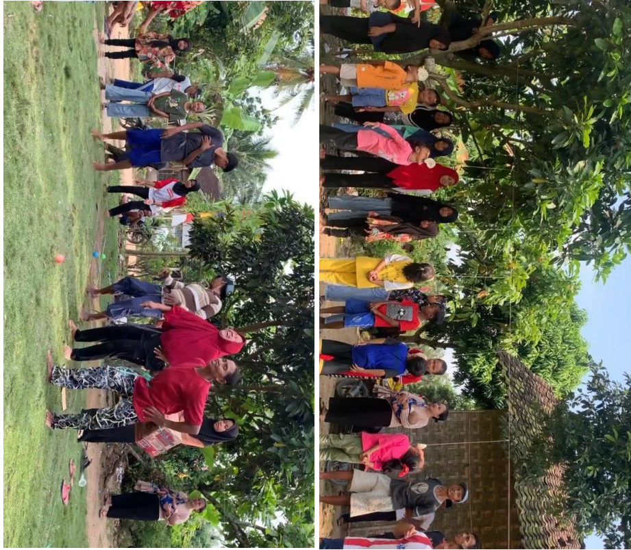
Ikut memeriahkan lomba 17 Agustus di RT 002 Dusun Campur Rejo