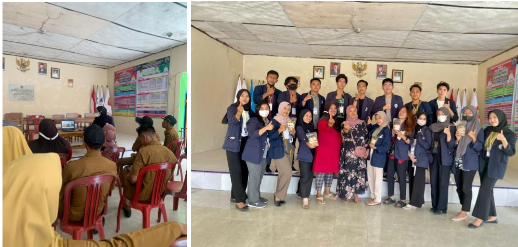
Mahasiswa PKPM Darmajaya melakukan Pelatihan kepada pemilik UMKM yang berada di Desa panca tunggal dengan memberikan pelatihan Akuntansi Keuangan, Desain Grafis, Digital Marketing, dan Perijinan & Legalitas