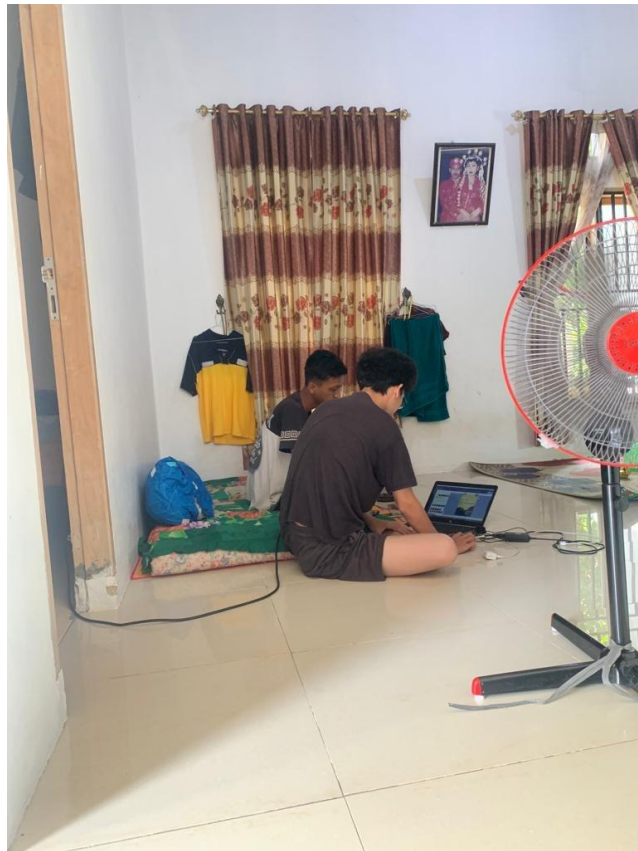
Mendesain kemasan produk UMKM