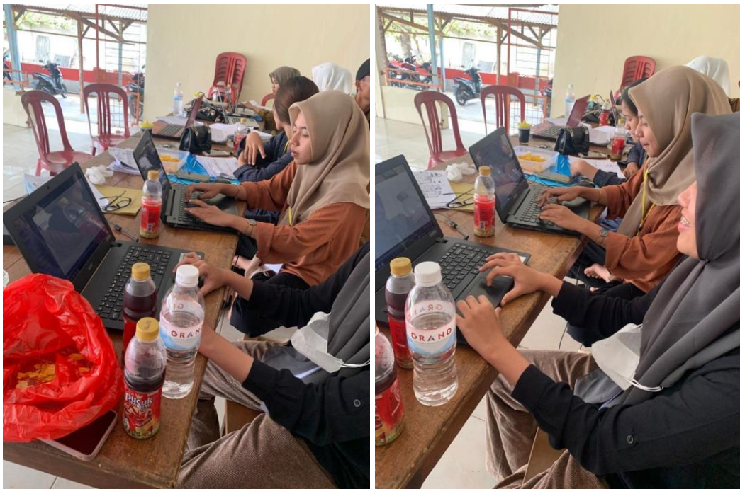
Mahasiswa PKPM Darmajaya membantu pemdes Panca Tunggal dalam pengisian SDGS Desa.