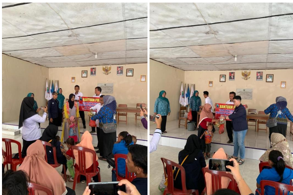
Membantu pemdes dalam pembagian bantuan untuk anak-anak Stunting.