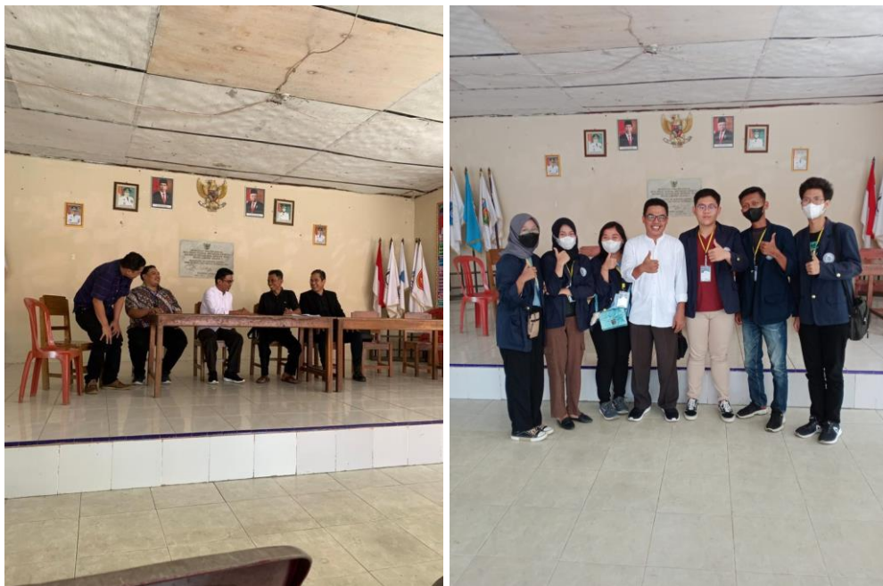
Dosen Pembimbing Lapangan PKPM datang mengunjungi mahasiswa PKPM Darmajaya.