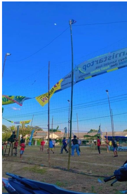
Latihan voli bersama warga dan Pemdes.