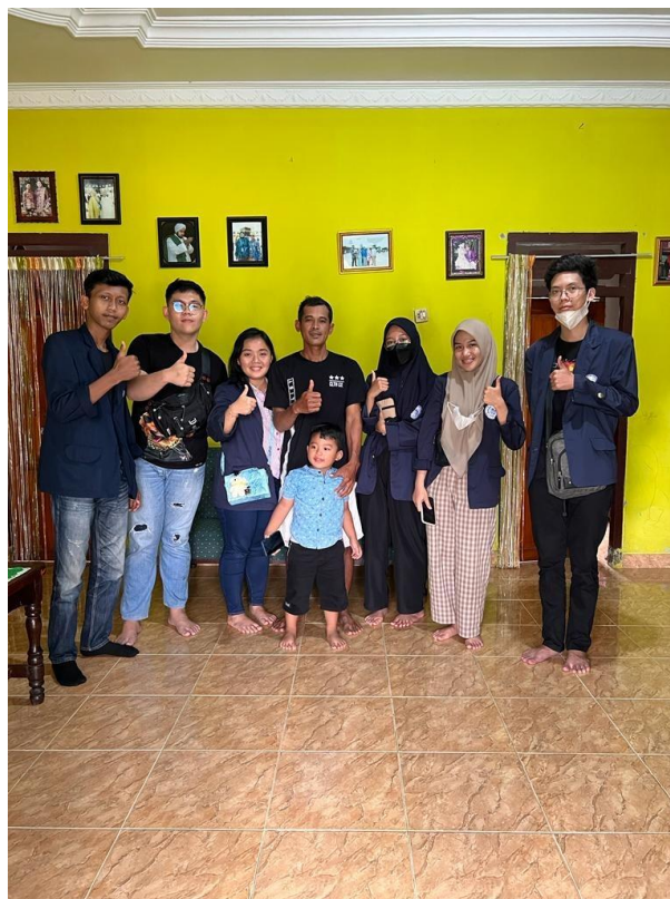
Silaturahmi ke rumah Bapak kadus Campur Rejo.