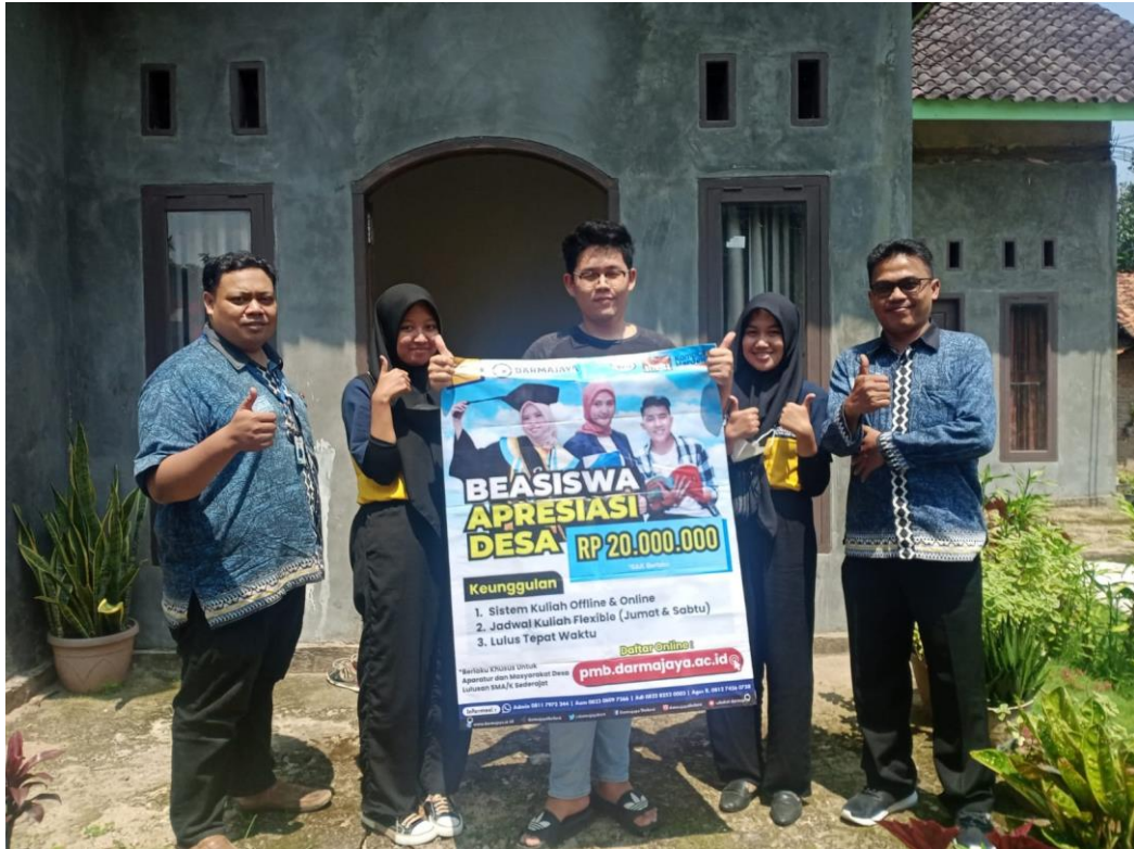
Kunjungan Dosen Pembimbing Lapangan ke rumah tinggal kelompok 71.