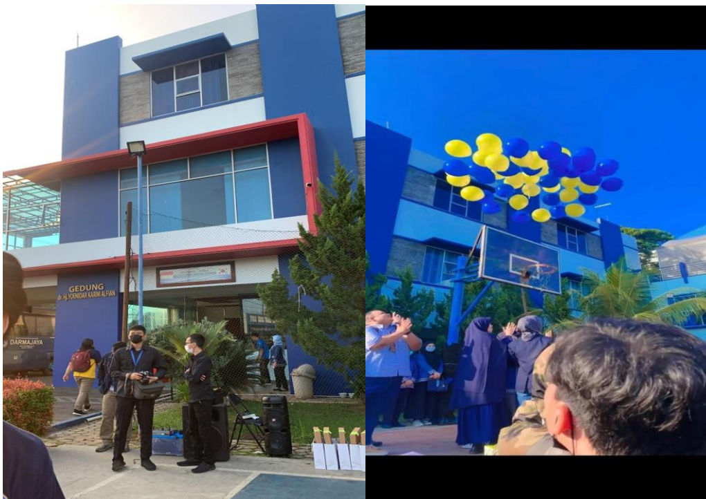
Pelepasan mahasiswa PKPM di Kampus IIB Darmajaya