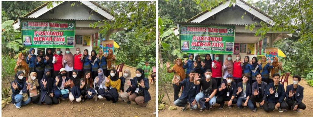
Membantu pelaksanaan posyandu di dusun Campur Rejo.