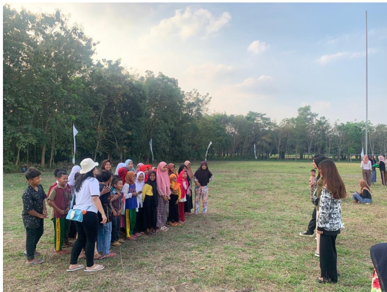
Mengikuti latihan persiapan upacara 17 Agustus