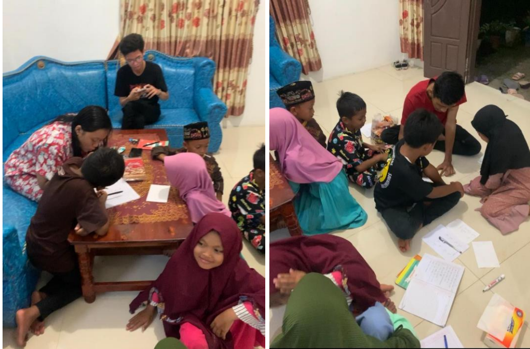
Pembelajaran gratis untuk anak-anak disekitar rumah tinggal di dusun Campur Rejo.