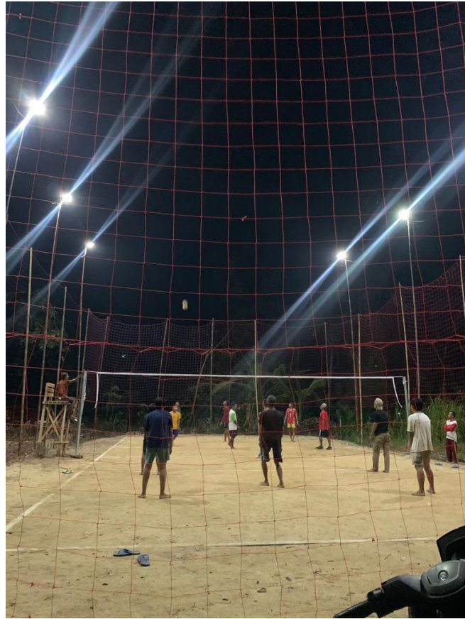
Ikut memeriahkan lomba voly antar RT di Dusun Campur Rejo