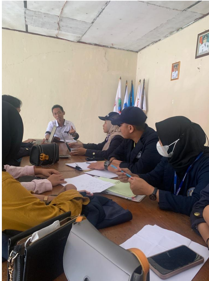
Rapat penyusunan panitia untuk 17 Agustus bersama pemdes desa Panca Tunggal.