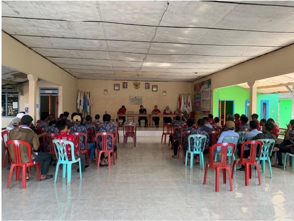
Mahasiswa PKPM Darmajaya ikut membantu pemdes dalam pembagian intensif untuk para RT dan kadus di desa Panca Tunggal.