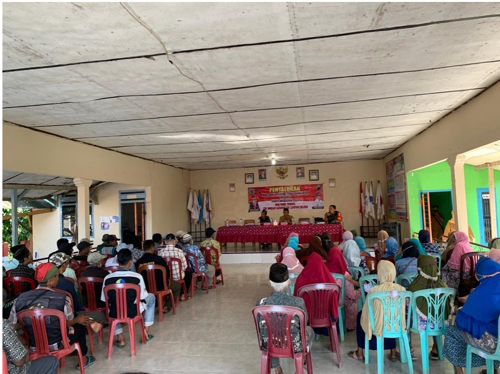
Membantu pemdes dalam penyaluran Bantuan Langsung Tunai Dana Desa (BLT DD) sekaligus membantu pelaksanaan vaksin lanjutan