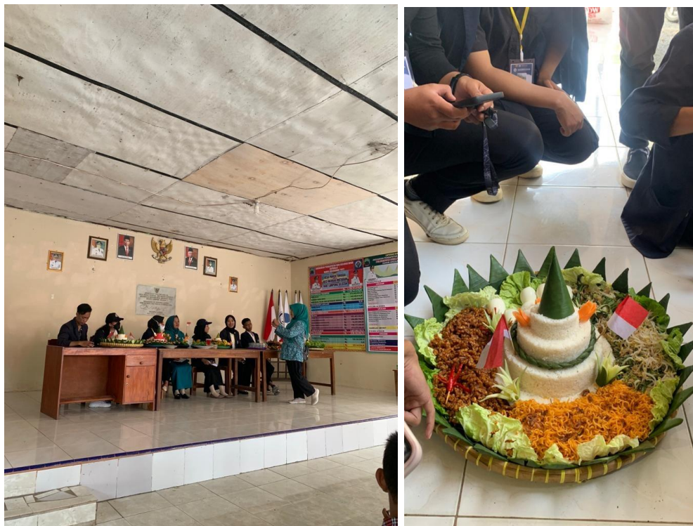
Mahasiswa PKPM Darmajaya menjadi juri lomba tumpeng antar Desa.