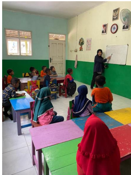
gambar 2. 8 Membantu kegiatan belajar mengajar

Upaya dalam membantu siswa/I paud assyafiyah dalam meningkatkan semangat belajar serta memperluas pengetahuan mereka. Dalam kegiatan ini kami diminta untuk memberi materi tentang pengenalan huruf, cara membaca, menulis dan berhitung.