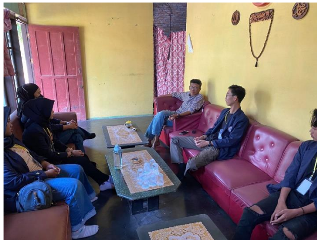
gambar 2. 1 Kunjungan ke umkm maggot

Membantu proses budidaya maggot dari mulai awal mengolah sampah untuk pakan maggot, pemisahan telur, pemanenan maggot hingga pengemasan produk maggot.