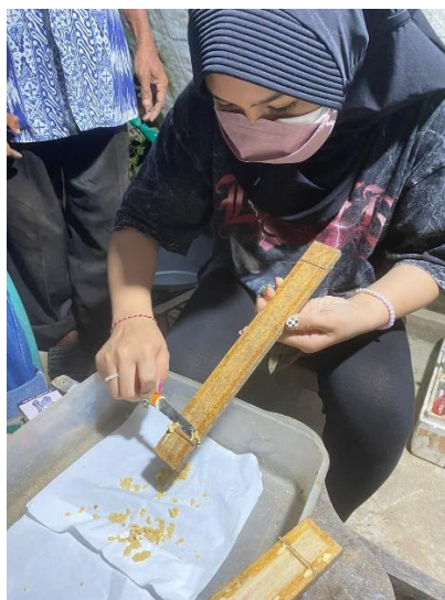
gambar 2. 2 Memisahkan telur maggot