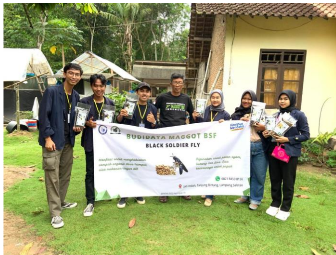
gambar 2. 7 Penyerahan hasil ke UMKM