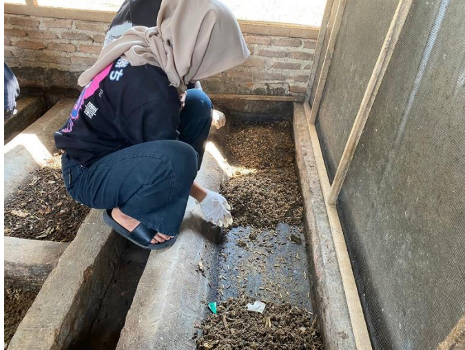
gambar 2. 3 Pemanenan maggot