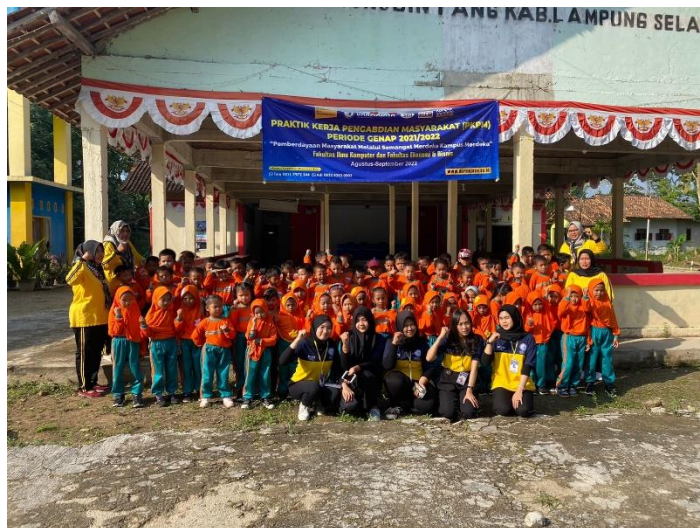
gambar 2. 9 Mengikuti kegiatan jalan sehat