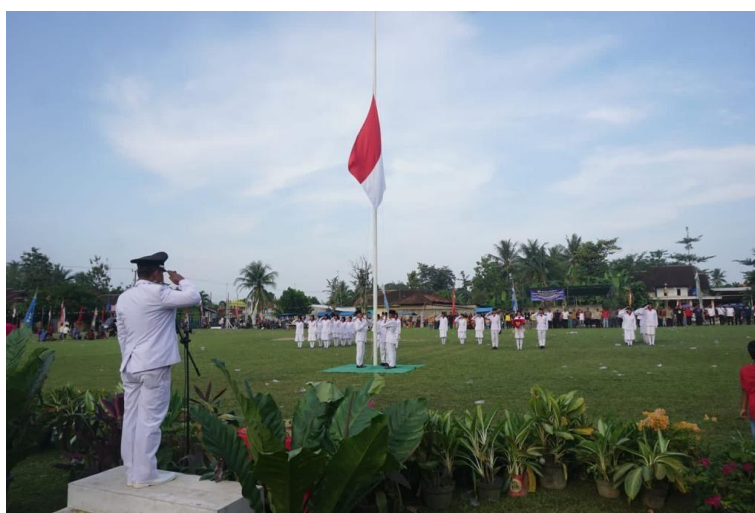
gambar 2. 13 Upacara bendera bersama Kepala Desa Jati Indah

Pada saat memperingati kemerdekaan Indonesia kami membantu masyarakat Desa Jati Indah dalam mempersiapkan kemerdekaan HUT RI ke 77 mengikuti upacara bendera dengan seluruh jajaran perangkat desa hingga ikut memeriahkan lomba yang diadakan di Desa Jati Indah.