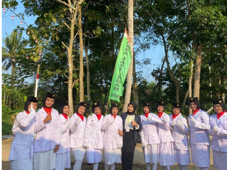
gambar 2. 14 Foto bersama paskibraka