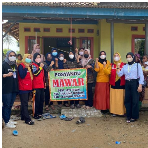
gambar 2. 11 Membantu kegiatan posyandu

Kegiatan posyandu sering diadakan di Desa Jati Indah dan kami membantu kegiatan dalam memeriksa bayi dan balita.