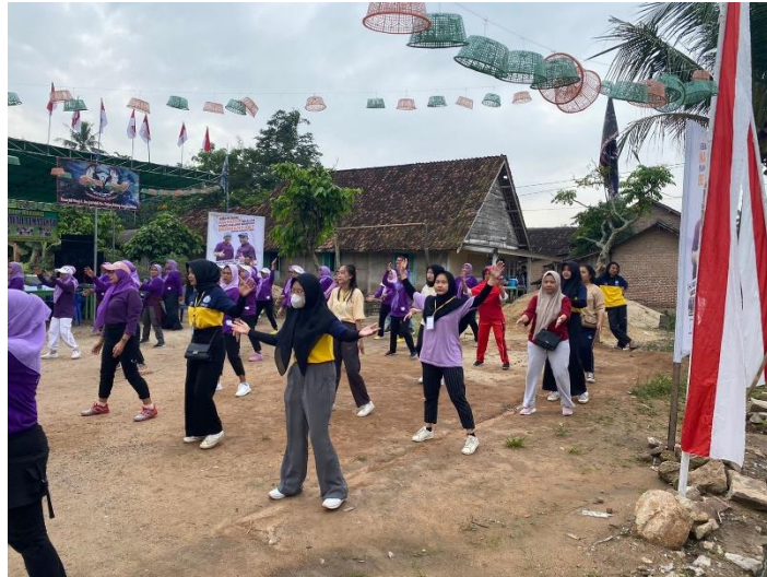
gambar 2. 10 Mengikuti kegiatan senam