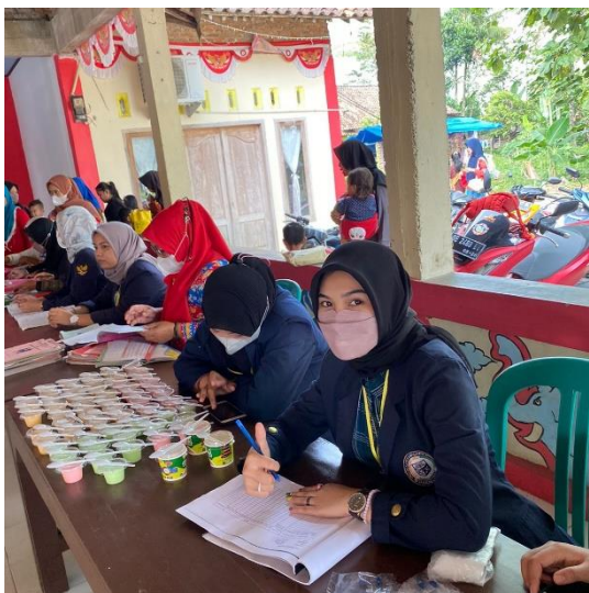
gambar 2. 12 Membantu kegiatan posyandu