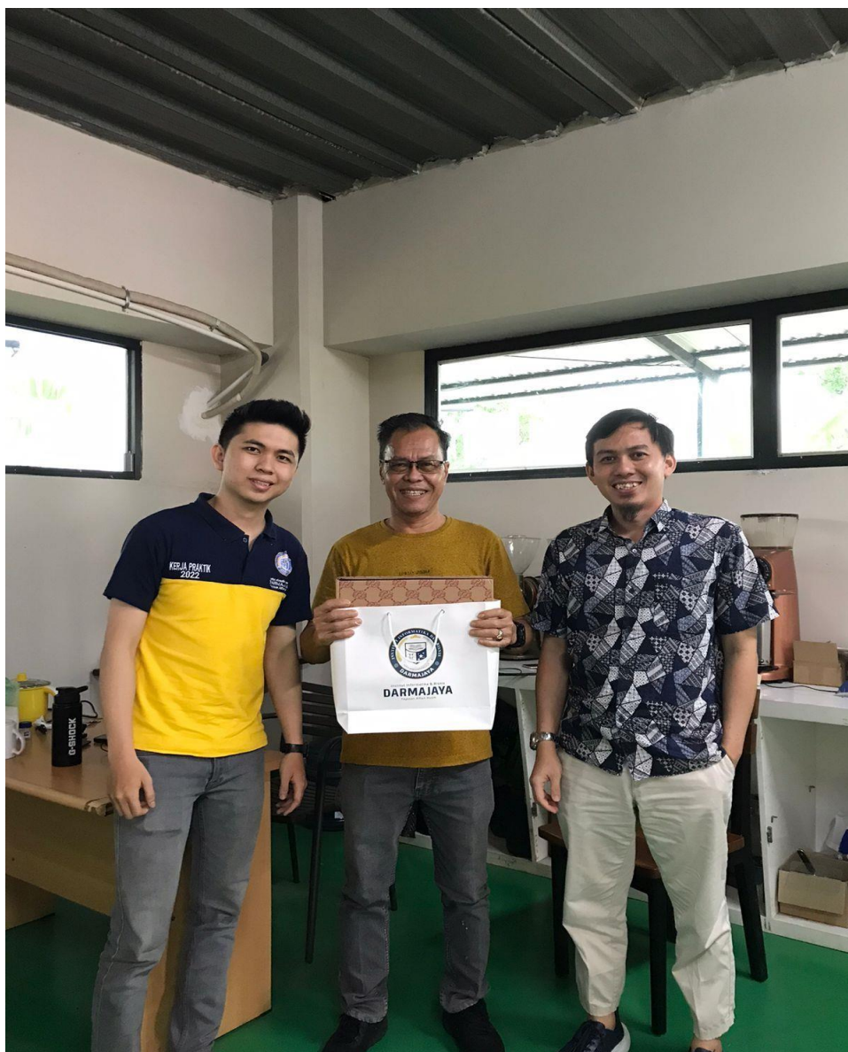
Lampiran 9. Penjemputan Peserta Mahasiswa Kerja Praktek