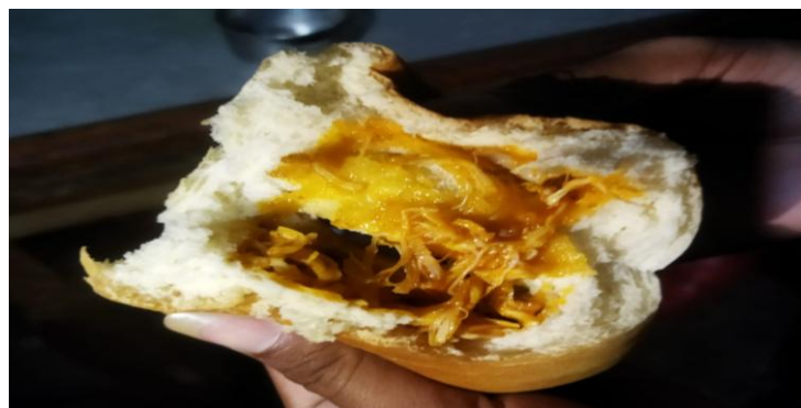
Gambar 3. Varian Rasa Ayam di UMKM “ARRA ROTI”

Seiring perkembangan zaman, pengolahan roti mengalami perubahan dan variasi yang dibuat dengan berbagai rasa dan bentuk yang bervariasi. Varian produk yang dikembangkan juga akan mempengaruhi konsumen dalam berbelanja. Dalam hal ini, dikembangkan varian rasa Ayam pada produksi roti di UMKM "ARRA ROTI" untuk menambah varian produk "ARRA ROTI".