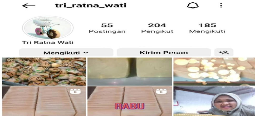
Gambar 6. Pemasaran produk ARRA ROTI melalui media sosial Instagram