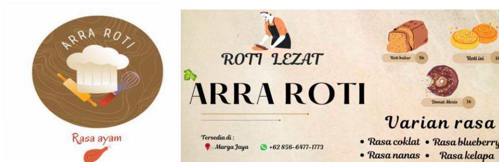
Gambar 4. Desain logo produk ARRA ROTI (kiri) dan Desain banner di UMKM "ARRA ROTI" (kanan)

Brand awareness merupakan suatu cara untuk mengukur efektivitas pemasaran dalam hal kemampuan konsumen untuk mengenali dan mengingat suatu produk yang meliputi: nama, gambar, logo, dan slogan. Semakin banyak konsumen yang mengingat suatu produk, semakin besar pula intensitas pembelian pada produk tersebut. Menurut Kineta (2017), salah satu dalam memperhatikan Brand awareness adalah desain kemasan. Desain kemasan dapat berperan sebagai daya tarik dan pemberi informasi melalui aspek artistik, warna, grafis, bentuk, dan desain. Desain kemasan juga merupakan identitas produk agar mudah dikenali dari produk lainnya sehingga pembaharuan atau redesain kemasan menjadi salah satu solusi yang dapat dilakukan untuk memberikan brand awareness pada kemasan roti milik UMKM "ARRA ROTI".