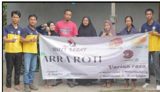
Gambar 1. Rumah Produksi UMKM “ARRA ROTI”

UMKM memiliki peran penting dalam pembangunan ekonomi nasional. UMKM di desa bagi perekonomian daerah memiliki manfaat dalam meningkatkan pendapatan, memberdayakan masyarakat, mendapatkan pengalaman berwirausaha, memperkecil angka pengangguran di desa, mengembangkan potensi masyarakat, mengembangkan usaha yang telah ada sebelumnya, serta menumbuhkan rasa ingin maju dan sebagainya. Tujuan Pengembangan UMKM sebagai bentuk pengembangan keterampilan kewirausahaan dan kemampuan untuk menjalankan usaha kecil dan menengah. Salah satu UMKM yang berkembang di Desa Talang Jawa adalah UMKM "ARRA ROTI"