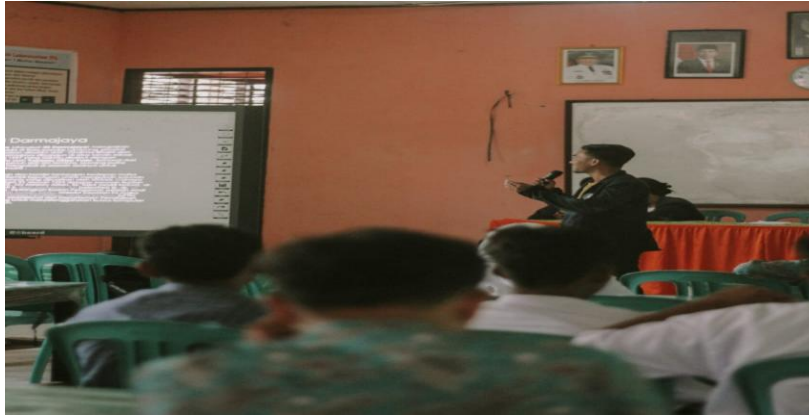
Gambar 7. Sosialisasi kepada siswa SMAN 1 Merbau Mataram