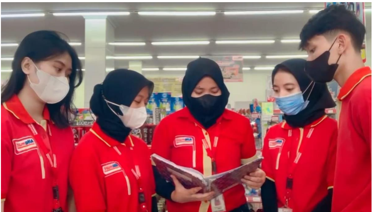
Lampiran 2. Personil toko melakukan Briefing