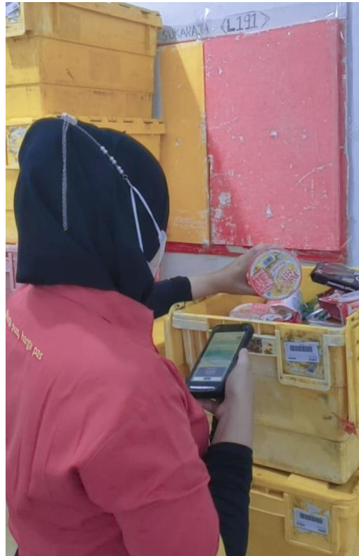
Lampiran 3. Melakukan Pengecakan Barang dari WH