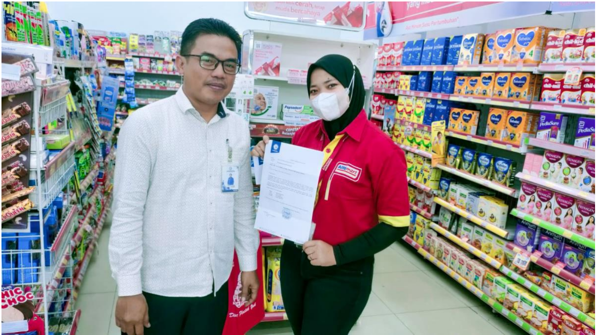
Lampiran 1. Kunjungan Dpl ke tempat Kerja Praktik