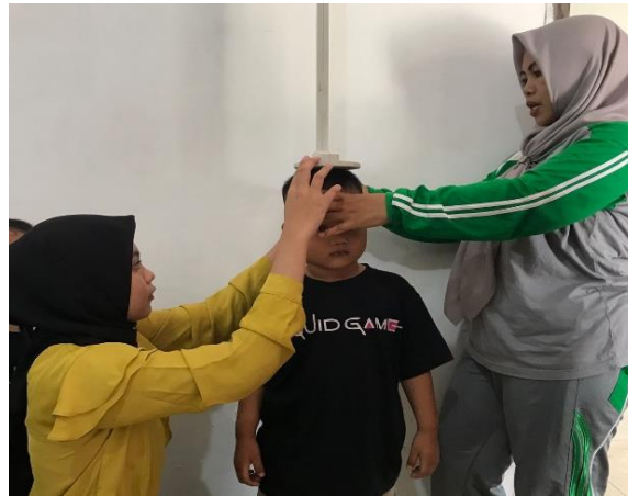
Gambar 1.4 Kegiatan Posyandu Rutin

Kegiatan Posyandu merupakan kegiatan rutin bulanan yang dilakukan secara rutin di Desa Trimulyo untuk meningkatkan peran, serta masyarakat untuk mengembangkan kegiatan kesehatan dan KB agar tercapai masyarakat sehat sejahtera.