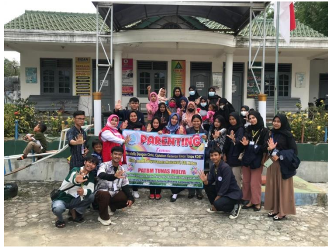
Gambar 1.3 Mengikuti Kegiatan Parenting