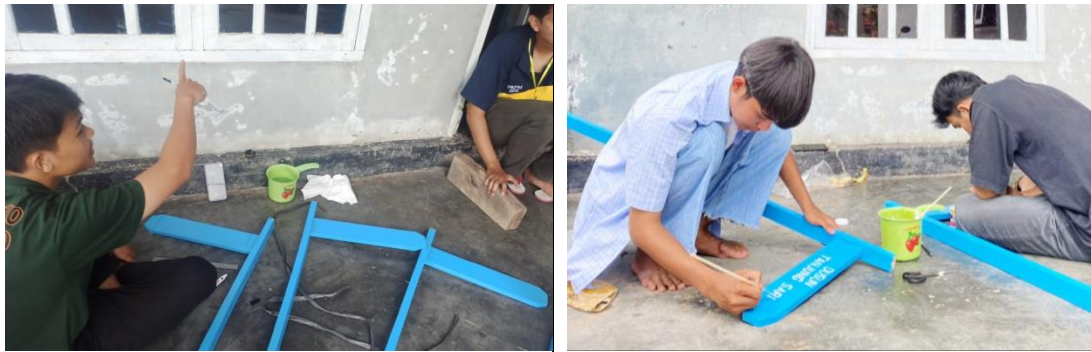
Gambar 1.5 Pembuatan Plang Jalan