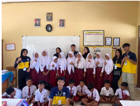
Gambar 1.2 Sosialisasi Dan Pendampingan Belajar Di SD 1 Trimulyo

Melakukan sosialisasi dan pendampingan belajar kepada siswa/siswi SD 1 Trimulyo. Dengan tema “Bahaya Gadget Bagi Kesehatan”, dengan dimaksudkan bahwa seberapa bahaya kecanduan gadget. Tema tersebut diharapkan anak-anak untuk tidak menggunakan gadget dengan sembarangan karena selain berdampak bagi kesehatan fisik, kecanduan gadget juga bisa mengganggu kesehatan mental pada anak dan membuat anak sulit untuk fokus.