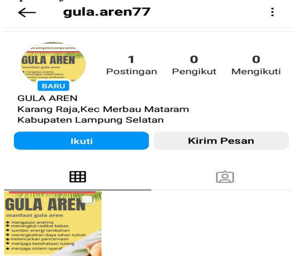
Gambar 2.3.3 promosi penjualan melalui media sosial

Dari pemilik yang belum membranikan diri untuk memasarkan produk melalui jejaring sosial. Selaku mahasiswa memberikan inovasi berupa pembuatan akun media sosial yaitu instagram dengan tujuan mendapatkan knsumen baru, memperluas areapenjualan tidak hanya di pasar tradisional melainkan di media sosial juga. Manfaatnya pemilik mulai berani untuk mencoba memasarkan produk melalui media sosial yaitu instagram, dan mampu bersaing secara ketat lagi. Pengguna media sosial seperti instagram ini berguna untuk meningkatkan penjualan gula aren. Menambah konsumen baru, memperluas pangsa pasar dan dapat terjual secara luas.