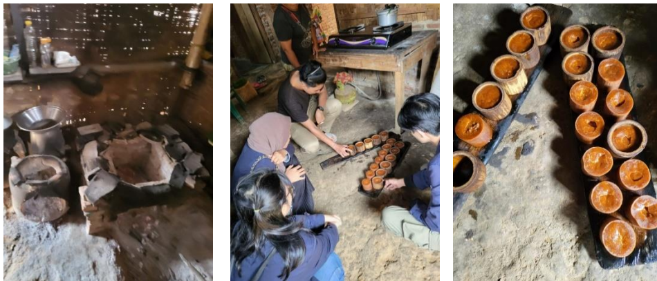
Gambar 2.3.1 proses produksi UMKM Gula Aren

Proses produksi adalah cara, metode, serta untuk menciptakan mengolah atau memberi nilai tambah bagi suatu barang atau jasa dengan menggunakan sumber – sumber daya (tenaga kerja, bahan-bahan, dana) yang ada. Dalam kegiatan ini proses produksi Gula Aren yang masih dilakukan secara tradisional mulai dari pencarian Aren ke hutan/ kebun dan proses perebusan nya menggunakan kayu bakar lalu bambu untuk mencetak gula aren tersebut. kegiatan ini cukup memakan waktu yang sangat lama terutama di perebusan.