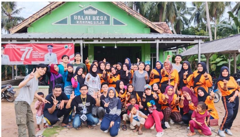
Gambar 5 Senam Rytin Bersama ibu PKK di Desa Karang Raja