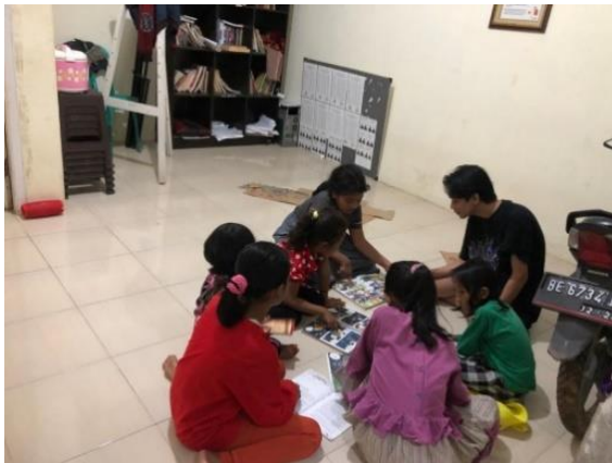
Gambar 4 Mengajar les secara gratis bersama anak-anak desa Karang Raja