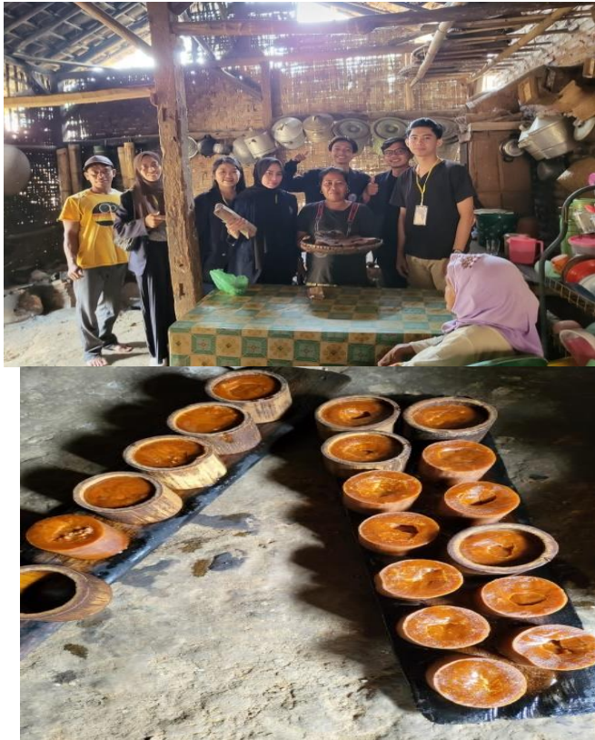
Gambar 2 Proses pembuatabn UMKM Gula Aren