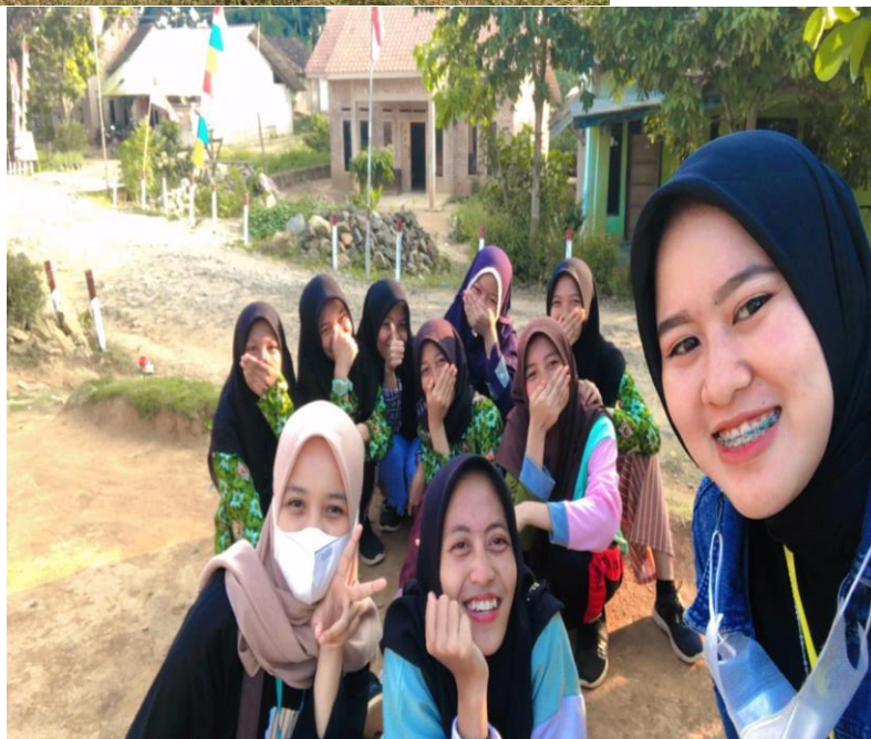
Gambar 6 Melatih Paskibra Untuk HUT RI