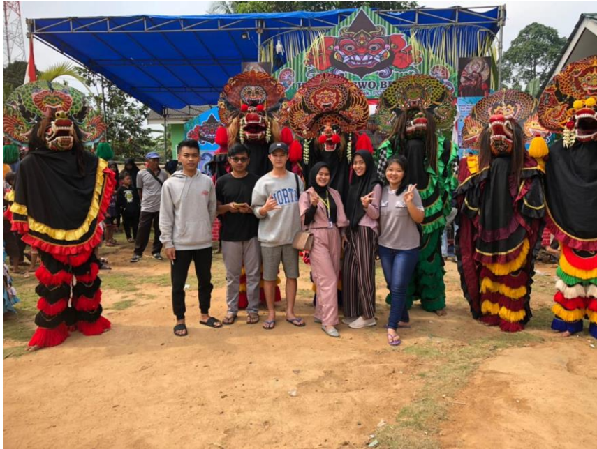
Gambar 9 Berpartisipasi dalam acara kebudayaan ( jaranan)