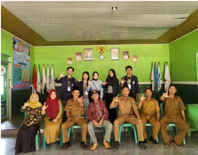
Gambar 1 Kunjungan kades dan kadus di balai desa Karang Raja