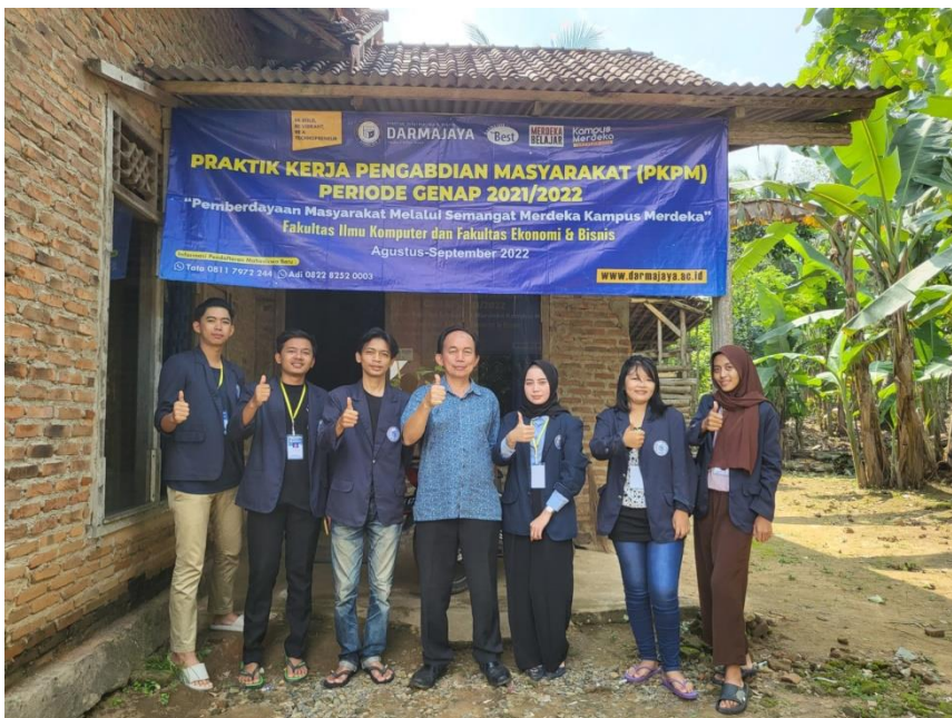
Gambar 10 Kunjungan DPL