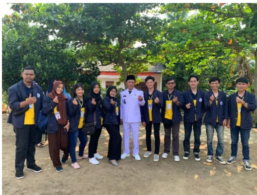
Gambar 3 Ikut serta upacara HUT RI ke 77