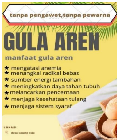
Gambar 2.3.2 logo UMKM gula aren