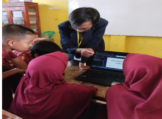
Gambar 3 Pengenalan Word

Maksud dari sosialisasi pengenalan word adalah untuk memberikan informasi kepada anak-anak SDN 1 Sinar Ogan serta orang tua di Sinar Ogan mengenai pentingnya belajar Microsoft word dari sekarang karena dapat mempermudah mereka di masa yang akan datang.