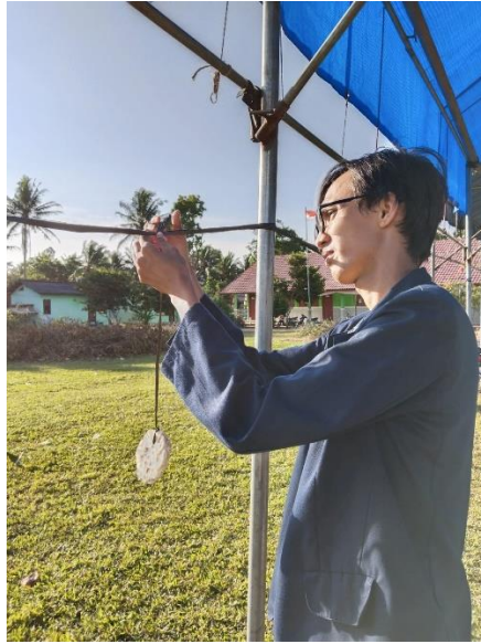
Gambar 5 Membantu persiapan lomba 17an

Pada saat memperingati kemerdekaan Indonesia kami membantu masyarakat Desa Sinar Ogan dalam mempersiapkan kemerdekaan HUT RI ke 77 mengikuti upacara bendera dengan seluruh jajaran perangkat desa hingga ikut memeriahkan lomba yang diadakan di Desa Sinar Ogan.