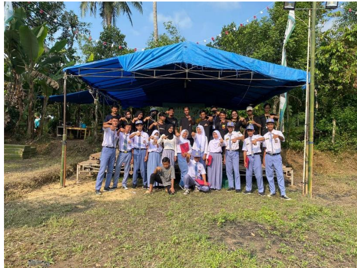
Gambar 6 Foto bersama petugas upacara