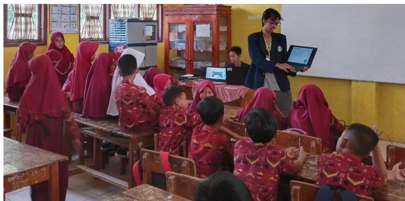
Gambar 4 Sosialisai Media Sosial

Upaya dalam membantu siswa/I SD Negeri 1 Sinar Ogan dalam meningkatkan minat belajar lewat sosial media, para pelajar secara aktif bisa lebih kreatif dan mandiri sehingga kualitas pelajaranpun bisa semakin meningkat baik dan segi pengetahuan maupun kualitas.