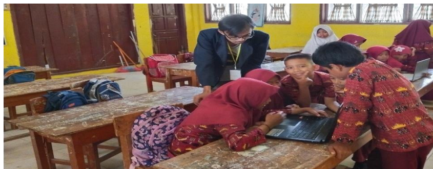
Gambar 2 Pengenalan Komputer

Membantu proses belajar anak sekolah serta memberikan pemahaman pentingnya menggunakan komputer dalam memudahkan pembuatan tugas sekolah.