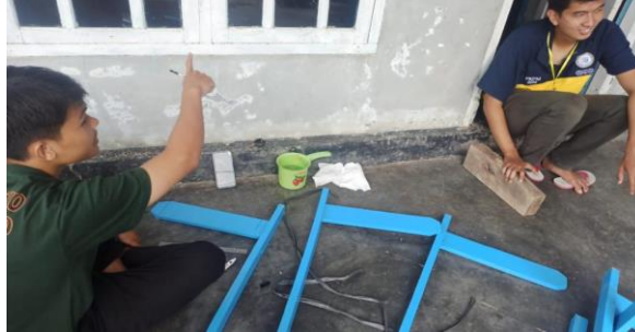
Gambar 1. 7 Pembuatan plang jalan

Tujuan dari adanya pembuatan papan nama atau plang jalan adalah untuk memberikan informasi kepada masyarakat dan pengguna jalan lainnya yang ingin mencari lokasi atau jalan tertentu di Desa Trimulyo.