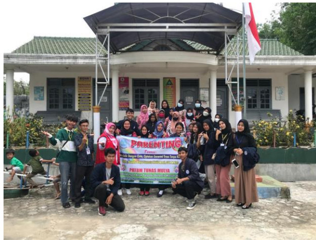
Gambar 1. 5 Kegiatan Parnting di Desa Trimulyo

Parenting adalah orang yang sedang melakukan atau mengerjakan aktivitas sebagai orang tua. Selanjutnya kata parenting berdasar makna atau arti merupakan ilmu tentang mengasuh, membimbing, serta mendidik anak dengan cara baik dan benar. Melalui parenting orang tua akan memiliki keterampilan dan pengetahuan yang sangat bermanfaat khususnya bagi anak, misalnya seperti pengetahuan tentang pola pengasuhan yang baik akan membentuk kepribadian anak. Kegiatan parenting juga merupakan salah satu wujud dari pendidikan ramah anak. Kegiatan ini dilakukan di TK Permata Bunda dengan dihadiri oleh warga Desa Trimullyo.