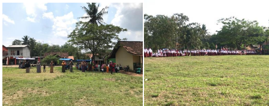
Gambar 1. 2 Kegiatan upacara HUT RI Ke-77

Upacara HUT-RI untuk memperingati hari sakral, kemerdekaan bangsa Indonesia, upacara peringatan detik detik proklamasi kemerdekaan bangsa Indonesia dan pengibaran sang merah putih serta lomba lomba ditingkat desa .Upacara bendera dapat meningkatkan sikap kebersamaan dan persatuan disekolah maupun didesa karena pertama upacara membuat semua peserta yang akan senantiasa bersama sama mengikuti aba aba dari pemimpin upacara dan berpakaian seragam, sehingga menunjukkan sikap kebersamaan. Kedua upacara membuat semua peserta upacara mengingat perjuangan para pahlawan yang telah gugur.