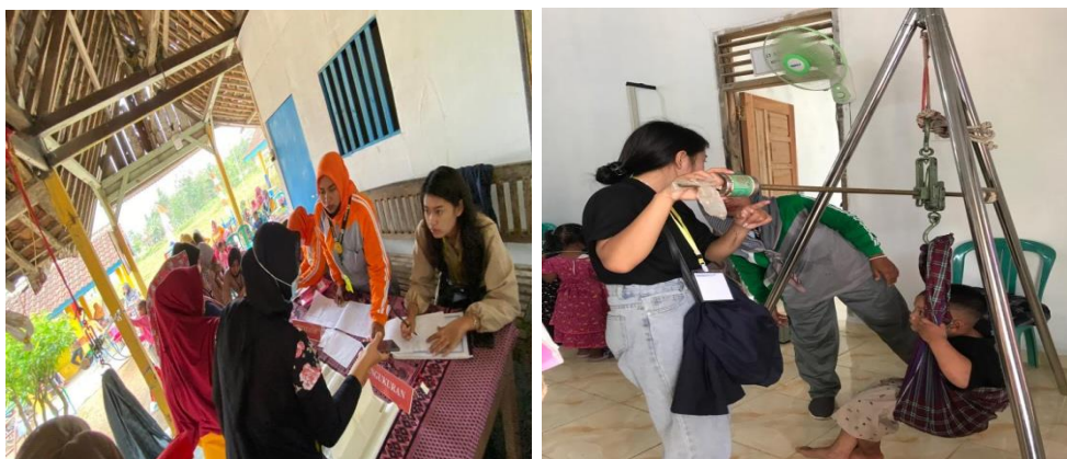
Gambar 1. 4 Kegiatan posyandu di desa Trimulyo

Posyandu dapat mencegah anak terkena berbagai faktor risiko stunting melalui program program yang diselenggarakan .Beberapa program Posyandu sebagai upaya pencegahan stunting adalah pemberian vitamin A, penanggulangan diare,sanitasi dasar serta peningkatan gizi Posyandu bukan hanya terkait vaksinasi. Namun di Posyandu juga bisa dimanfaatkan untuk memantau tumbuh kembang anak seperti mengukur berat badan ,tinggi badan,dan lingkaran kepala anak diukur untuk mendeteksi sejak dini jika terjadi hal hal tidak diinginkan seperti kekurangan gizi.