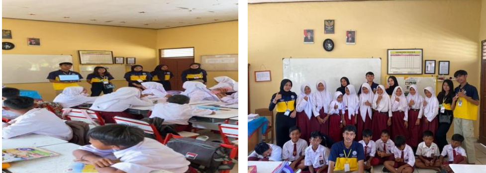
Gambar 1. 3 Sosialisasi dan pendampingan belajar di SDN 1 Trimulyo

sembarangan dan berlebih dikarenakan selain berdampak bagi kesehatan fisik, kecanduan gadget juga bisa mengganggu kesehatan mental pada anak dan membuat anak sulit untuk fokus.