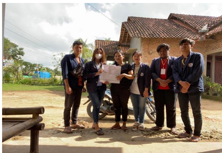
Penyerahan Legalitas Usaha