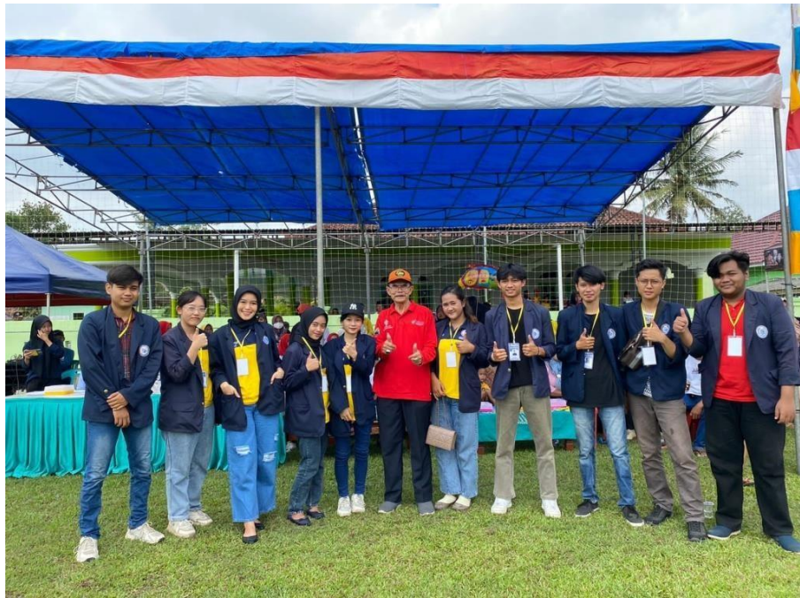
Perayan HUT RI 77 Tahun