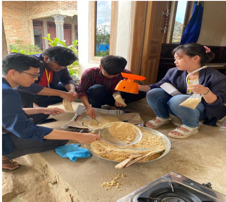
Gambar 3. Ikut Serta Dalam Proses Pembuatan Jamu