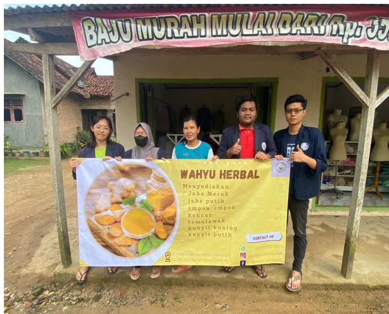
Penyerahan Banner UMKM Wahyu Herbal