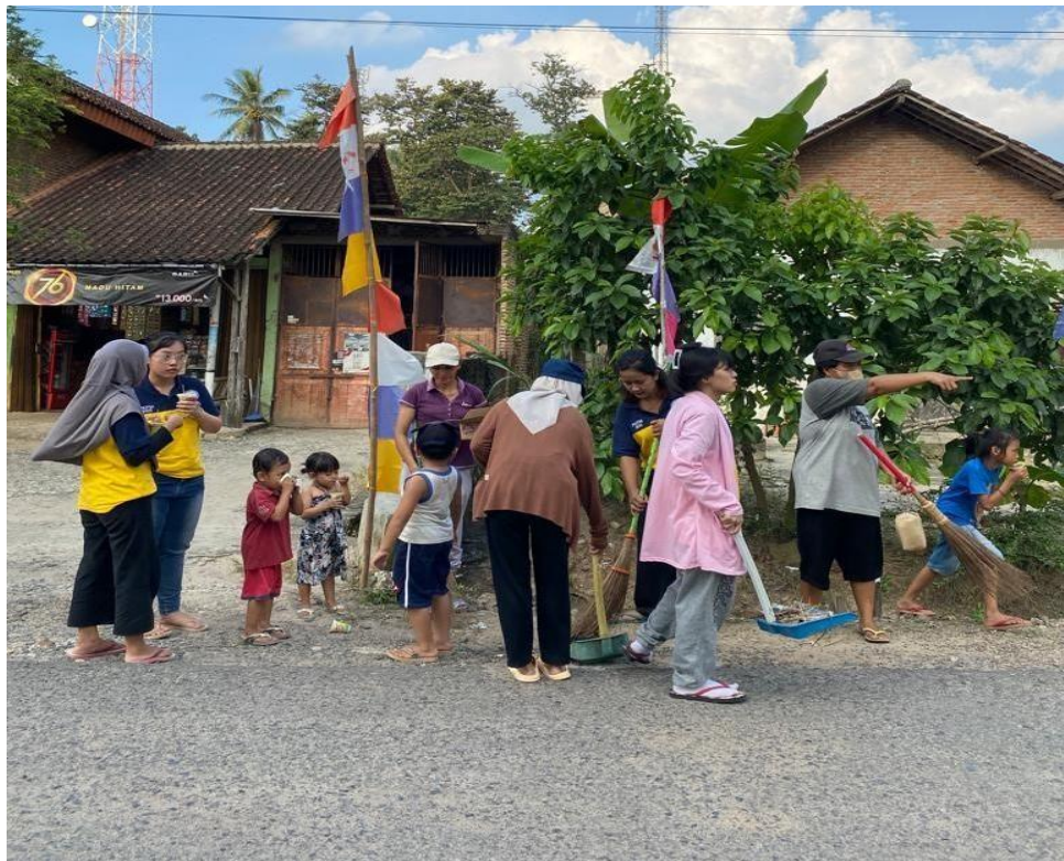
Membantu Kegiatan Gotong Royong