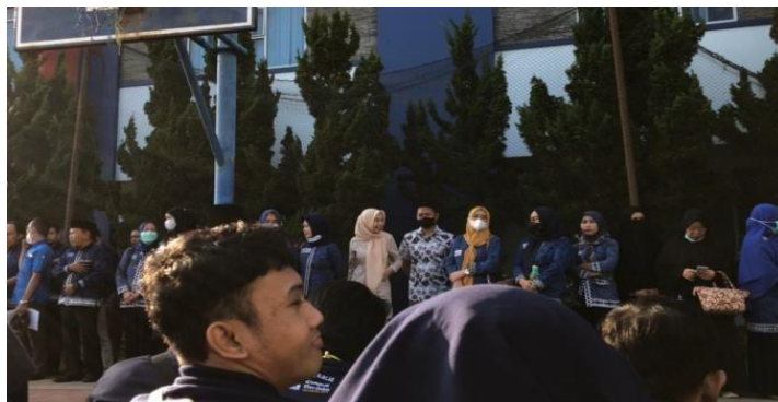
Pemberangkatan Mahasiswa PKPM