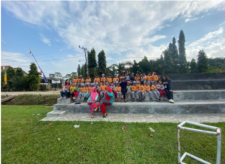
Membantu Pembelajaran di paud Al-Fatih