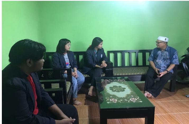
Kunjungan Dosen Pembimbing Lapangan