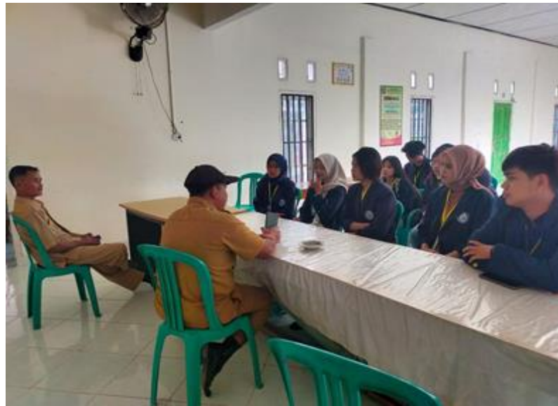
Gambar 1 Kunjungan ke Balai Desa

Beberapa dokumentasi kegiatan selama menjalankan kegiatan Praktek Kerja Pengabdian Masyarakat