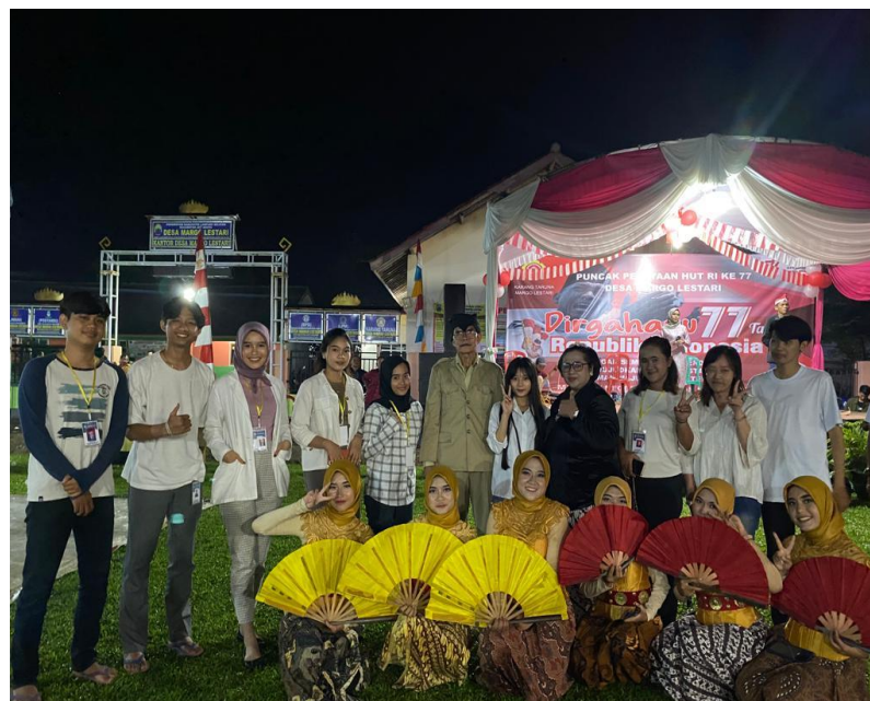
Gambar 2 Meramaikan acara malam puncak 17 Agustus