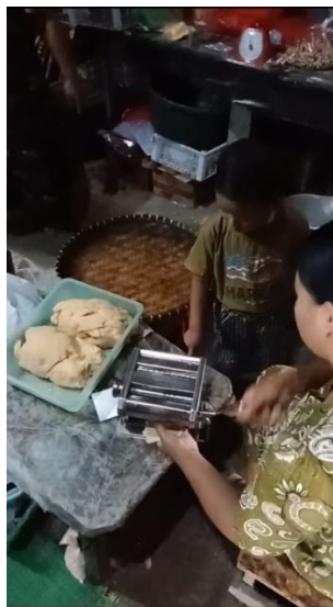
Gambar 7 proses pembuatan adonan

Proses awal pembuatan molen mini adalah dengan melakukan pemotongan sale pisang untuk bahan utama pembuatan molen mini.