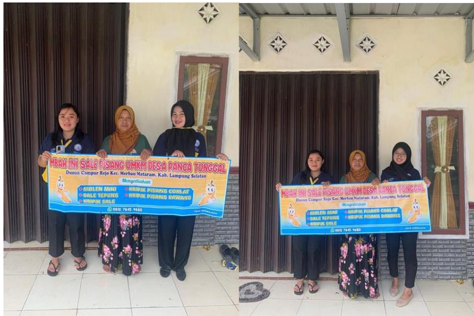
Gambar 14 memberikan hasil desain

Setelah terlaksananya program kerja mahasiswa PKM memberikan banner kepada UMKM sebagai bentuk ucapan terimakasih kepada pemilik UMKM yang telah membantu dan mendukung mahasiswa melakukan program kerja yang telah terlaksana dengan baik.