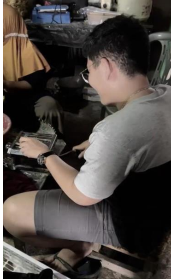
Gambar 8 proses penggilingan adonan

Proses selanjutnya adalah pembuatan adonan kulit molen mini yang berbahan dasar campuran tepung terigu, gula, telur, ragi, mentega, vanili, dan garam.