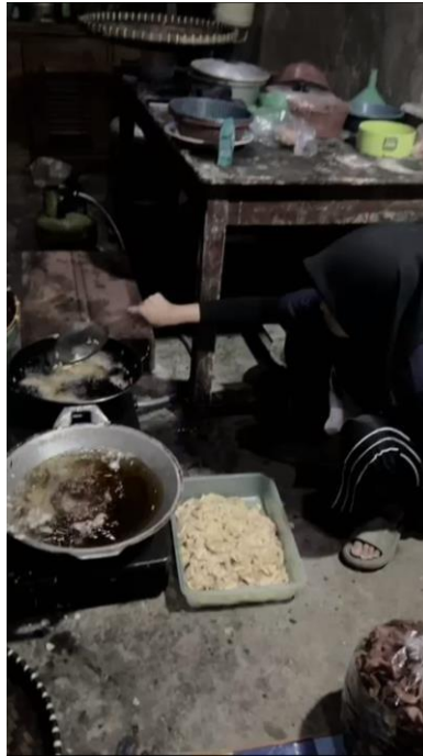
Gambar 10 proses penggorengan

Proses selanjutnya, setelah adonan terbentuk sesuai dengan produk molen mini sale pisang lalu penggorengan dilakukan sebanyak 2 kali untuk menghasilkan tekstur yang renyah.