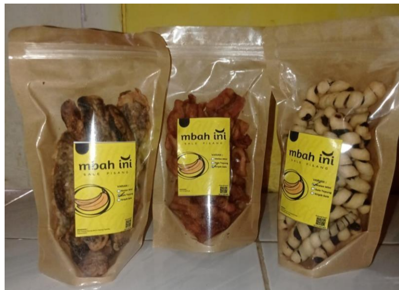
Gambar 5 kemasan baru

Berikut adalah tampilan produk dengan kemasan lama yang digunakan oleh pemilik UMKM dalam memasarkan produknya yang dipasarkan di outlet - outlet atau warung kecil .