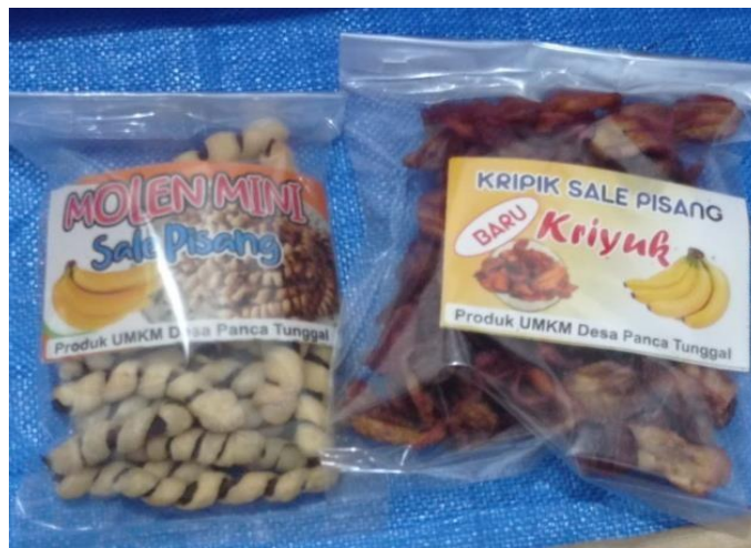
Gambar 4 kemasan lama

Setelah survei tempat UMKM, mahasiswa PKPM telah berbincang bincang dengan pemilik UMKM membahas dan mendiskusikan tentang kelemahan kemasan yang digunakan oleh pemilik UMKM. Dengan ini Mahasiswa PKPM melakukan pembuatan desain kemasan yang terbaru untuk memodifikasi kemasan produk yang lama.