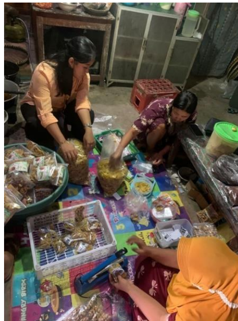
Gambar 11 proses pengemasan

Proses selanjutnya, setelah adonan terbentuk sesuai dengan produk molen mini sale pisang lalu penggorengan dilakukan sebanyak 2 kali untuk menghasilkan tekstur yang renyah.