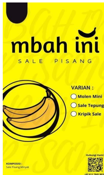
Gambar 3 membuat desain kemasan