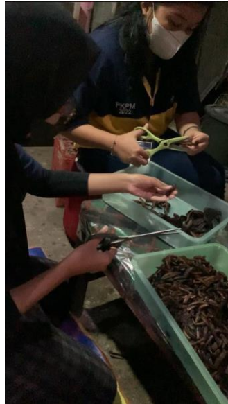
Gambar 6 proses pemotongan sale pisang

Proses awal pembuatan molen mini adalah dengan melakukan pemotongan sale pisang untuk bahan utama pembuatan molen mini.