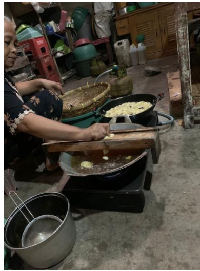
Gambar 2 kunjungan umkm

Sebelum melaksanakan program kerja PKPM di UMKM Sale Pisang mahasiswa PKPM melakukan kunjungan terlebih dahulu guna mengetahui apa saja kegiatan yang dilakukan sehari-hari di UMKM Sale Pisang dan juga sedikit berbincang dengan pemilik UMKM tersebut mengenai tahapan proses pembuatan produk Sale Pisang yang benar