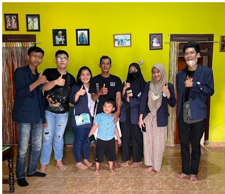
Gambar 1 rumah kadus

Sebelum melaksanakan kegiatan survey pada UMKM dan potensi desa perlu untuk berkoordinasi ke pada KADES maupun perangkat desa sehingga mendapat arahan yang lebih baik dan semua dapat berjalan dengan lancar pada kegiatan PKPM.