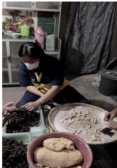
Gambar 9 proses pembentukan molen

Setelah dibuatnya adonan kulit molen mini selanjutnya adalah proses penggilingan kulit adonan molen mini dengan tujuan agar kulit adonan menjadi pipih dan mudah untuk di potong atau di gunting.