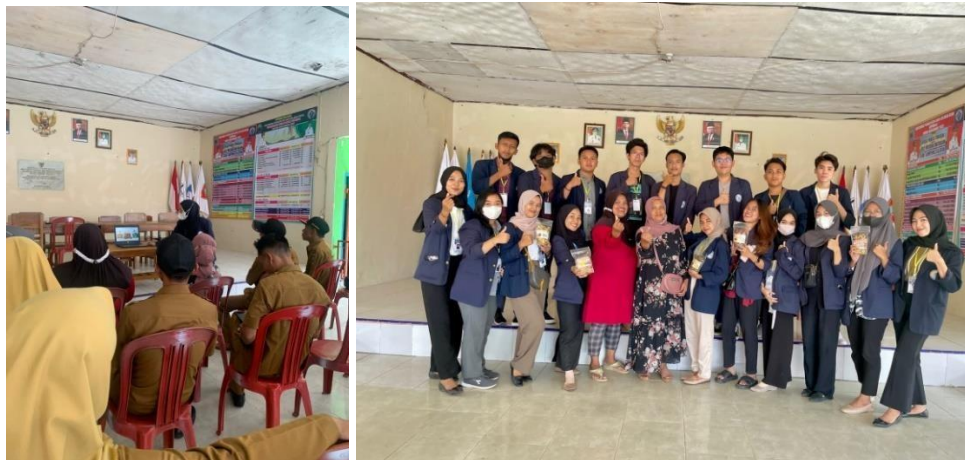
Gambar 12 pelatihan UMKM

Mahasiswa PKPM melakukan pelatihan yang ditujukan untuk pemilik UMKM di desa Panca Tunggal. Pelatihan mencakup materi tentang Digital Marketing, Akuntansi Keuangan, Desain Grafis, dan Perizinan & Legalitas. Yang bertujuan agar pemilik UMKM menambah wawasan yang lebih mengenai pemasaran produknya, menyusun laporan keuangannya, membuat perizinan legalitas usaha yang mereka dirikan dan memodifikasi kemasan produk.