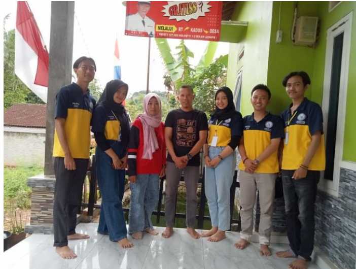
Gambar 2.3.18 Berpamitan dengan Kepala Dusun Balangandang Desa Tanjung Baru

Berpamitan dengan Kepala Dusun sebelum pulang kerumah.