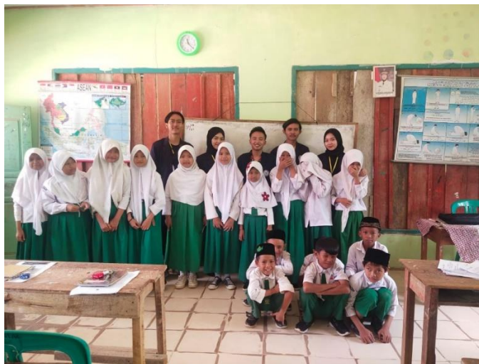
Gambar 2.3.15 Melakukan sosialisasi ke SD/MI Nurul Falah Tanjung Baru

Memberikan sosialisasi tentang bahaya merokok pada anak remaja di SD/MI Nurul Falah Tanjung Baru