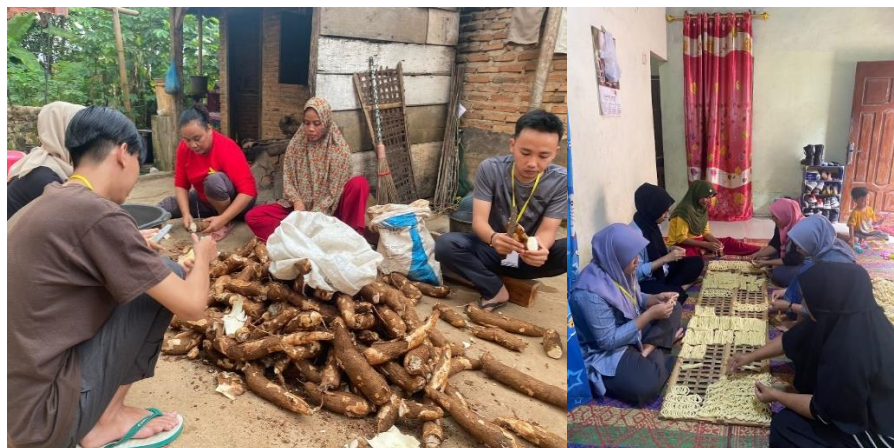
Gambar 2.3.5 Membantu kegiatan produksi kelanting

Membantu kegiatan produksi kelanting mulai dari mengupas kulit singkong sampai membentuk adonan singkong menjadi kelanting.