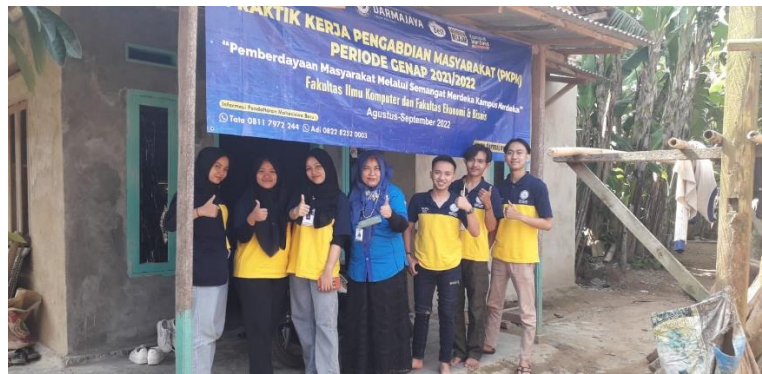
Gambar 2.3.1 Pelepasan peserta PKPM

Pelepasan ini adalah awal kegiatan PKPM yang didampingi langsung oleh Dosen Pembimbing Lapangan dan mengantarkan Mahasiswa ke Posko PKPM di Tanjung Baru kecamatan Merbau mataram kabupaten Lampung selatan.