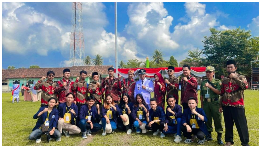
Gambar 2.3.9 Upacara HUT NKRI Yang ke-77

Mengikuti kegiatan upacara Hari Kemerdekaan Republik Indonesia Ke-77 di Kecamatan Merbau Mataram.