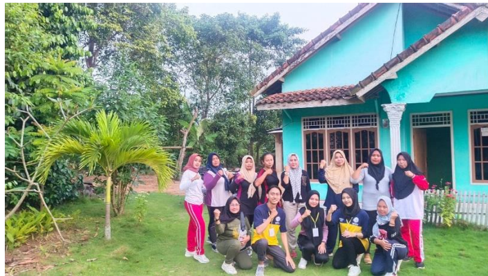
Gambar 2.3.3 Senam jantung sehat Bersama ibu-ibu kader

Melakukan senam jantung sehat Bersama ibu-ibu kader.