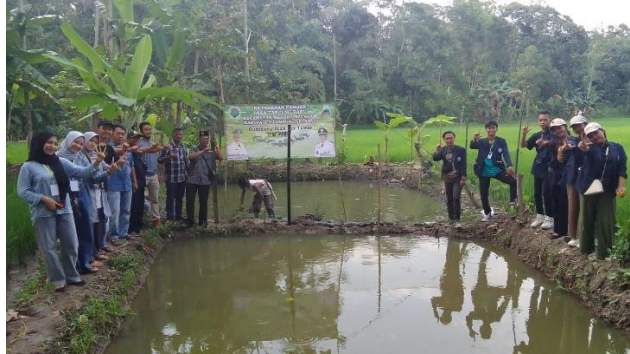
Gambar 2.3.6 Mengikuti program ketahanan pangan tentang budidaya ikan lele

Mengikuti program ketahanan pangan dengan menabur benih ikan lele untuk di budidayakan.