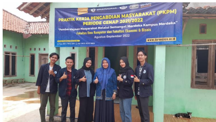
Gambar 2.3.13 Kunjungan dosen pembimbing lapangan

Kunjungan dosen pembimbing lapangan ini untuk melihat seberapa jauh progress mahasiswa PKPM Darmajaya di desa Tanjung Baru mengenai UMKM.