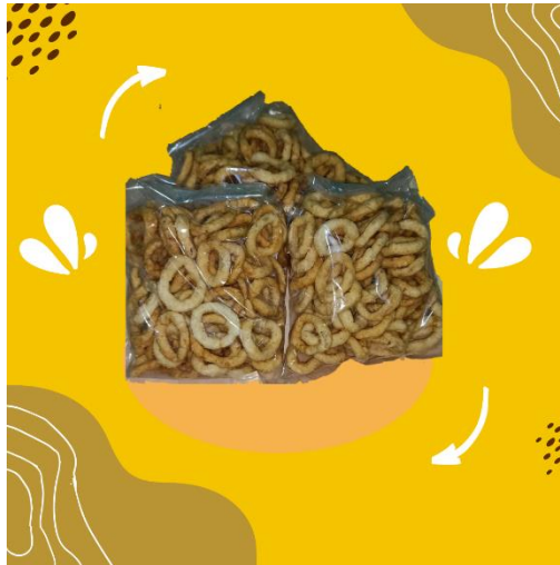
Gambar 2.1.1 Desain Konten Instagram Dan Facebook

Desain konten UMKM Kelanting Ibu Siti untuk Media promosi yang bersifat permanen dan mampu menampilkan informasi khusus lebih menarik.