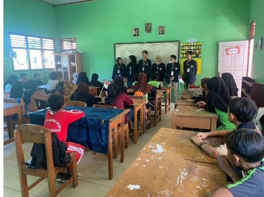
Gambar 2.3.4 Melakukan sosialisasi ke SD 2 Tanjung Baru

Memperkenalkan mahasiswa PKPM Darmajaya kepada murid-murid dan guru-guru di SD Sinar karya agar tali silaturahmi kami semakin luas di desa Tanjung Baru.