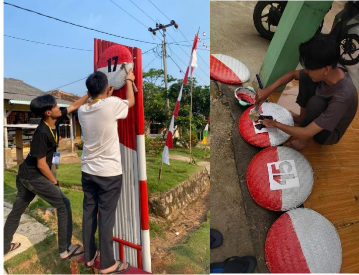
Gambar 2.3.2 Menghias Gapura di Dusun Balangandang Tanjung Baru

Mengikuti kegiatan persiapan Hari Kemerdekaan Republik Indonesia Ke-77.