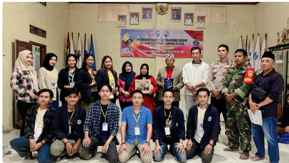
Gambar 2.3.19 Berpamitan dengan Kepala Desa Tanjung Baru beserta jajarannya

Acara pembubaran panitia penyambutan Bupati Lampung Selatan dan pelepasan mahasiswa PKPM Darmajaya.