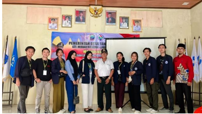
Gambar 2.3.16 Kegiatan sosialisasi tentang Microsoft Office kepada aparatur Desa Tanjung Baru

Melaksanakan kegiatan sosialisasi tentang Microsoft Office kepada aparatur Desa Tanjung Baru