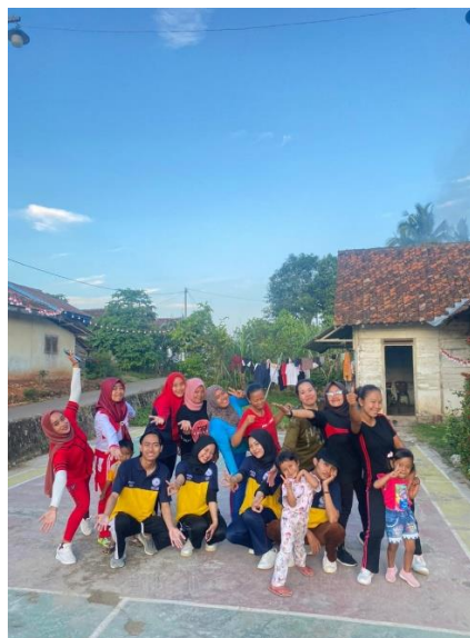
Gambar 2.3 11 Mengikuti kembali kegiatan senam jantung sehat bersama ibu-ibu kader

Mengikuti kembali kegiatan senam jantung sehat Bersama ibu-ibu kader di Dusun Balangandang Desa Tanjung Baru.