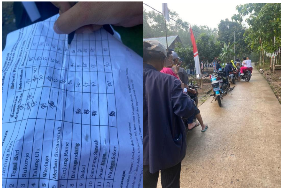
Gambar 2.3.8 Penilaian lomba dusun terbaik yang ada di Desa Tanjung Baru

Membantu menilai dusun terbaik yang ada di Desa Tanjung Baru.