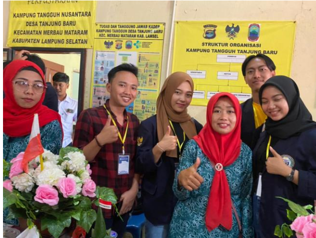
Gambar 2.3.10 Menjadi juri lomba dalam rangka memperingati HUT RI

Pada kegiatan ini menjadi juri lomba tumpeng antar dusun dalam rangka memperingati Hari Kemerdekaan RI ke-77 di balai desa Tanjung Baru.