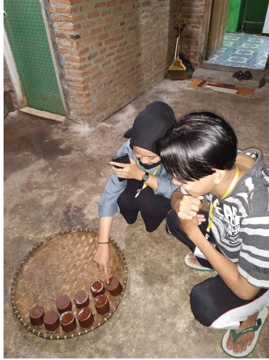
Gambar 2.3.12 Membantu pembuatan gula aren

Silaturahmi dan membantu pembuatan gula aren dari awal hingga selesai di Dusun Balangandang.