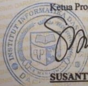
SUSANTI, SE., MM.