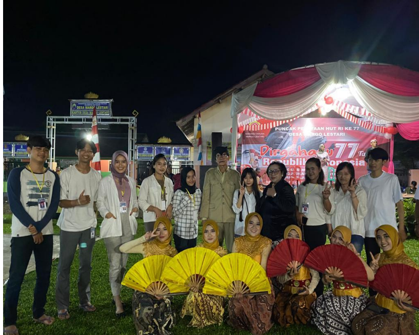
Gambar 2 Meramaikan acara malam puncak 17 Agustus