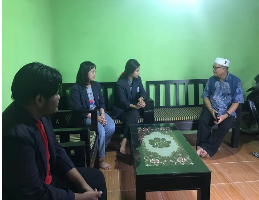
Gambar 5. Kunjungan Dosen Pembimbing