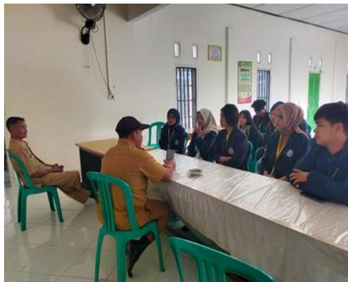
Gambar 1 Kunjungan ke Balai Desa

Beberapa dokumentasi kegiatan selama menjalankan kegiatan Praktek Kerja Pengabdian Masyarakat