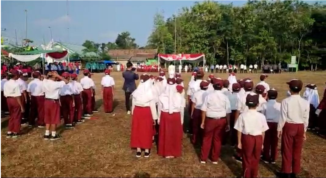
Gambar 12. Upacara Kemerdekaan Di Panca Tunggal