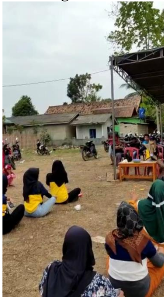
Gambar 14. Acara Lomba 17 Agustus 2022 Di Balai Desa