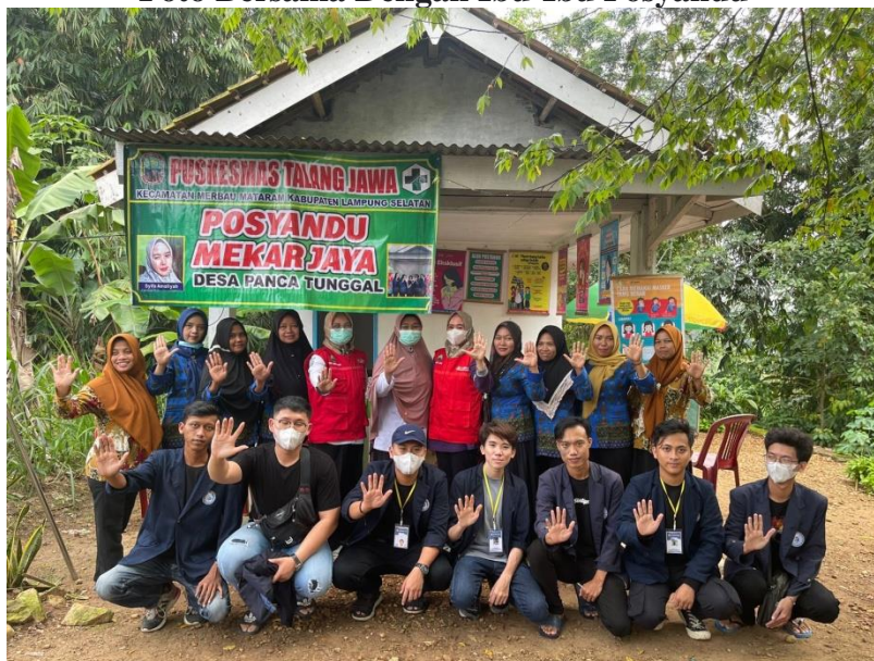
Gambar 16.Foto Bersama Ibu-Ibu Posyandu