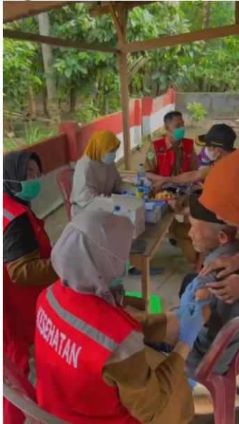
Gambar 19. Kegiatan Vaksin Lanjutan