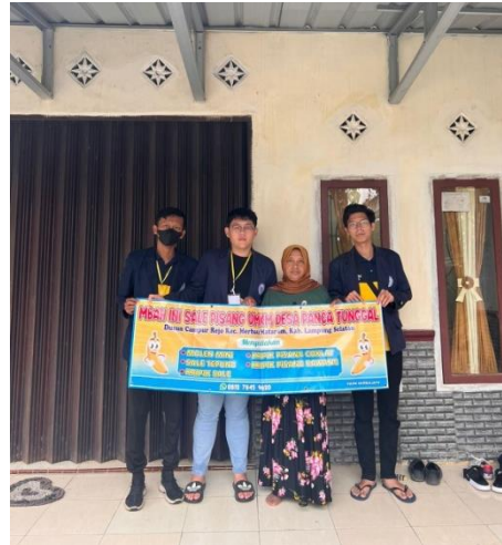
Gambar 5. Tampilan Banner Baru