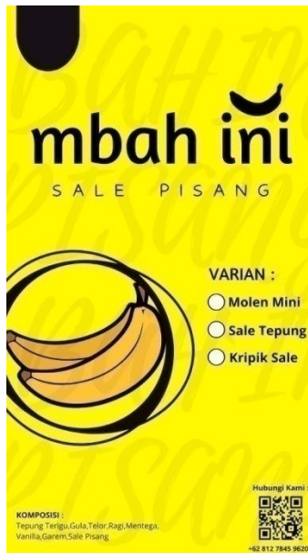
Gambar 2.Desain Kemasan Terbaru