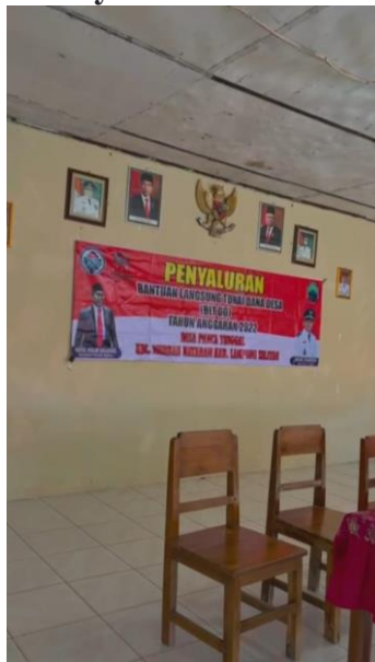
Gambar 18. Penyaluran BLT DD