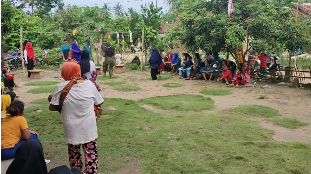
Gambar 15.Acara Lomba 17 Agustus 2022 Di Campurejo