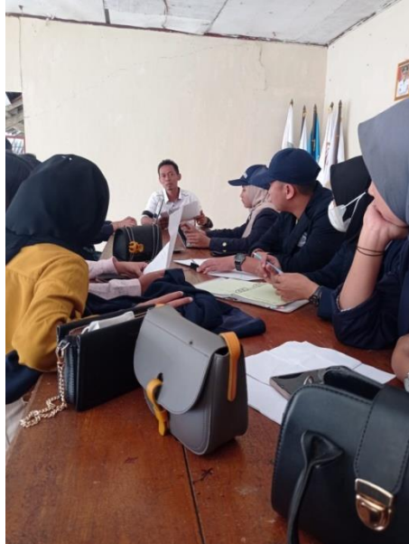
Gambar 13. Rapat Dalam Menentukan Lomba