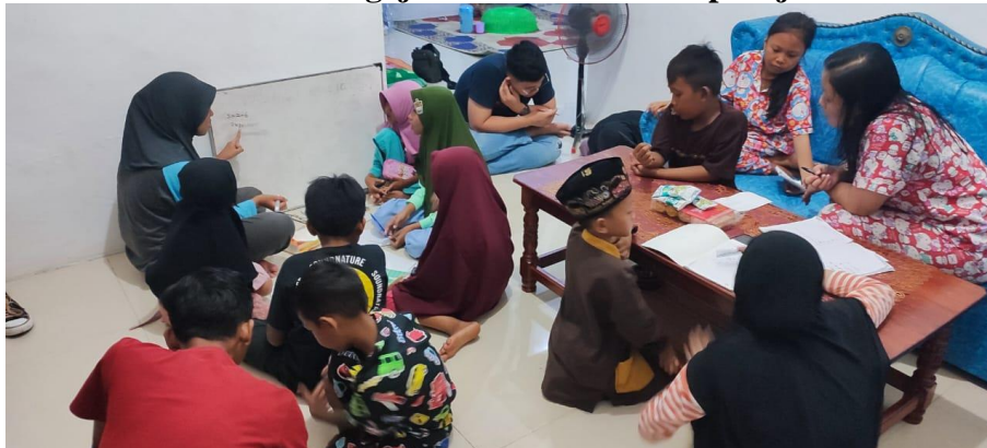
Gambar 20. Pembelajaran Gratis