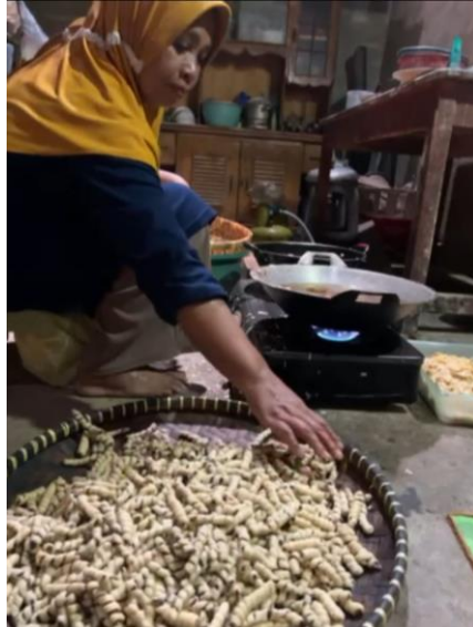
Gambar 10. Proses Penggorengan Molen Mini

Proses penggorengan dilakukan 2 kali, yang dimana wajan satu dengan tingkat panas sedang dan wajan satunya lagi dengan tingkat yang sangat panas. Ini bertujuan untuk mempercepat matangnya Molen Mini.