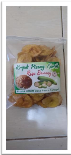
Gambar 3. Kemasan Lama