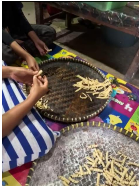
Gambar 9. Proses Pembuatan Molen Mini

Proses melitikan adonan Molen Mini untuk menciptakan produk yang unik agar dapat menarik konsumen yang melihatnya.