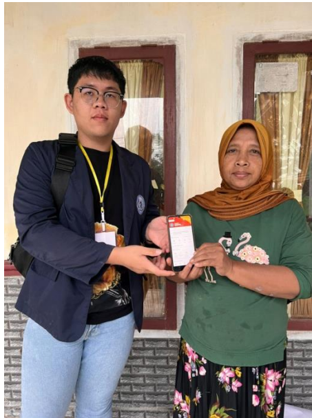
Gambar 1. Tampilan Akun Shopee