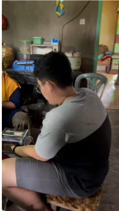
Gambar 8. Proses Penggilingan Adonan