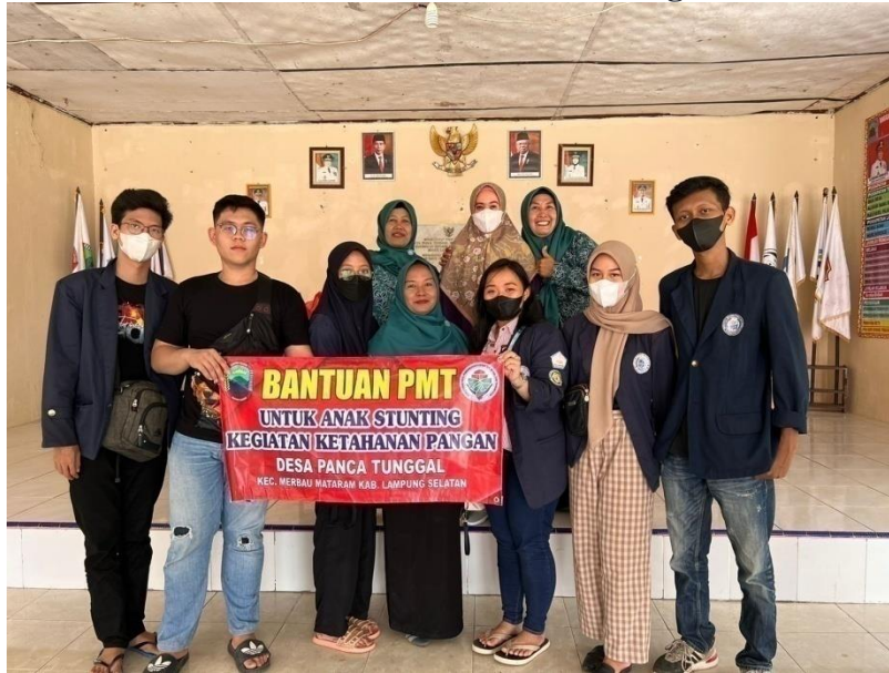
Gambar 17. Bantuan Untuk Anak Stunting