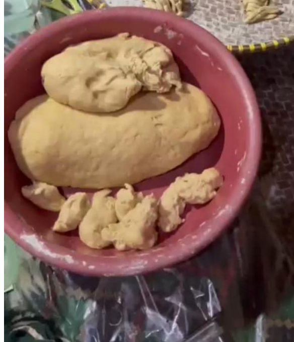
Gambar 7. Proses Pembuatan Adonan

Pembuatan adonan molen mini mencampur bahan-bahan seperti tepung terigu, gula, telur, ragi, mentega, vanilla, garam. Setelah itu tunggu beberapa menit biar adonan mengembang.