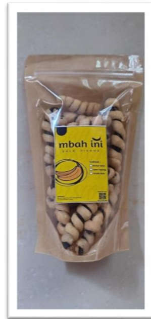
Gambar 4. Kemasan Terbaru