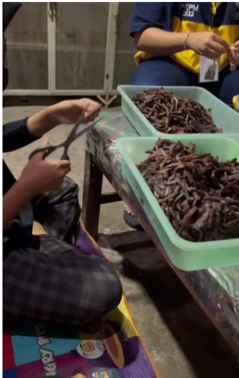
Gambar 6. Proses Pemotongan Sale Pisang

Sale Pisang yang sudah dikirim dari Lampung Barat , Dipotong kecil menggunakan gunting dan memanjang untuk bahan utama dari varian Molen Mini.