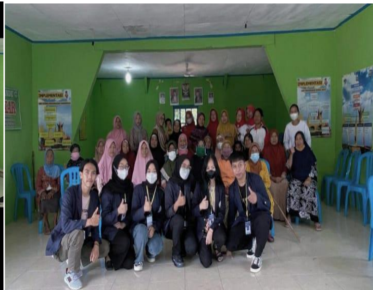
Foto Bersama NAKES dan masyarakat pada kegiatan Posyandu Lansia, Balita, dan Ibu hamil