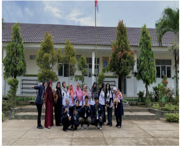
kegiatan belajar mengajar SDN 1 Wonodadi dan TK Dharma wanita