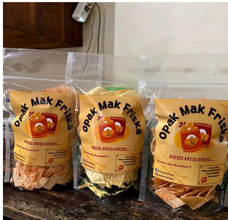
Produk Opak Singkong