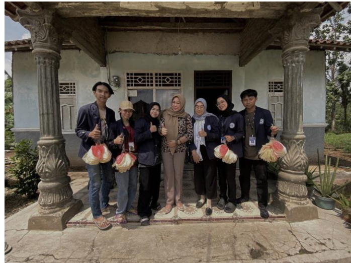
Kegiatan Pembuatan Opak Singkong dan kunjungan DPL