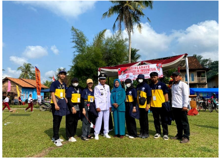
Perayaan HUT RI KE-77 bersama karang taruna dan kepala desa