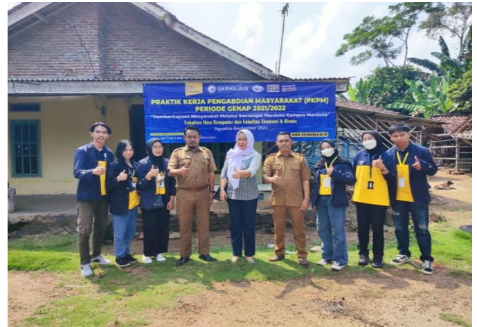
Kegiatan Pemberangkatan Para Peserta PKPM Di Kampus IIB Darmajaya