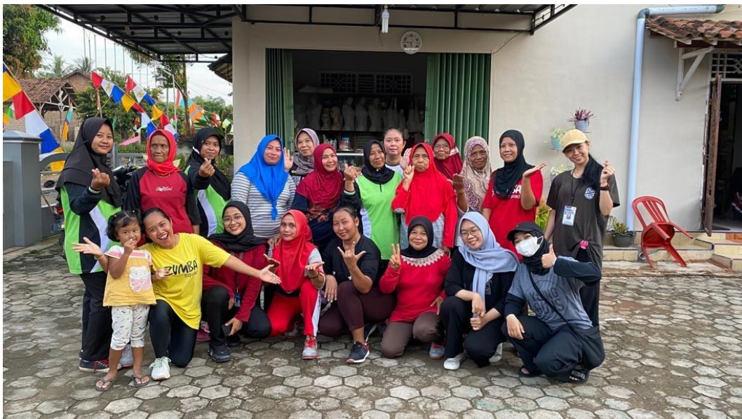
Kegiatan Senam Sehat Bersama ibu-ibu Desa Wonodadi